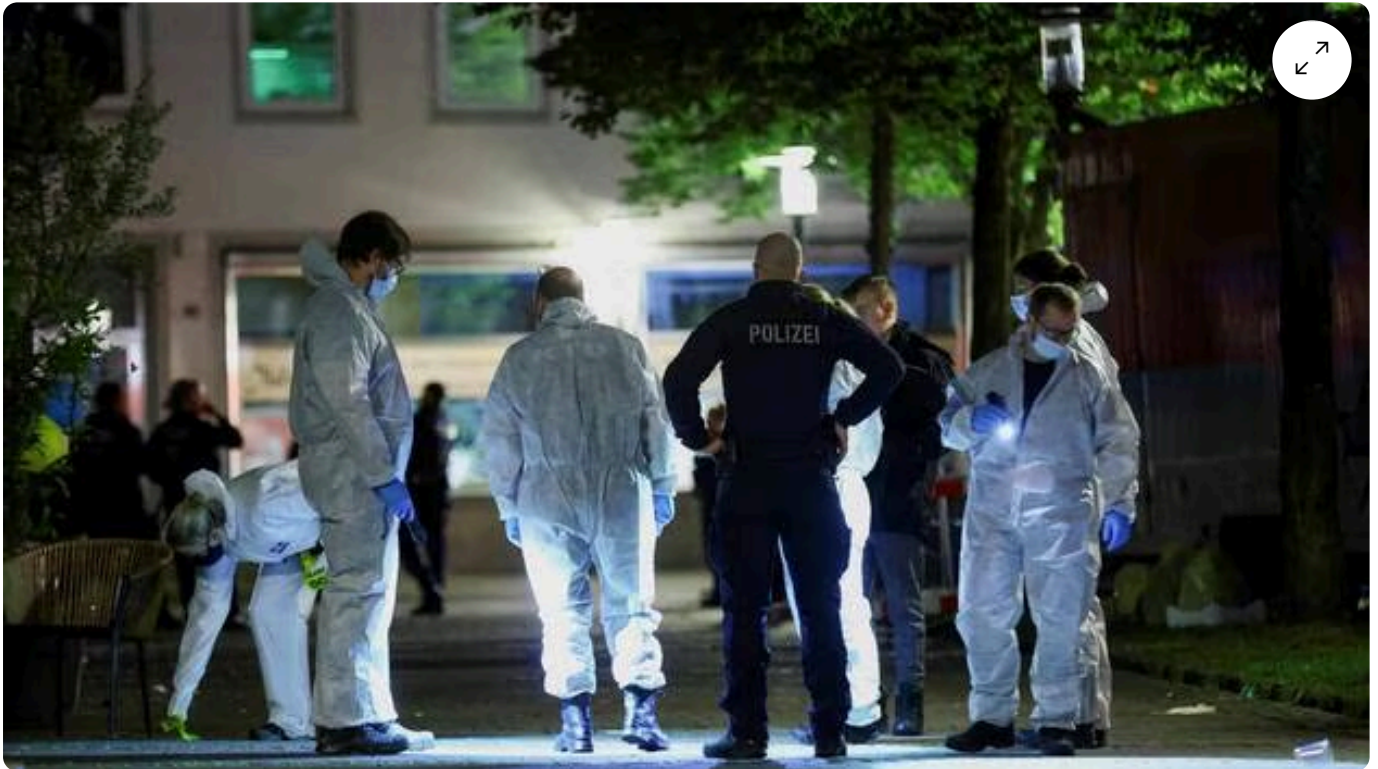
Trois personnes ont été tuées par un individu armé d'un couteau.

La fête communale de la ville Solingen, dans l'ouest de l'Allemagne, a tourné au drame vendredi soir lorsqu'un homme armé d'un couteau a frappé plusieurs personnes. Trois d'entre elles sont décédées et quatre autres grièvement blessées. L'individu est parvenu à prendre la fuite.