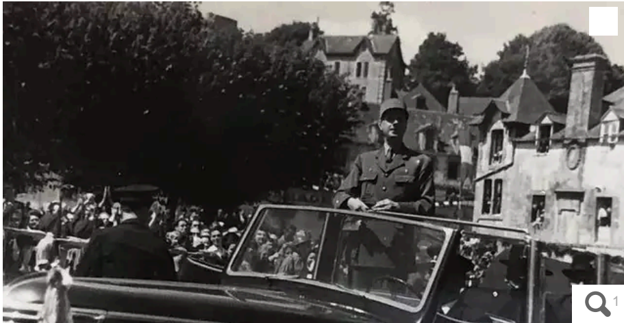
1945, Charles de Gaulle est de passage à Quimperlé. Il est en basse-ville, sur une place qui porte désormais son nom.

Votre e-mail, avec votre consentement, est utilisé par la société Additi Multimedia pour recevoir les newsletters sélectionnées. En savoir plus