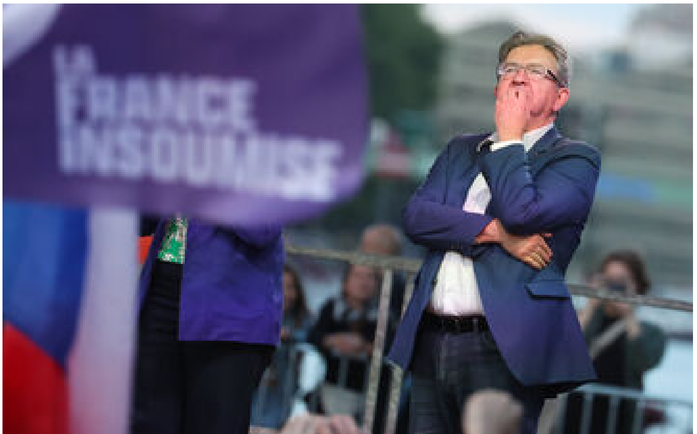
LFI menace Emmanuel Macron d'engager une procédure de destitution et dénonce un « coup de force institutionnel »