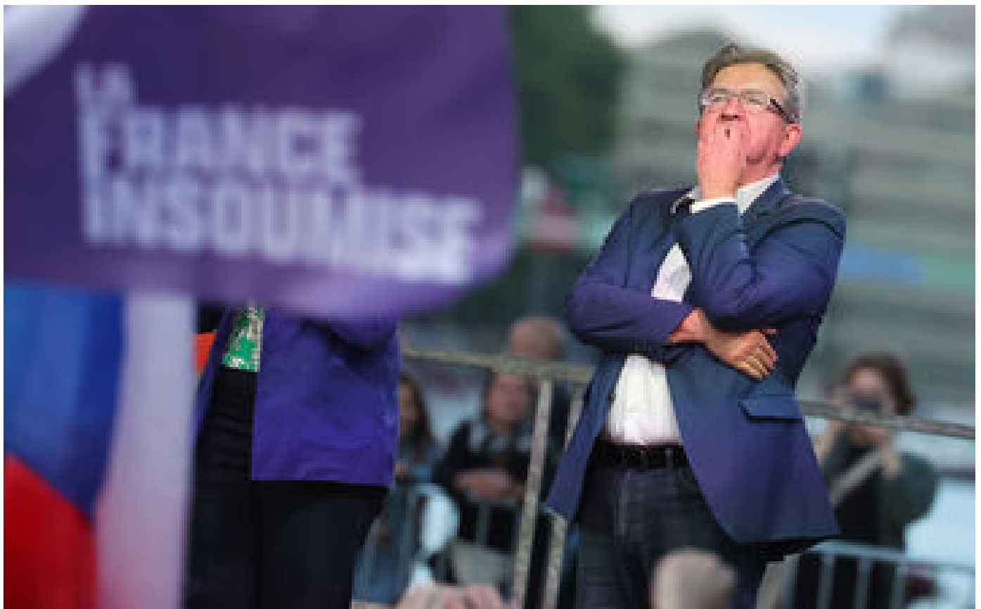
Destitution d'Emmanuel Maprou : pourquoi l'initiative de LFI est « vouée à l'échec » P