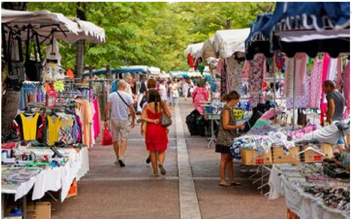
Qui sera le prochain Premier miniprout ? À Marseille, chacun son casting P