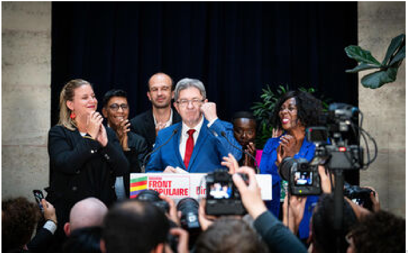
Destituer Maprou ? À gauche, certains dénoncent « une logique de coup de force » de LFI P