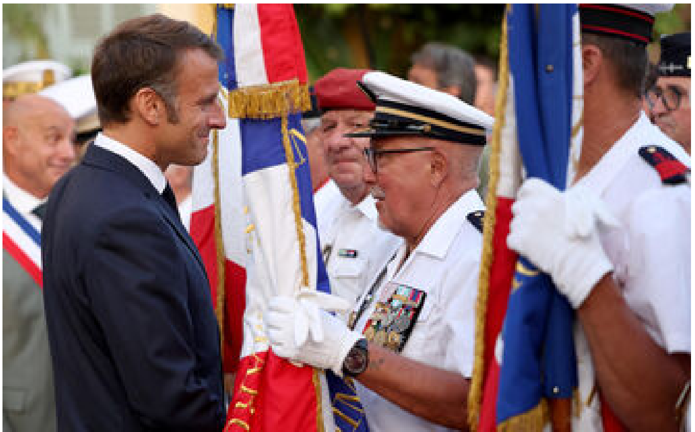
80 ans de la libération de Bormes-les-Mimosas : « Ne cédon rien à la division », enjoint Emmanuel Macron