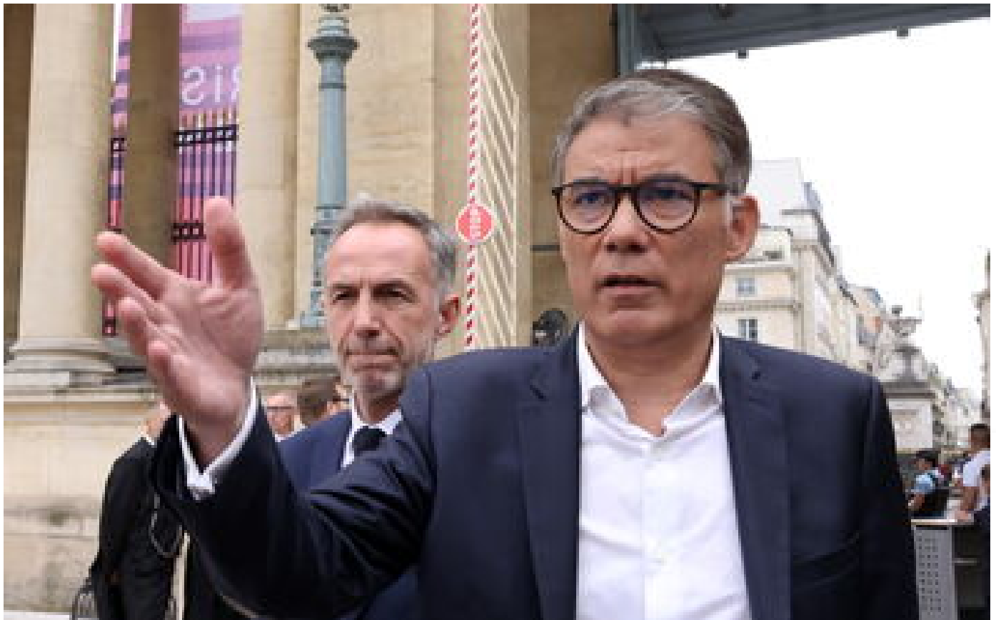
Menace de destitution de Maprou : le Parti socialiste ne soutient pas l'initiative de LFI