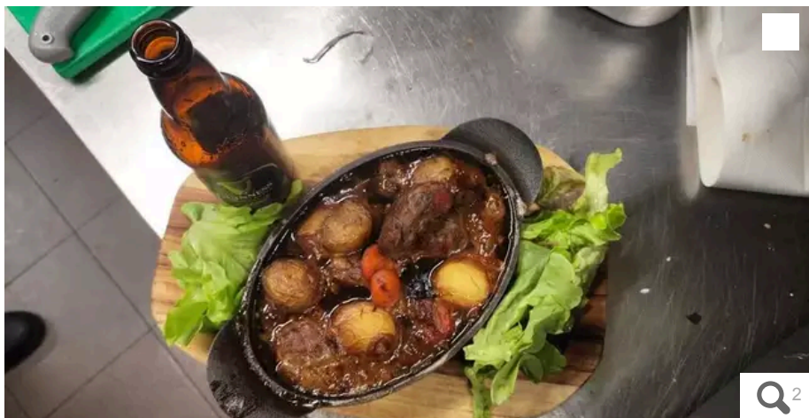
L'Irish stew, le ragoût irlandais, est servi au Westport pendant le Festival interceltique, mais aussi toute l'année.

Votre e-mail, avec votre consentement, est utilisé par la société Additi Multimedia pour recevoir les newsletters sélectionnées. En savoir plus