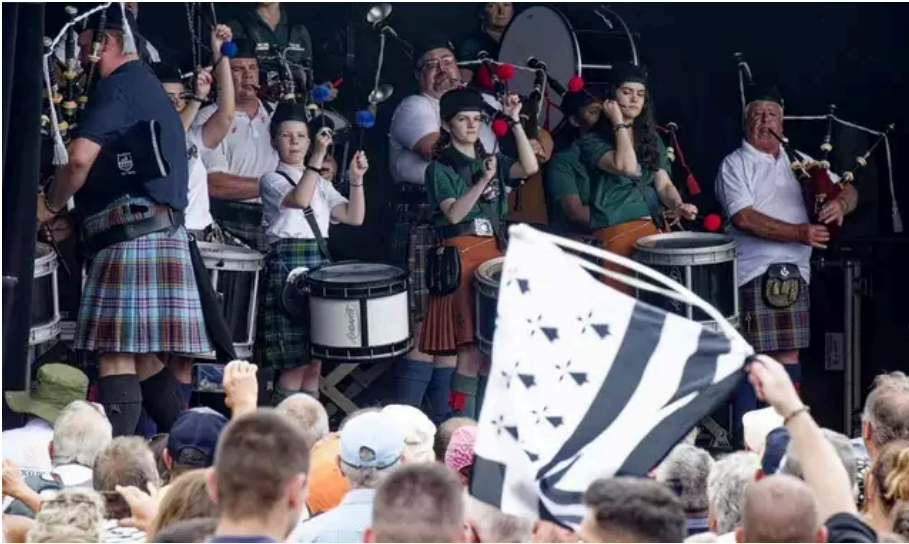
Piobairi na mumhan Pipe Band (Irlande).