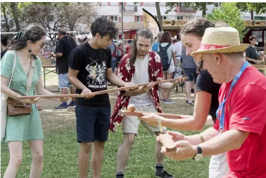
Rollit, un jeu de l'île de Man.