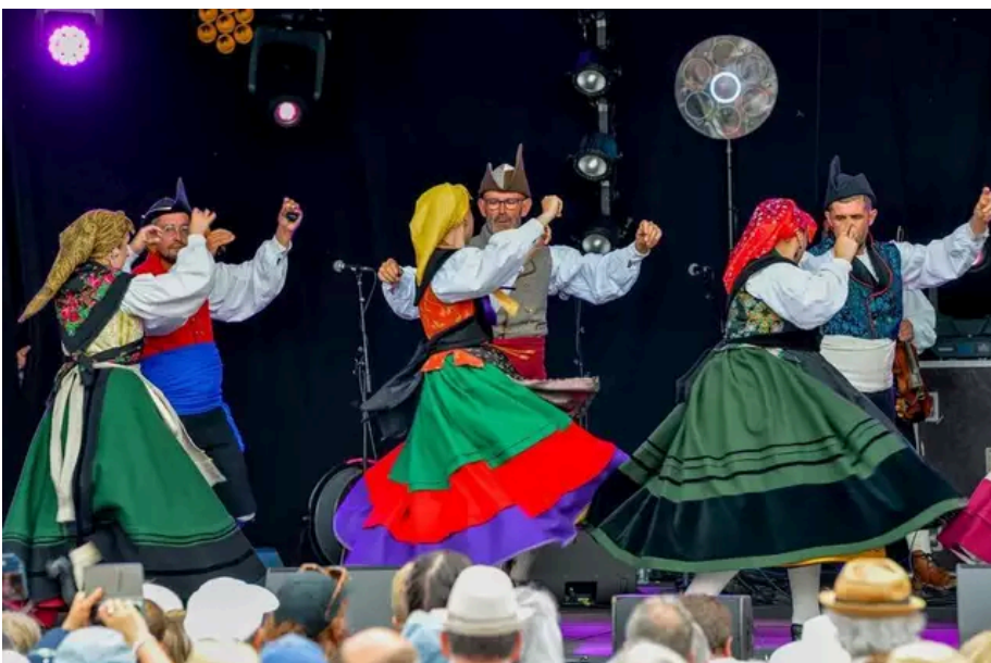
Grupo de baile Escontra'l Raigafu (Asturies) sur la place des Pays Celtes au Festival Interceltique.