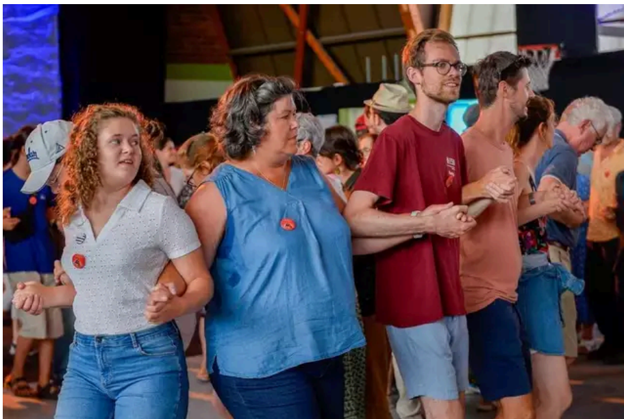
Un atelier de cours de danses bretonnes dans la salle Carnot.