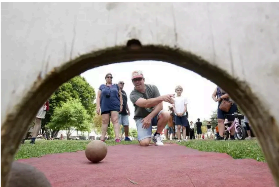
Le trou du chat, un jeu breton.