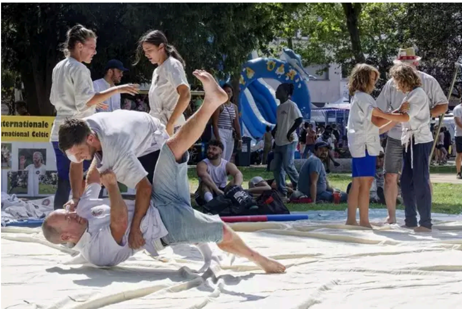
Initiation au gouden, la lutte bretonne.