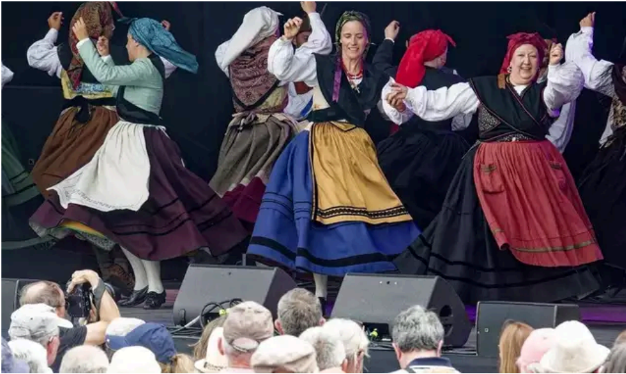
Grupo de Baile Escontra'l Raiganu (Asturies). Sur la scène de la place des Pays Celtes, dans le cadre des propositions Musiques et danses celtiques.