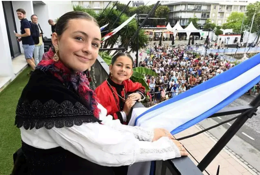
Coup d'envoi du Festival Interceltique de Lorient : ce sont les jeunes qui ont déployé les drapeaux. Ici les galiciens.