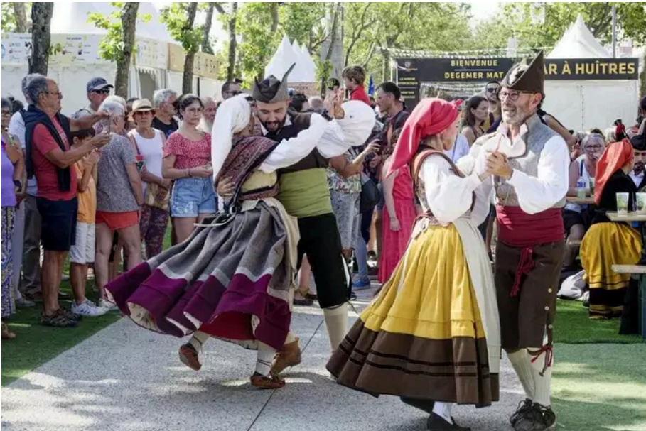
Grupo de Baile Escontra'l Raiganu (Asturies) dans les allées du festival. On boit, on chante, on danse après le passage sur la scène.