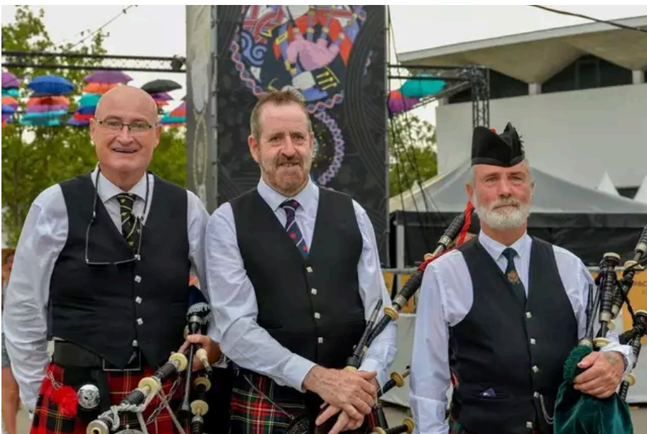
Le Scottish Pipe Band (Écosse) a animé la place des Pays Celtes au Festival Interceltique.