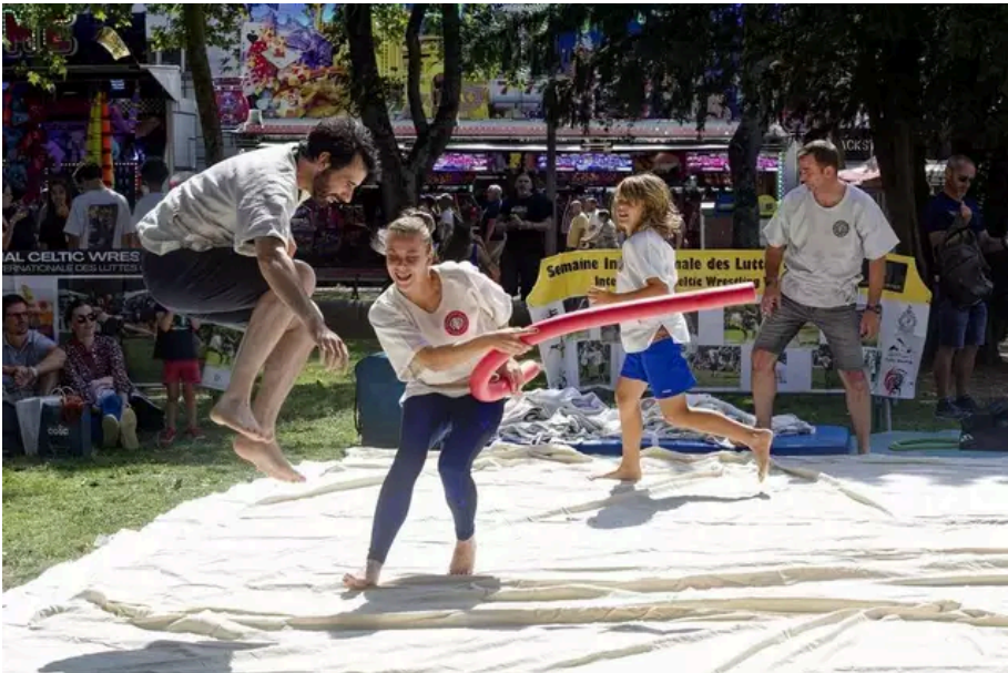
Initiation au gouden, la lutte bretonne.