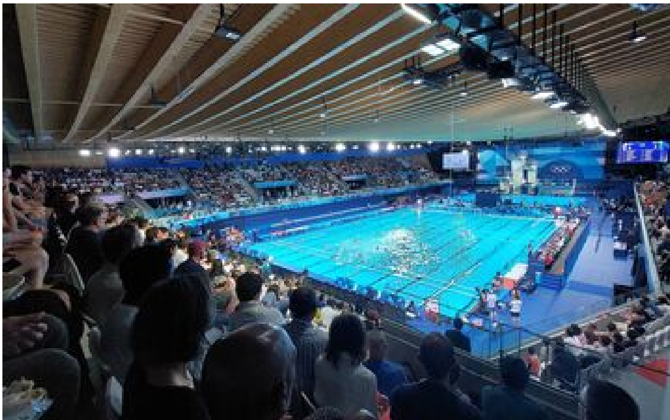
JO Paris 2024 : ces sites olympiques de Seine-Saint-Denis qui tirent leur révérence