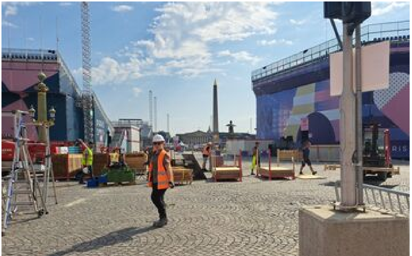
Place de la Concorde, Champ-de-Mars... après les JO, Paris se transforme pour les Jeux paralympiques P