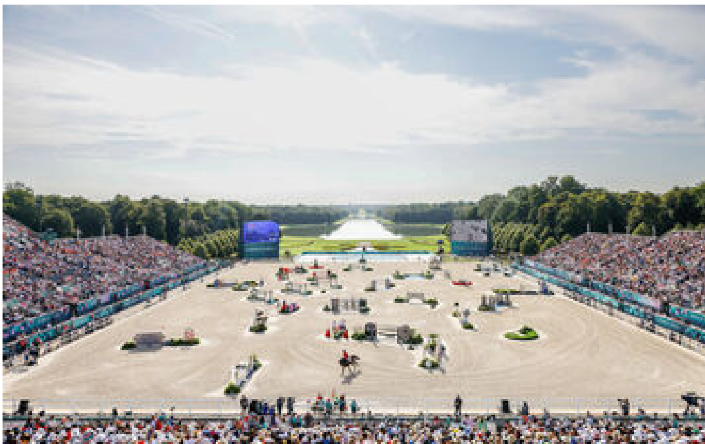
« Juste magique » : aux JO, le décor du parc du château de Versailles a subjugué les cavaliers amateurs P