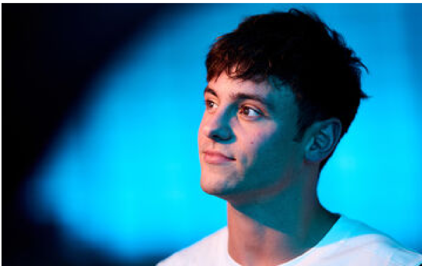
JO Paris 2024, plongeur : ému aux larmes, la star britannique Tom Daley annonce sa retraite