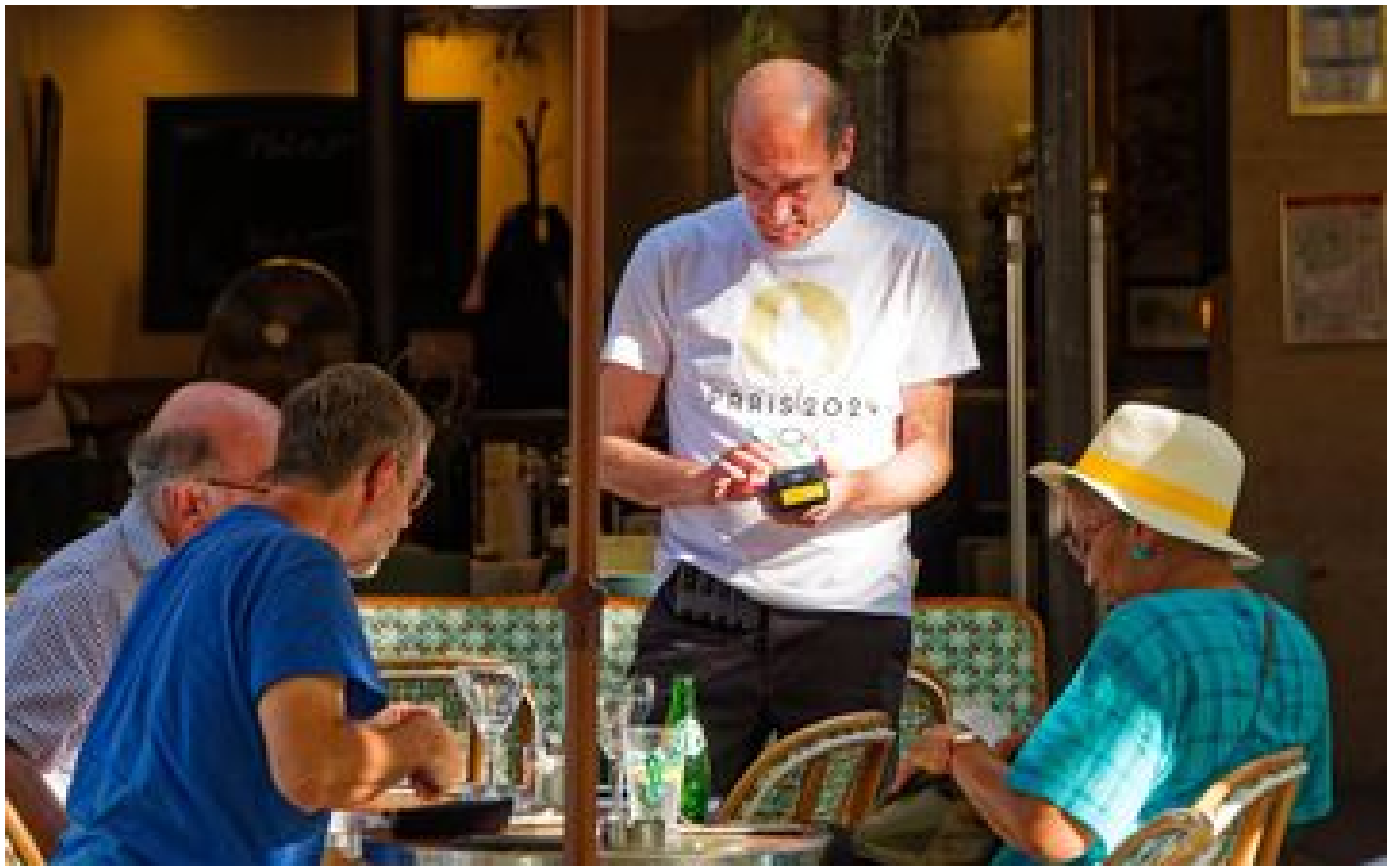
Les hôteliers sourient, les restaurateurs pleurent : le bilan du tourisme contrasté après les JO de Paris P