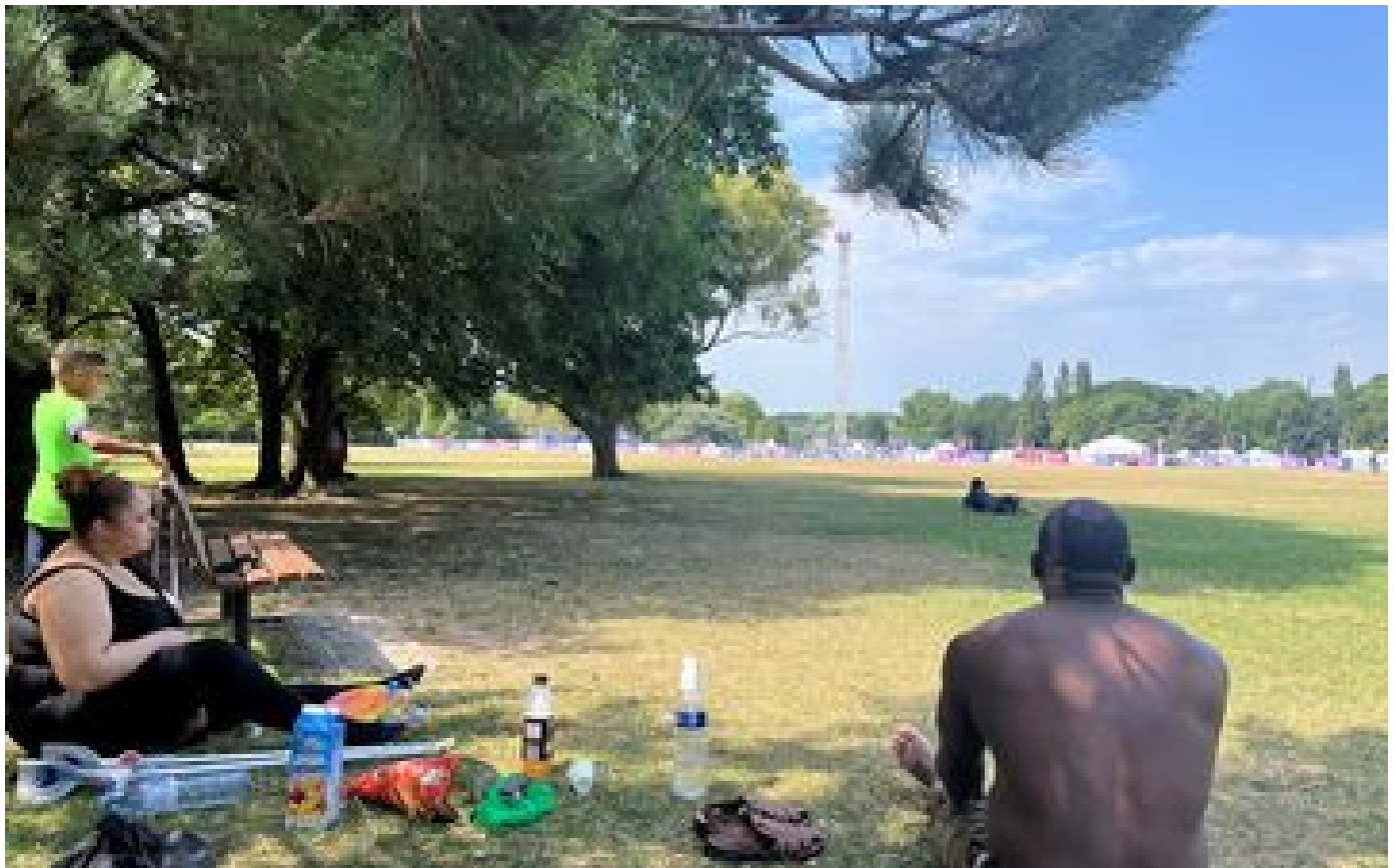
Fin des activités, tour panoramique payante... À La Courneuve, le blues post-olympique du parc Georges-Valbon P