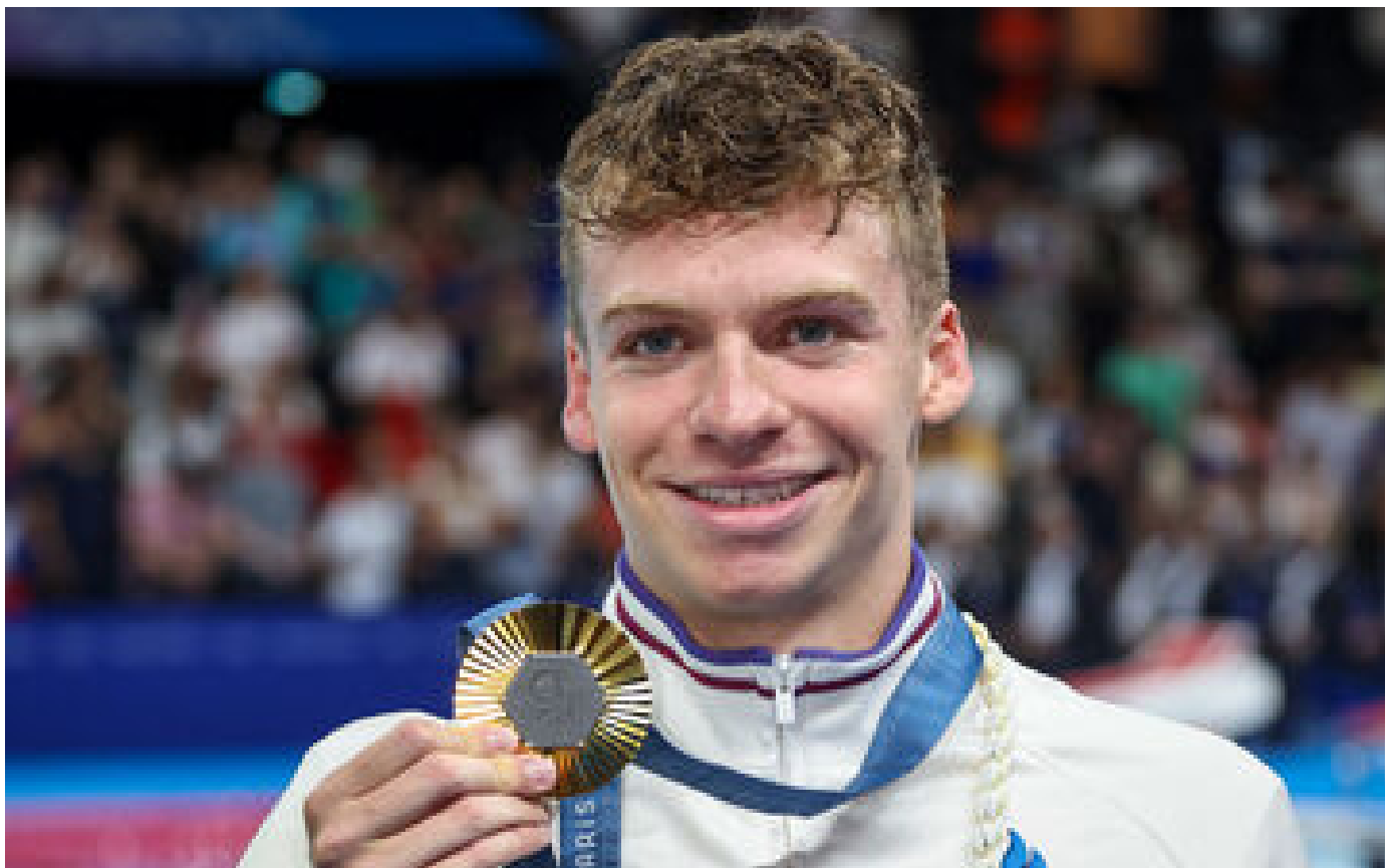
Dupont, Marchand, Biles, Khelif... Ce sont les stars de ces Jeux olympiques P