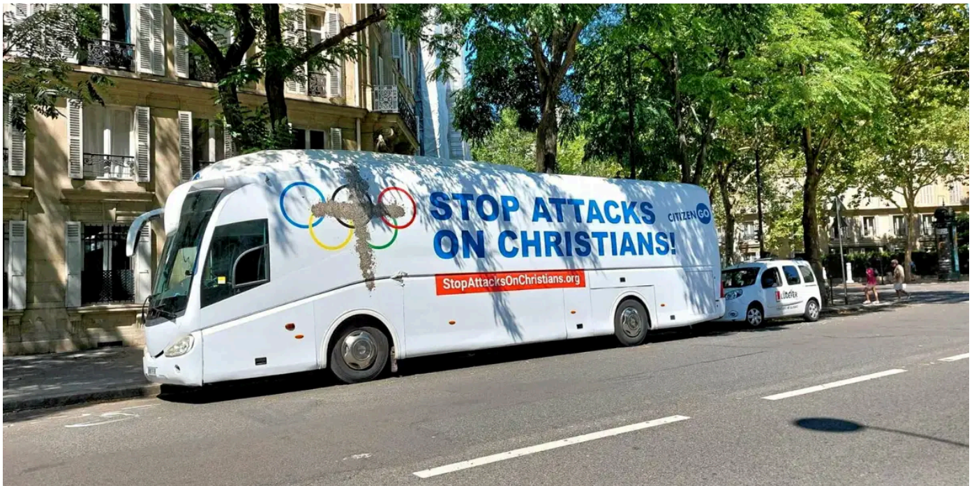
Paris, avenue de Wagram (17 e ), le 6 août 2024. Le car floqué par l'association conservatrice CitizenGO.