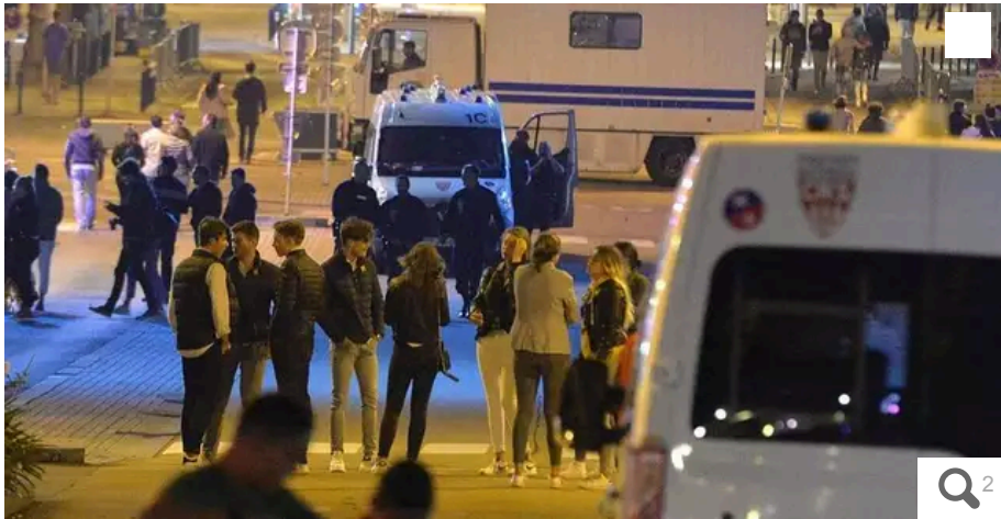
Lors d'une précédente édition du Festival interceltique de Lorient, quai des Indes, quand les vigiles de la SGS repoussaient patiemment et sans heurt les festivaliers vers les arrêts de bus, tandis que les CRS suivaient à distance.

Votre e-mail, avec votre consentement, est utilisé par la société Additi Multimedia pour recevoir les newsletters sélectionnées. En savoir plus