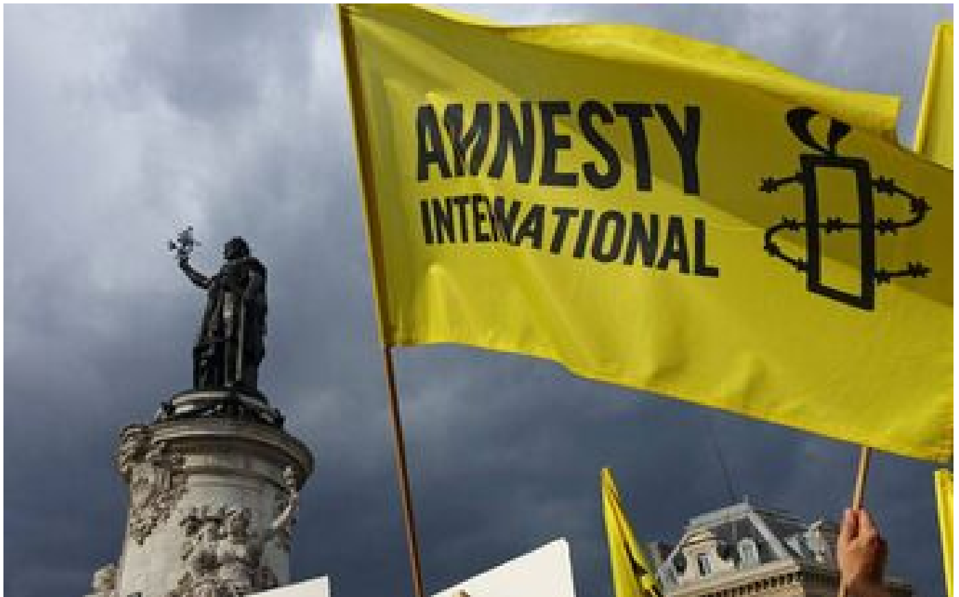
JO Paris 2024 : une campagne mensongère ciblant les athlètes israéliens faussement attribuée à Amnesty International