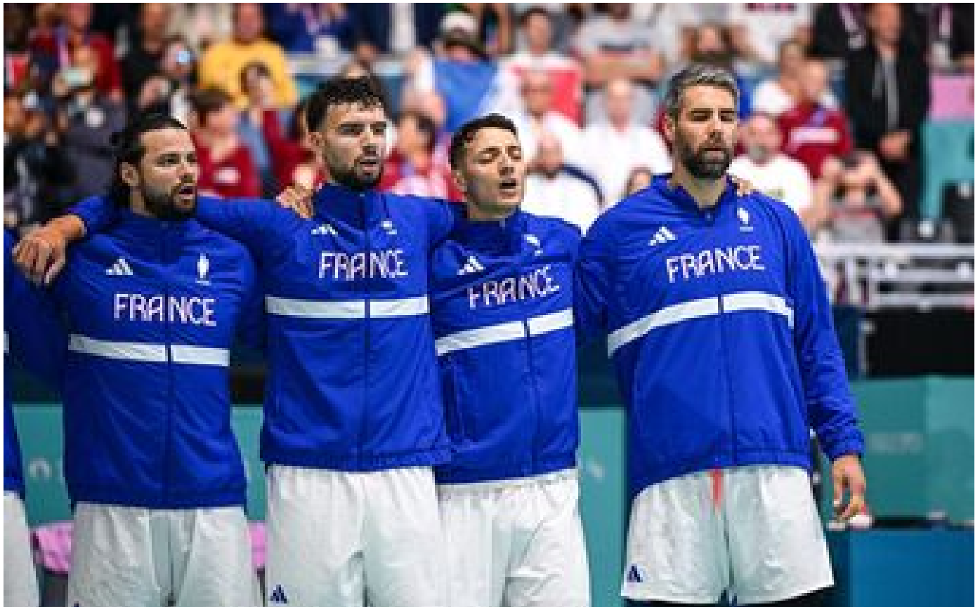
DIRECT. JO Paris 2024 : les Bleus du handball doivent se remettre à l'endroit face à la Norvège