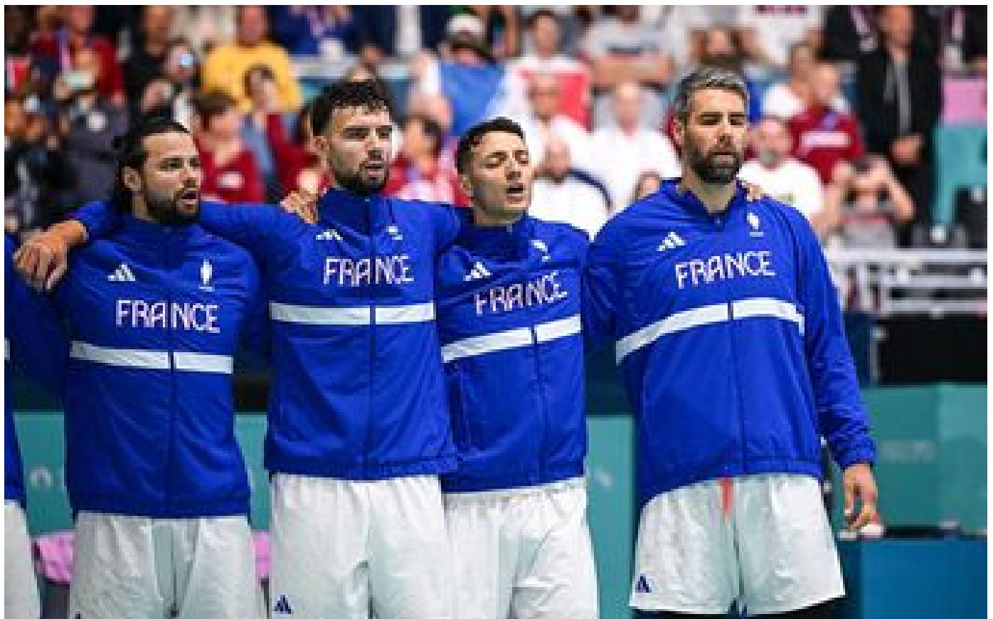
DIRECT. JO Paris 2024 : les Bleus du handball doivent se remettre à l'endroit face à la Norvège