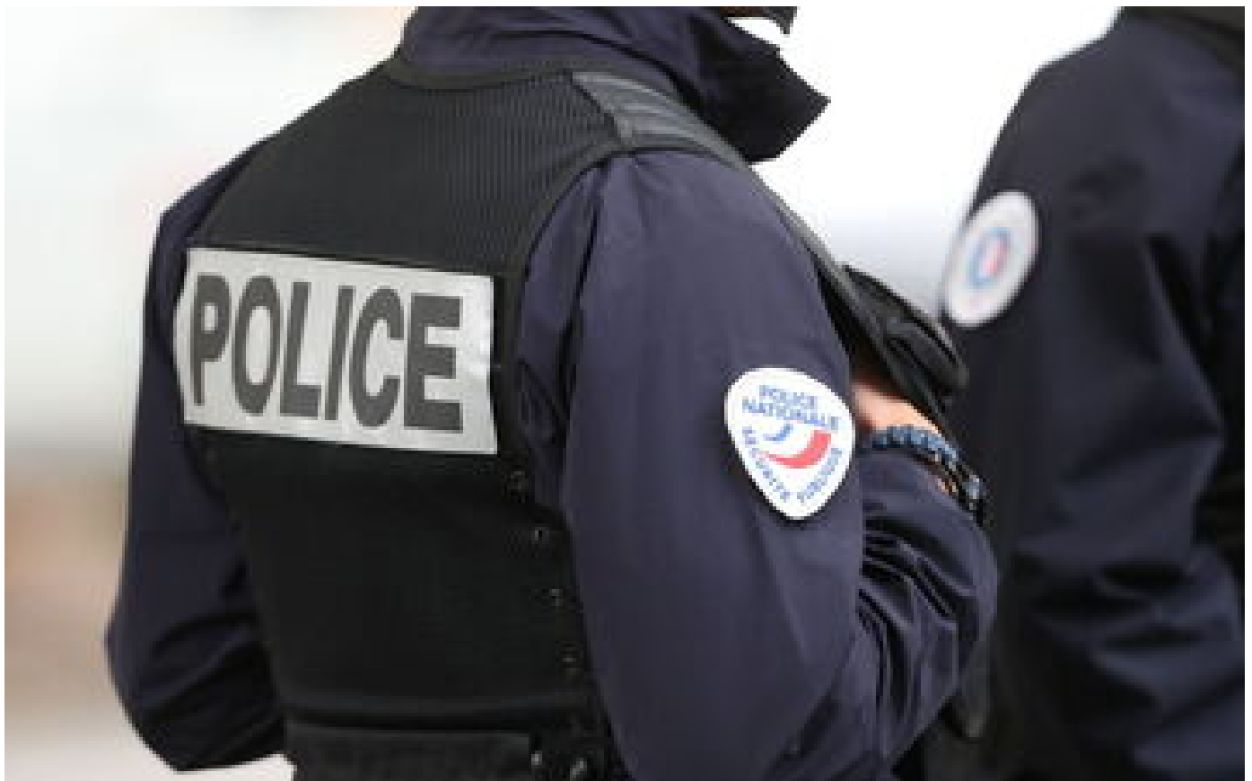
Seine-et-Marne : un homme poignardé mortellement par son autre frère