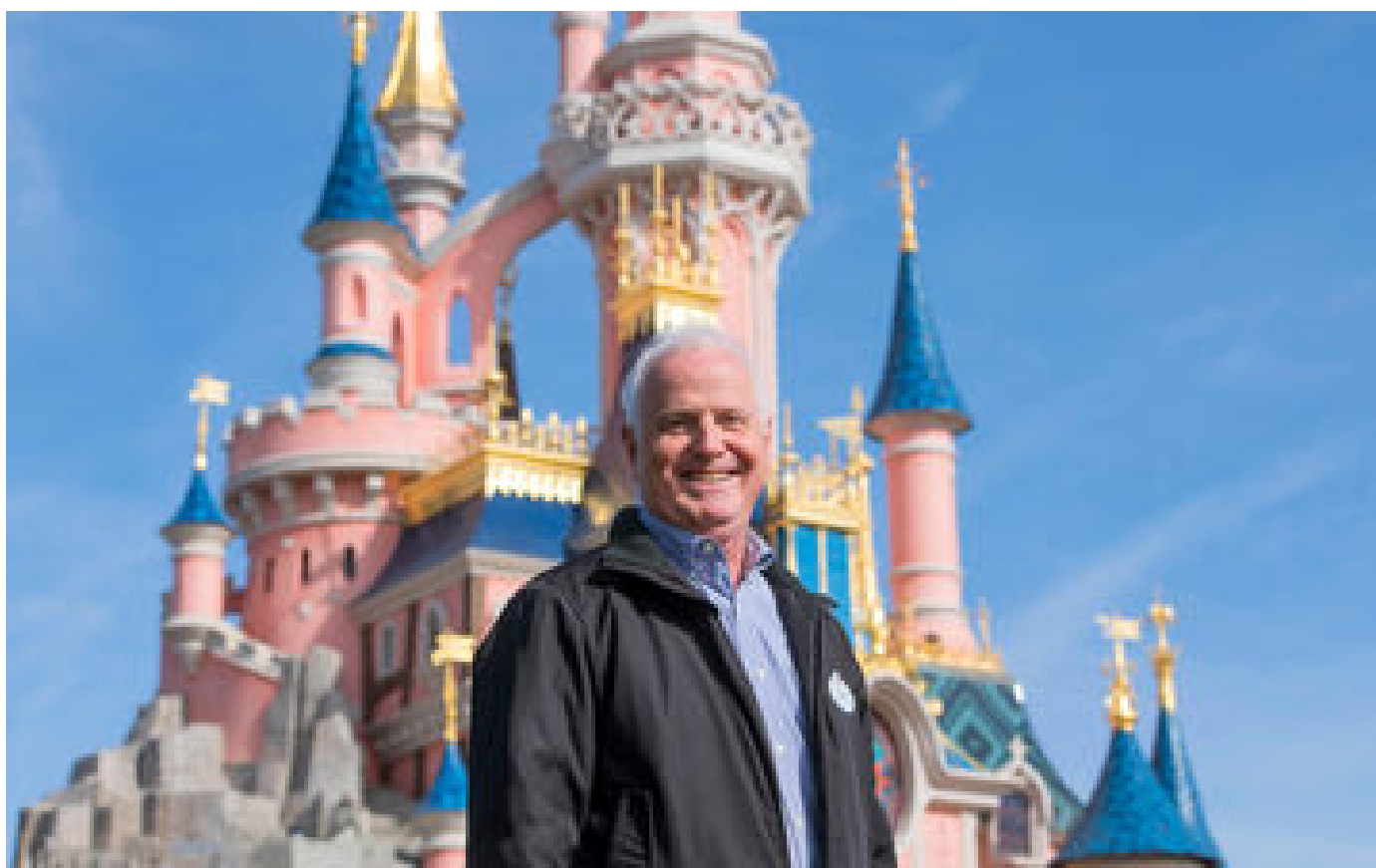
Nouveau parc à Disneyland Paris : « Les visiteurs veulent jouer un rôle dans les histoires qu'ils adorent » P