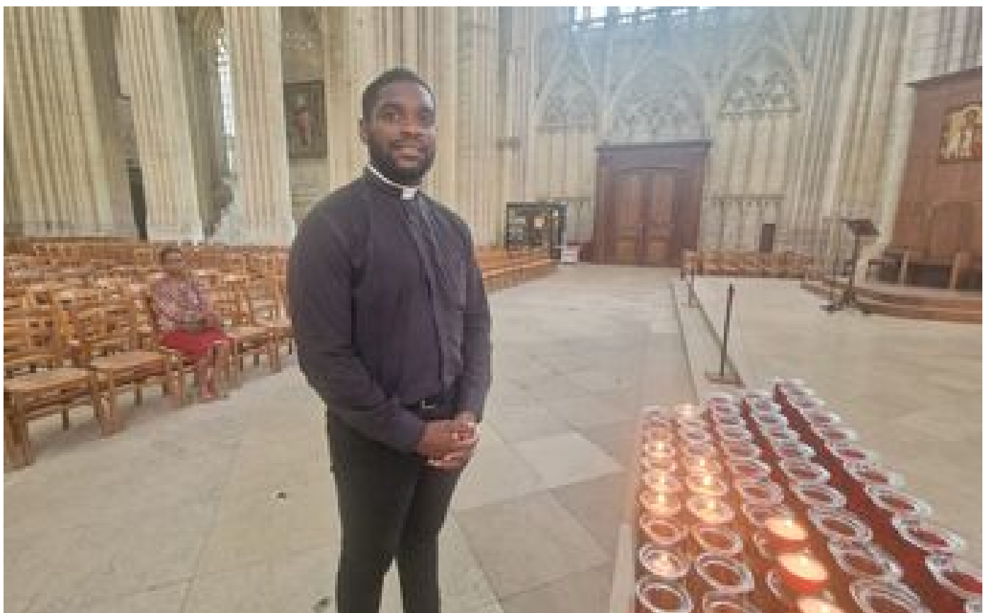
JO Paris 2024 : à 28 ans, cet ancien judoka est le patron des aumôniers catholiques du village olympique P