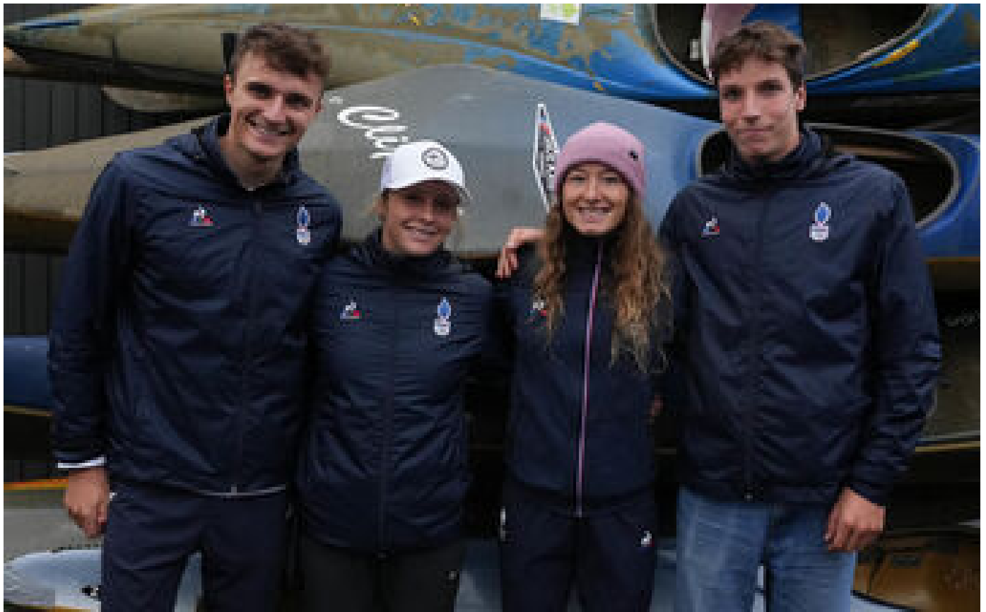
JO Paris 2024, canoë-kayak : « On a eu un groupe magique », la vie des quatre amis à Vaires-sur-Marne P