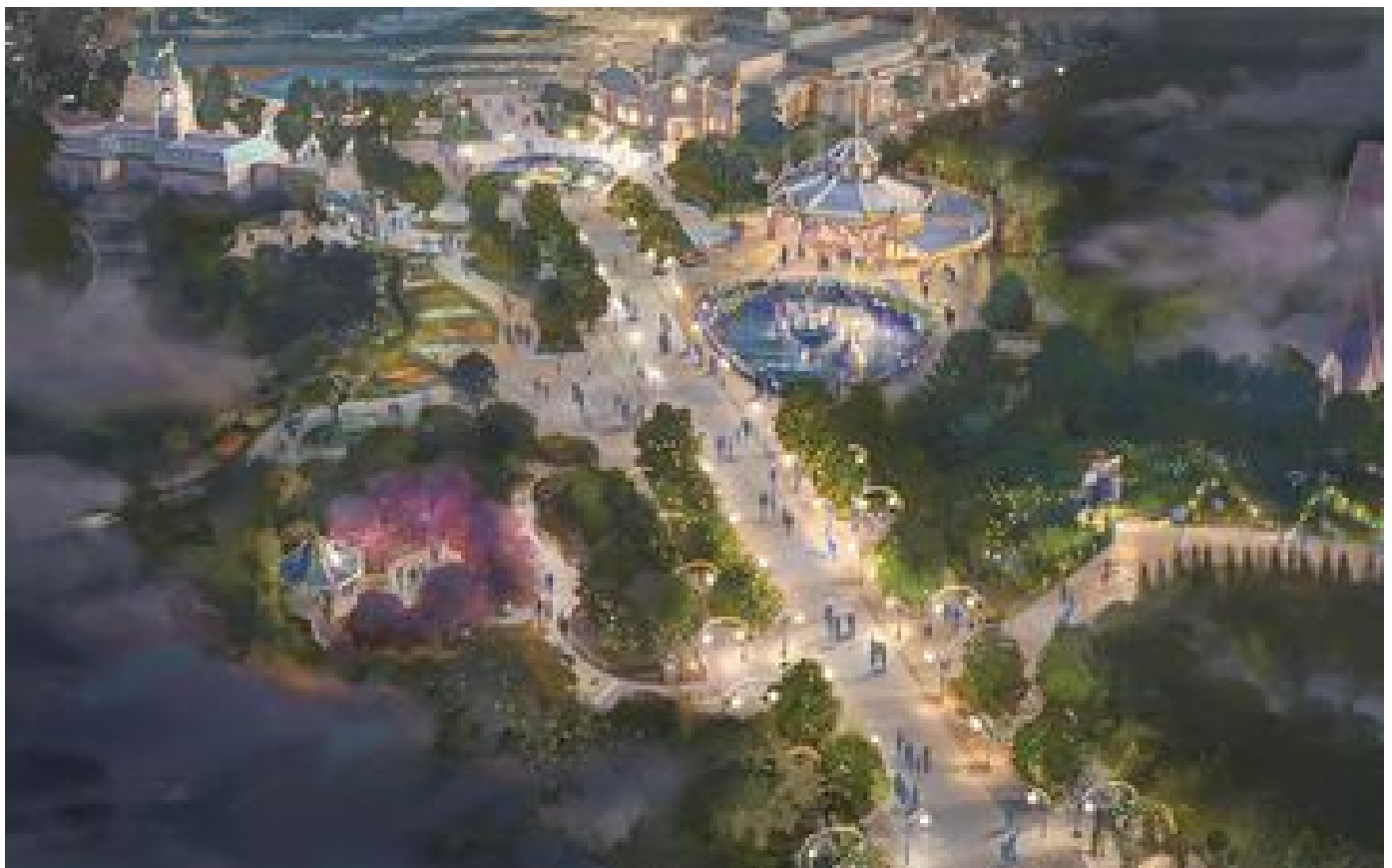
Un « land » Reine des Neiges, un lac géant, une attraction Raiponce... Découvrez le futur Disney Adventure World