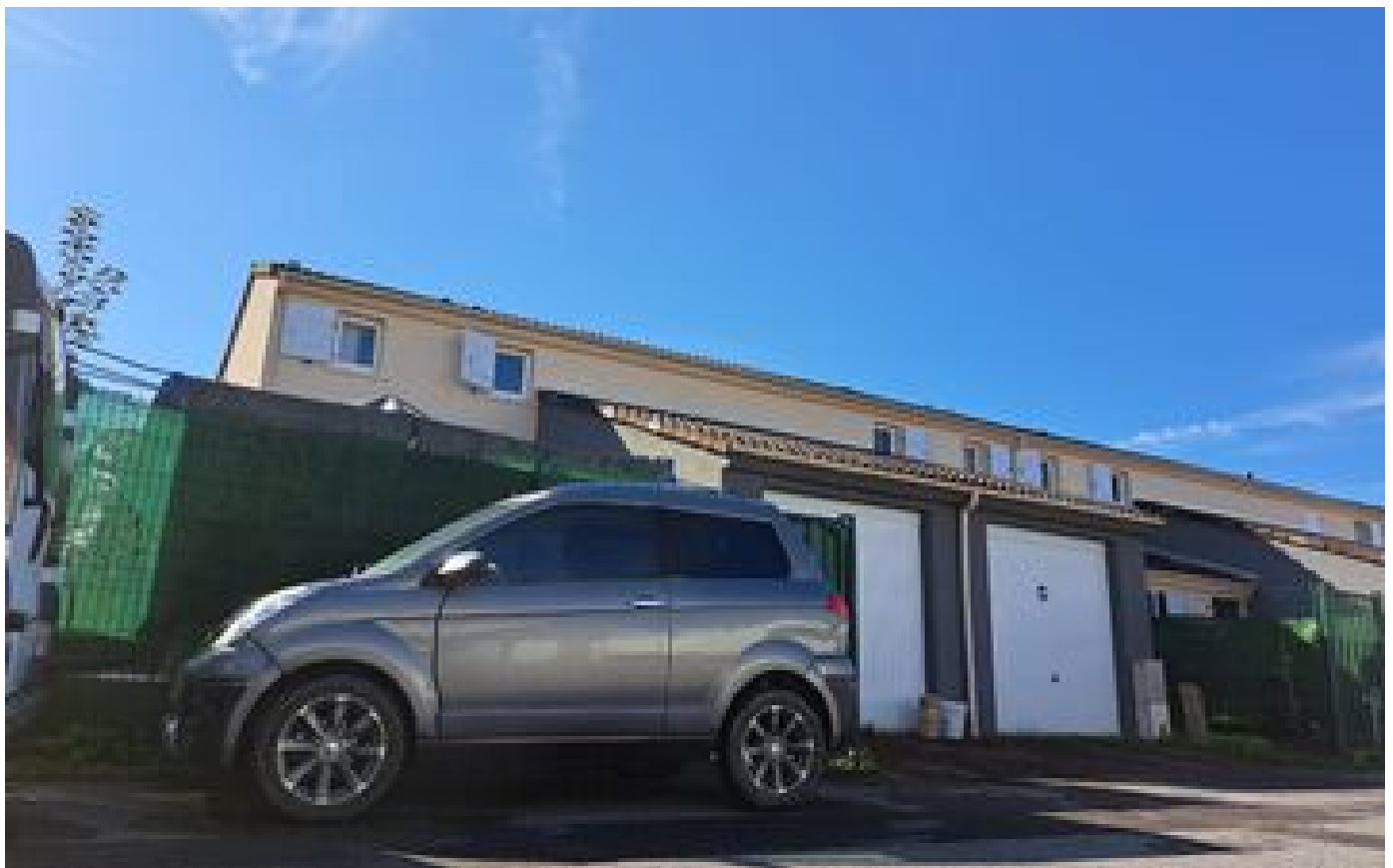
« Il sortait de l'hôpital » : un homme tue son frère à coups de couteau à Meaux P