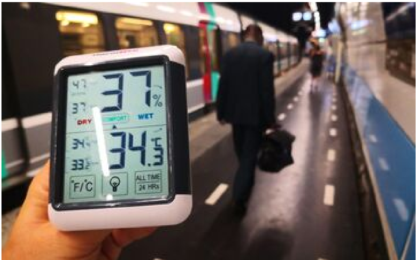
Briquettes d'eau, brumisateurs, éventails... Les transports franciliens passent en « plan canicule » P