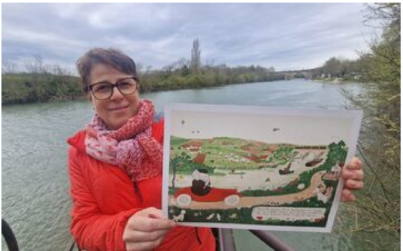
Babar a vu le jour au bord de la Marne : Chessy a compté pour Laurent de Brunhoff P