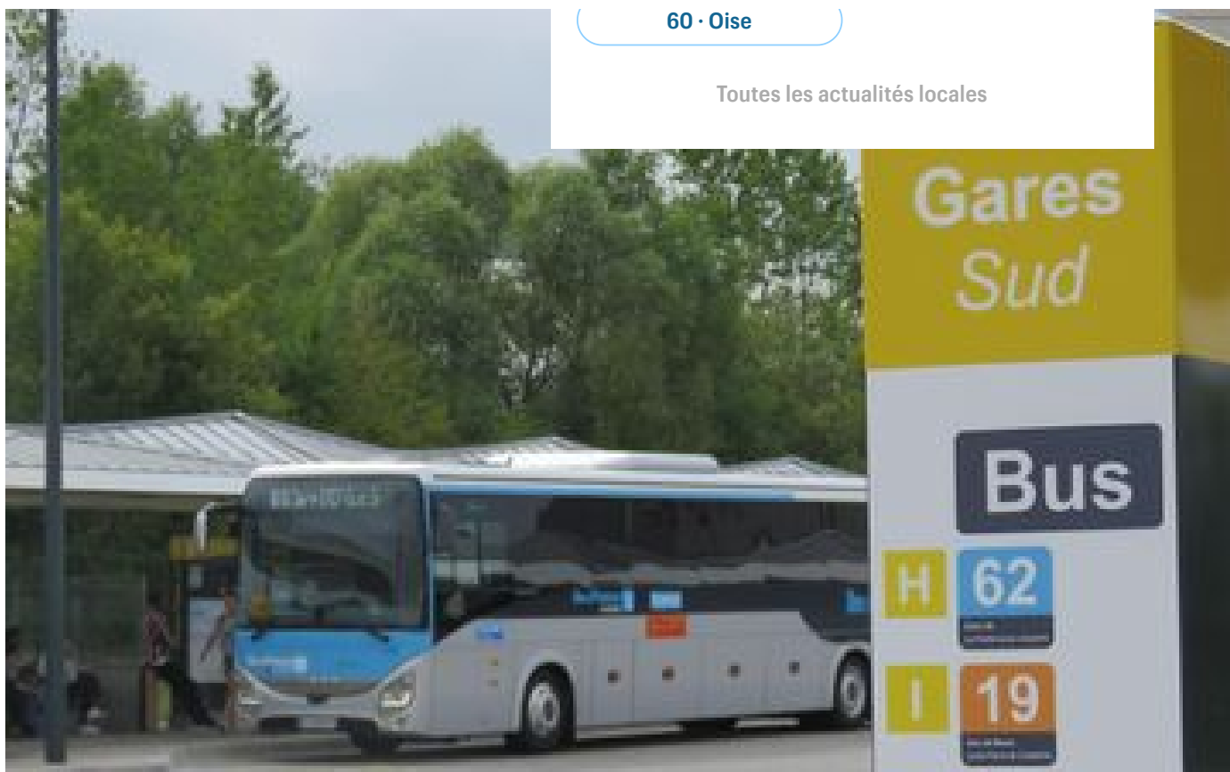
Chessy : un enfant de 7 ans grièvement blessé après avoir été percuté par un bus