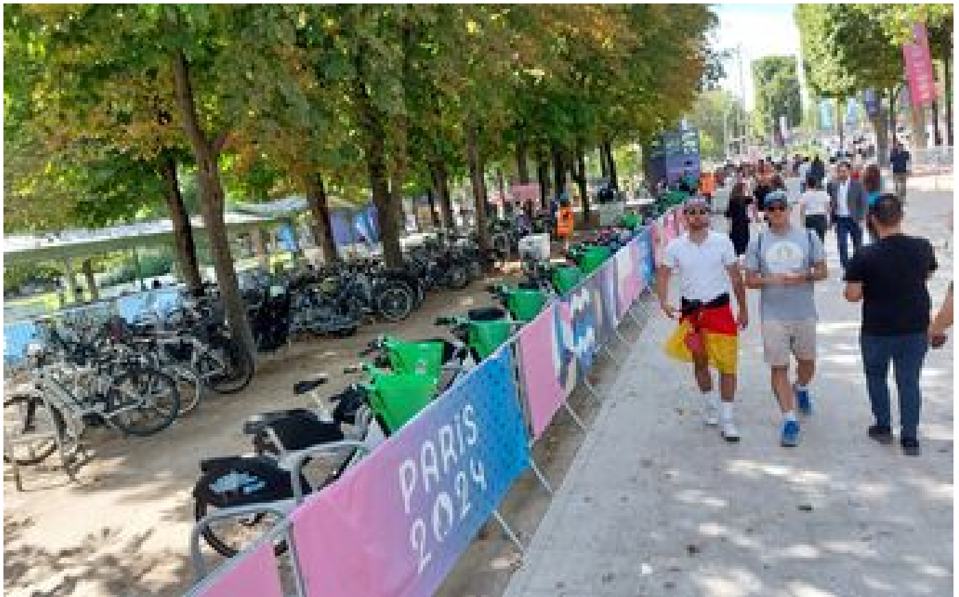
« Vive la Vélorution ! » : autour des sites de compétition des JO, le succès des parkings à vélos P