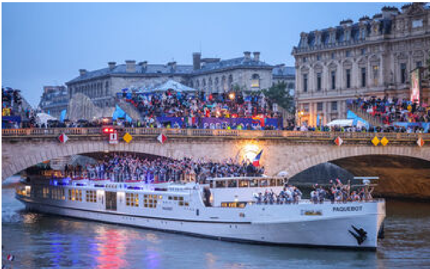
Cérémonie d'ouverture des JO 2024 : l'organisation présente ses excuses « si des gens ont été offensés »