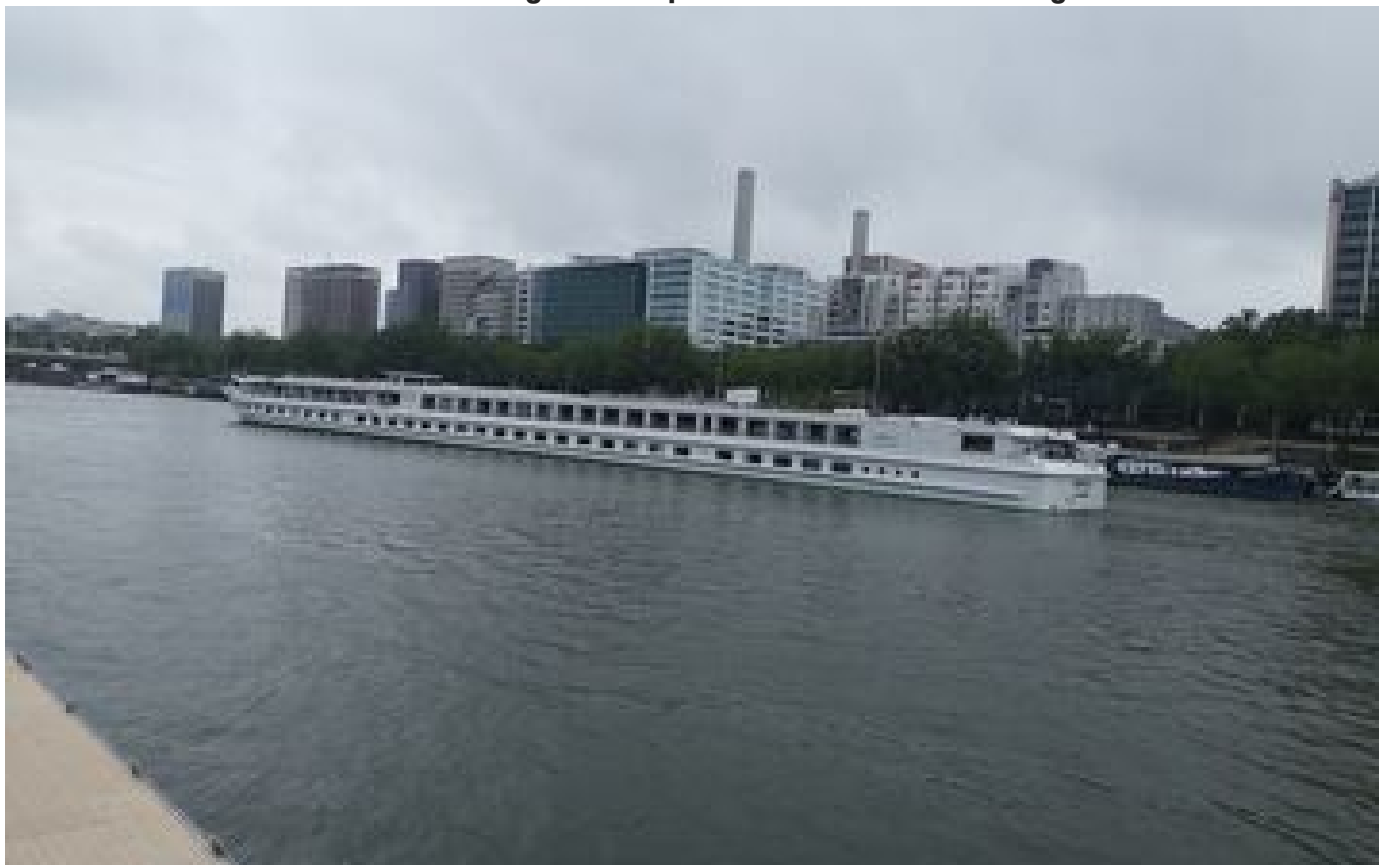
JO Paris 2024 : sur la Seine, la navigation fluviale perturbée « quasiment tous les jours » P