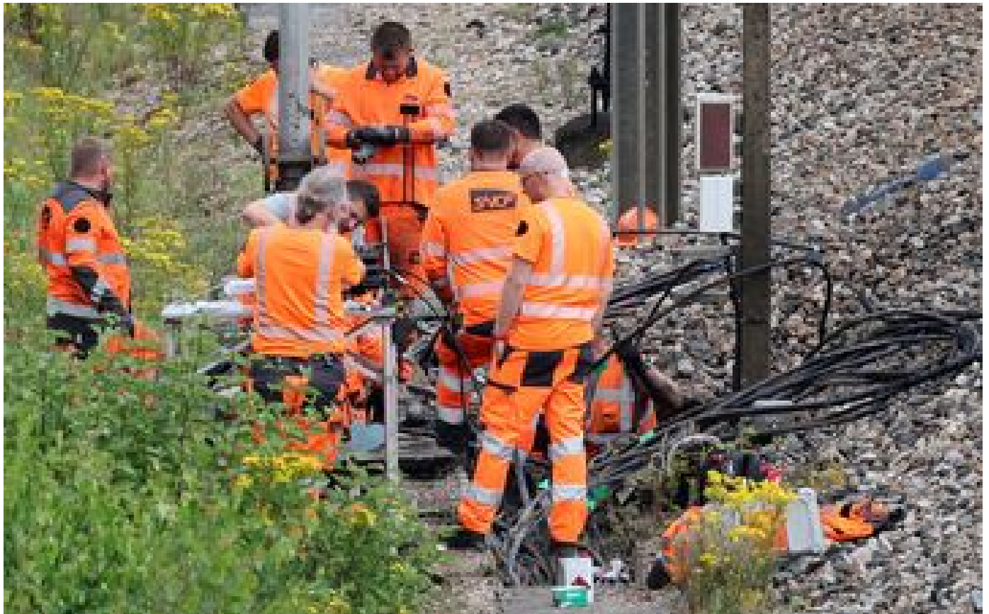
Sabotage sur le réseau SNCF : un week-end de marathon pour tout réparer P