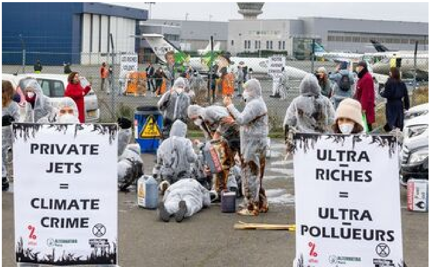
J0 Paris 2024 : une « menace écologiste radicale » pèse sur les aéroports, selon une note du renseignement