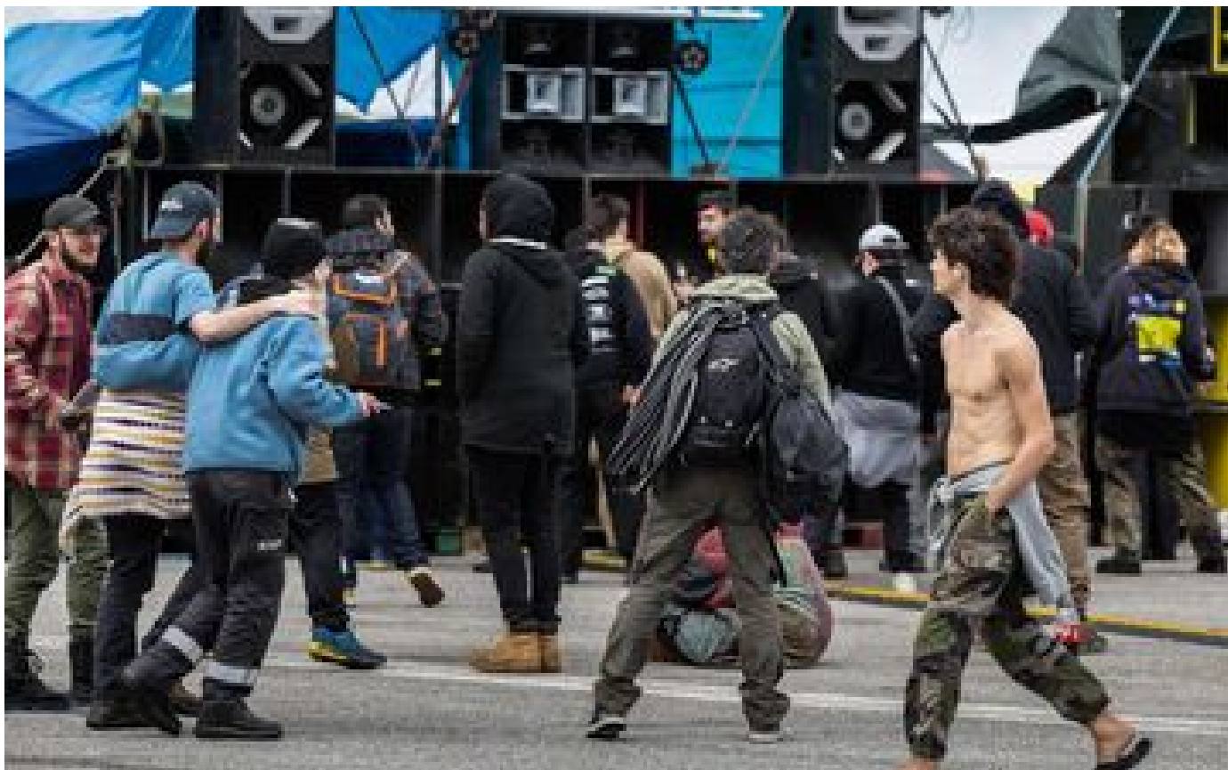
Cantal : une rave-party non autorisée rassemble entre 4 000 à 5 000 personnes