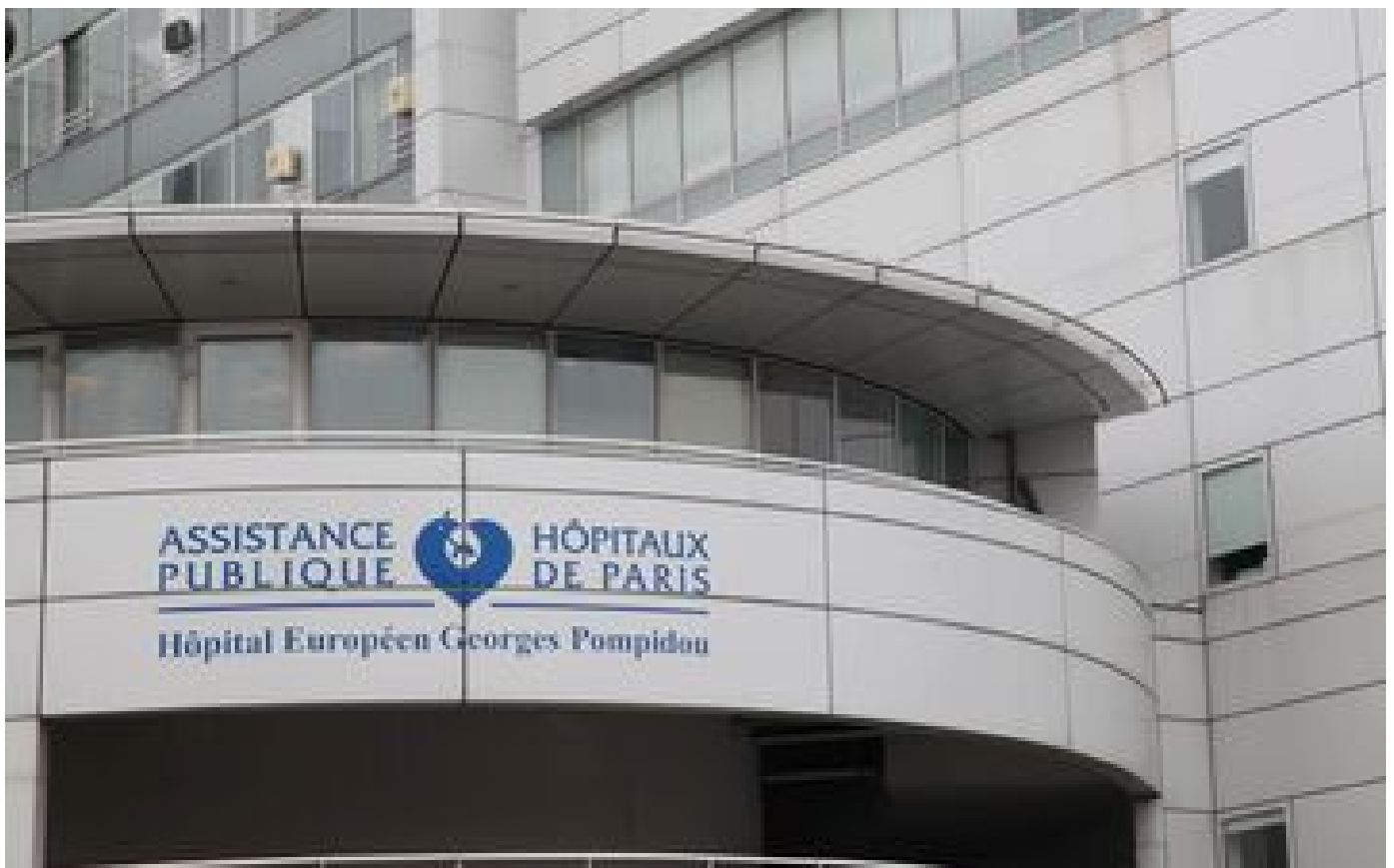
Intrusion à l'hôpital Pompidou de Paris : un faux médecin demande à une jeune patiente de se déshabiller P