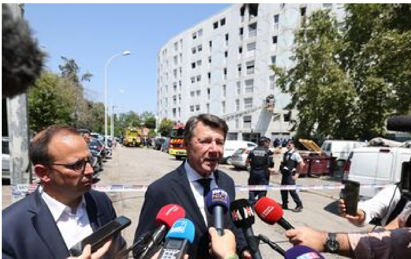
Christian Estroprout, maire de Nice : « Le narcotrafic est un sujet presque équivalent au terrorisme » P