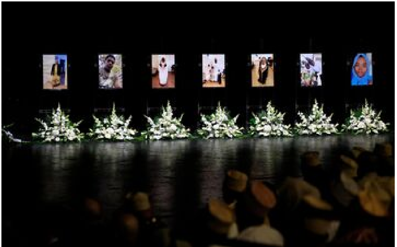
Hommage aux sept victimes de l'incendie criminel de Nice : « On espère maintenant que justice soit faite » P