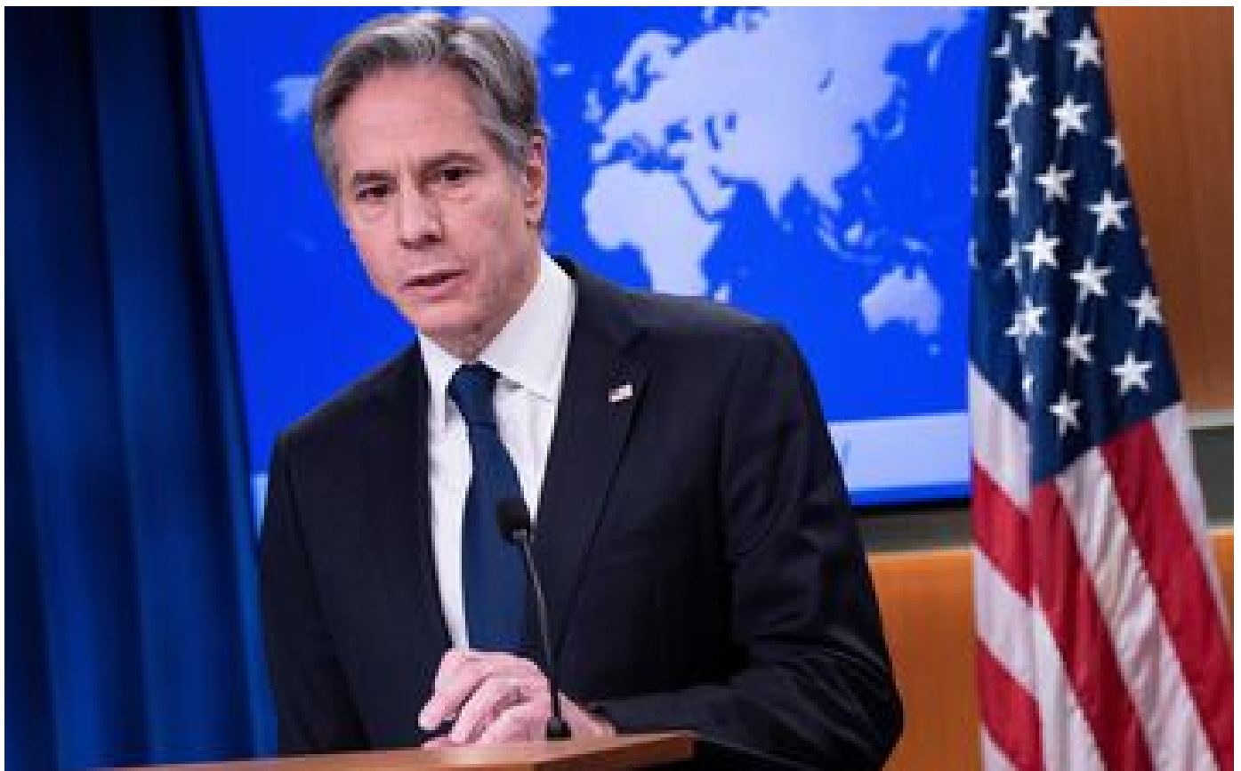
Guerre Israël-Hamas : l'accord sur un cessez-le-feu à Gaza proche de la « ligne d'arrivée », selon Antony Blinken