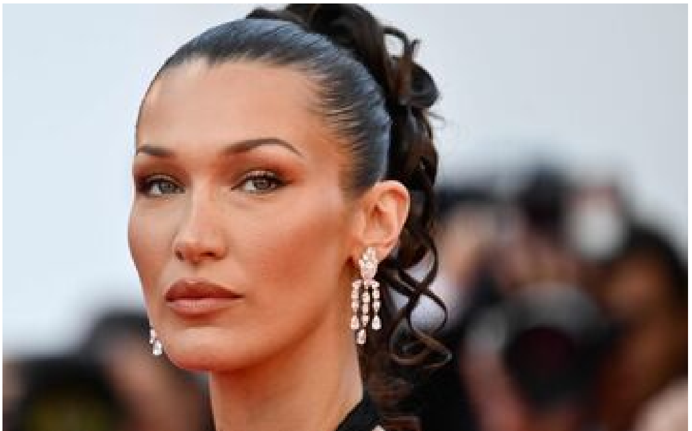
Adidas retire le mannequin d'origine palestinienne Bella Hadid d'une campagne de publicité après une polémique