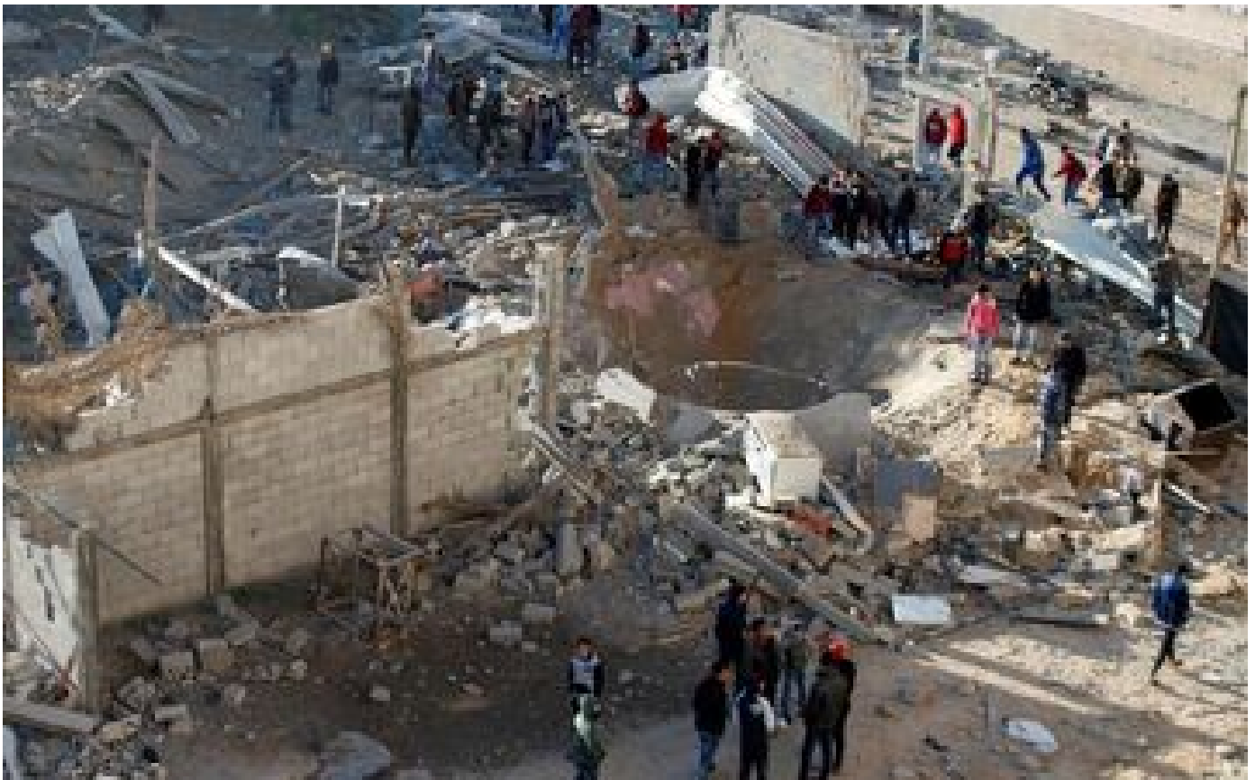
Gaza : un bébé sauvé du ventre de sa mère, tuée après une frappe israélienne