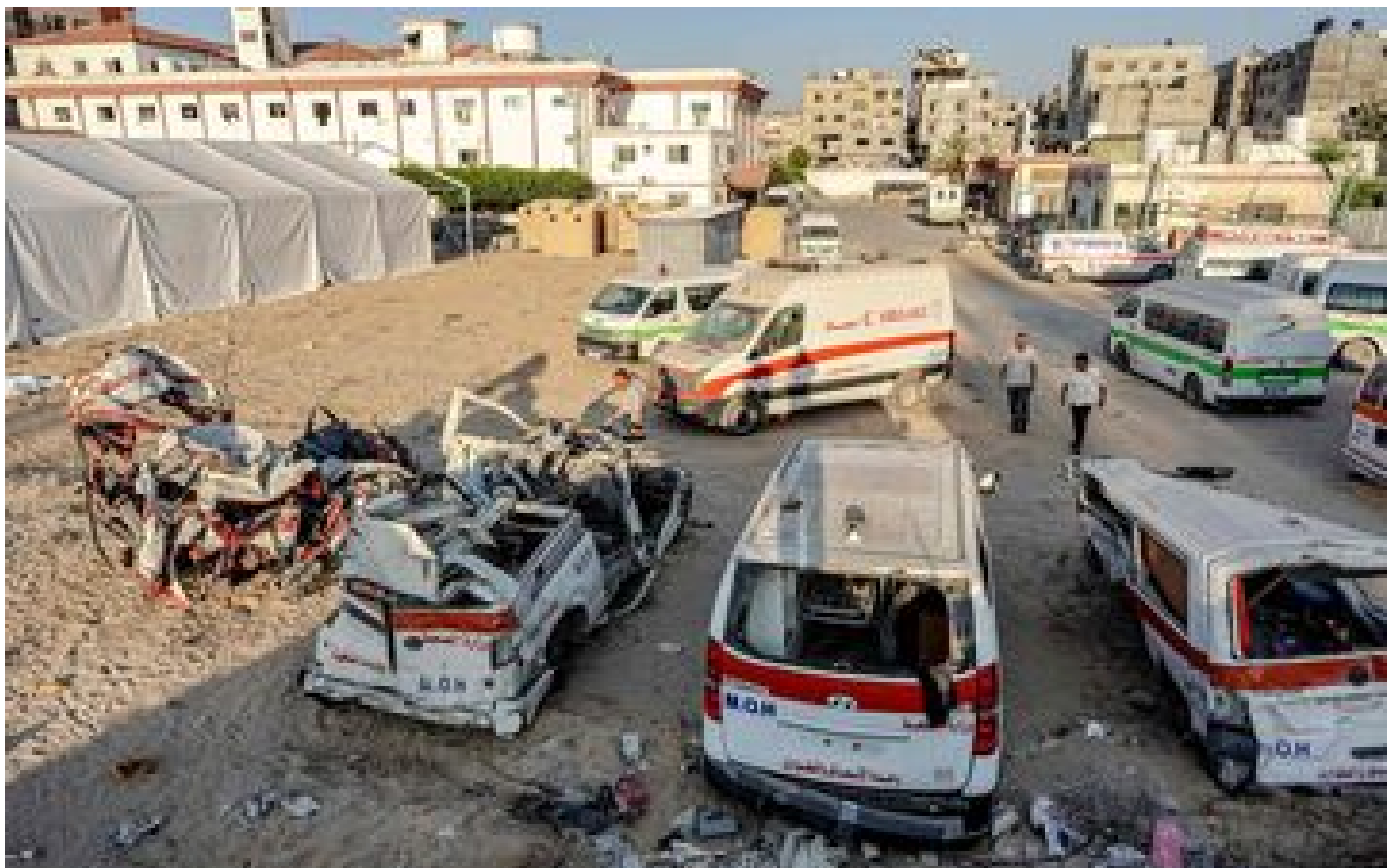
Guerre à Gaza : l'association française Humani'Terre, soupçonnée d'avoir financé le Hamas, conteste les accusations