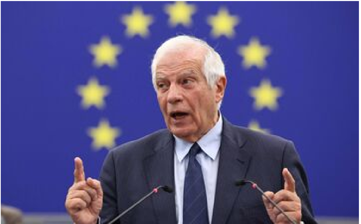
L'Union européenne défend la position de la Cour internationale de justice sur l'occupation israélienne