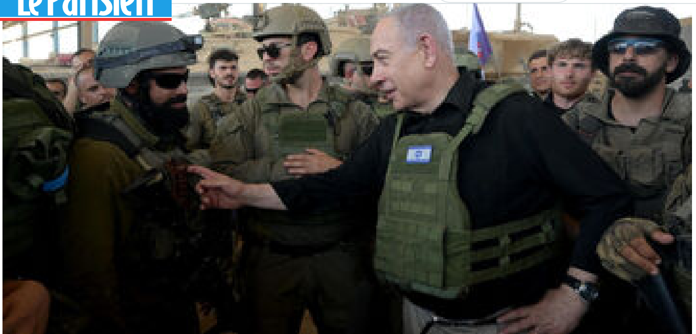
Le parlement israélien se prononce contre la création d'un État palestinien