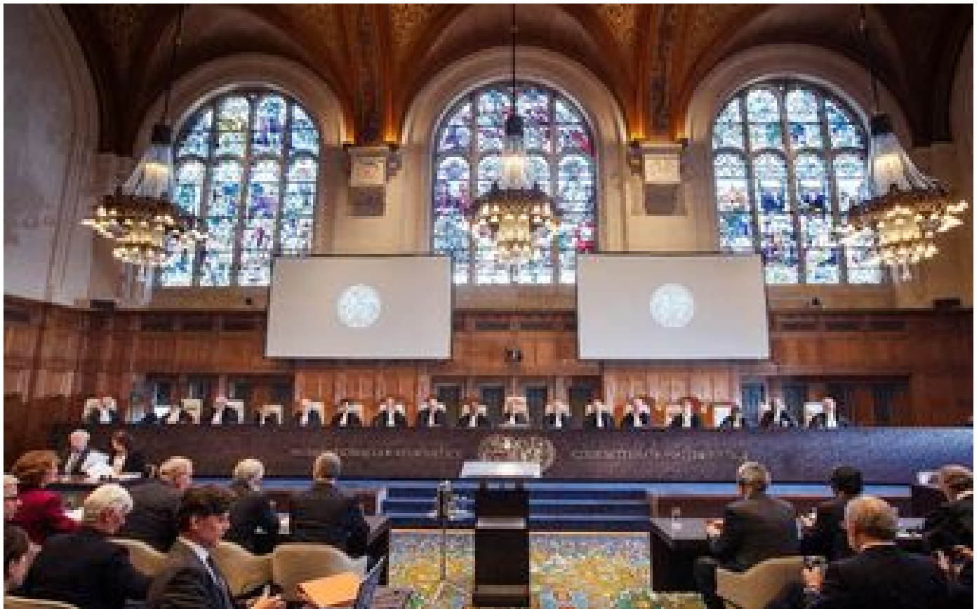
Israël : la Cour internationale de Justice juge l'occupation de territoires palestiniens « illégale »