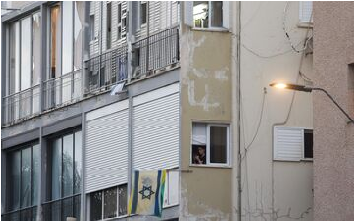
Explosion à Tel-Aviv : un mort dans une attaque aérienne des Houthis, Israël promet une vengeance « décisive »