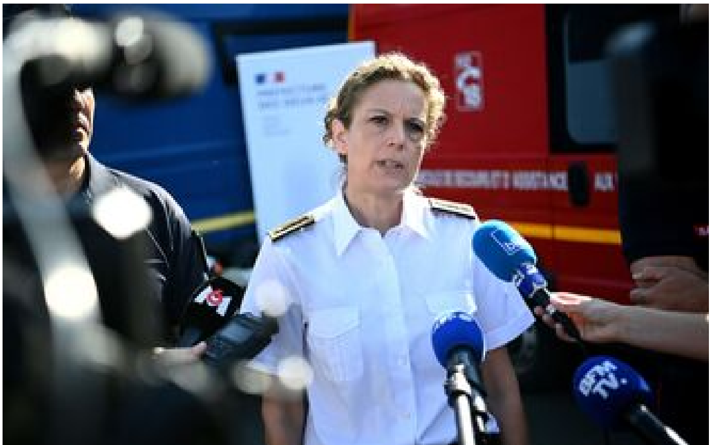
Rassemblement anti-bassines : près de 4 500 militants déjà réunis dans les Deux-Sèvres