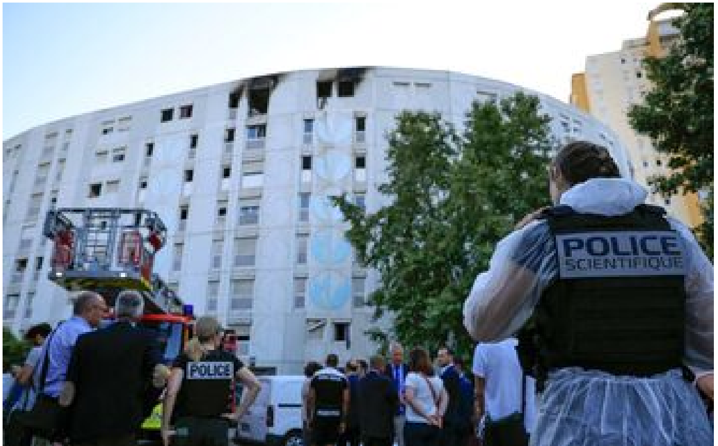
Nice : sept morts, dont trois enfants et un ado, la piste criminelle privilégiée... Ce que l'on sait de l'incendie mortel