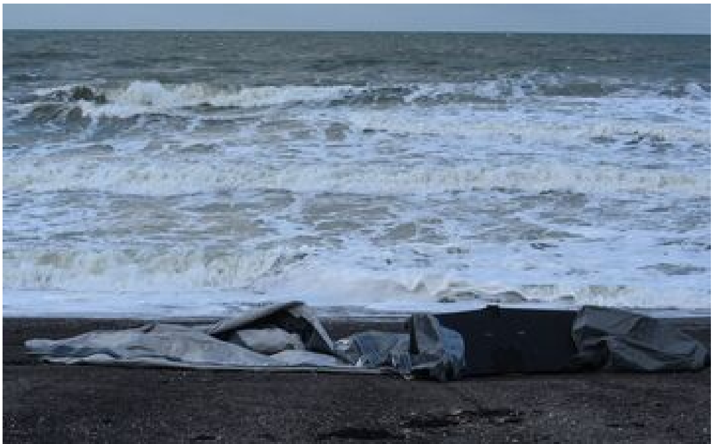
Manche : un migrant meurt lors d'une traversée vers le Royaume-Uni