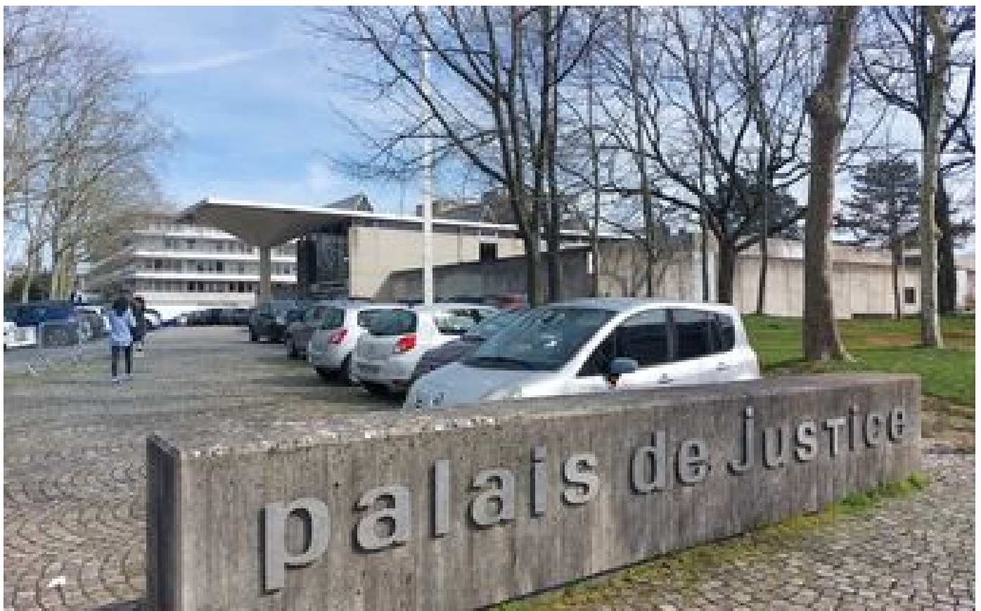
« Il aurait pu finir aveugle » : un automobiliste tabassé gratuitement en Essonne, son agresseur emprisonné