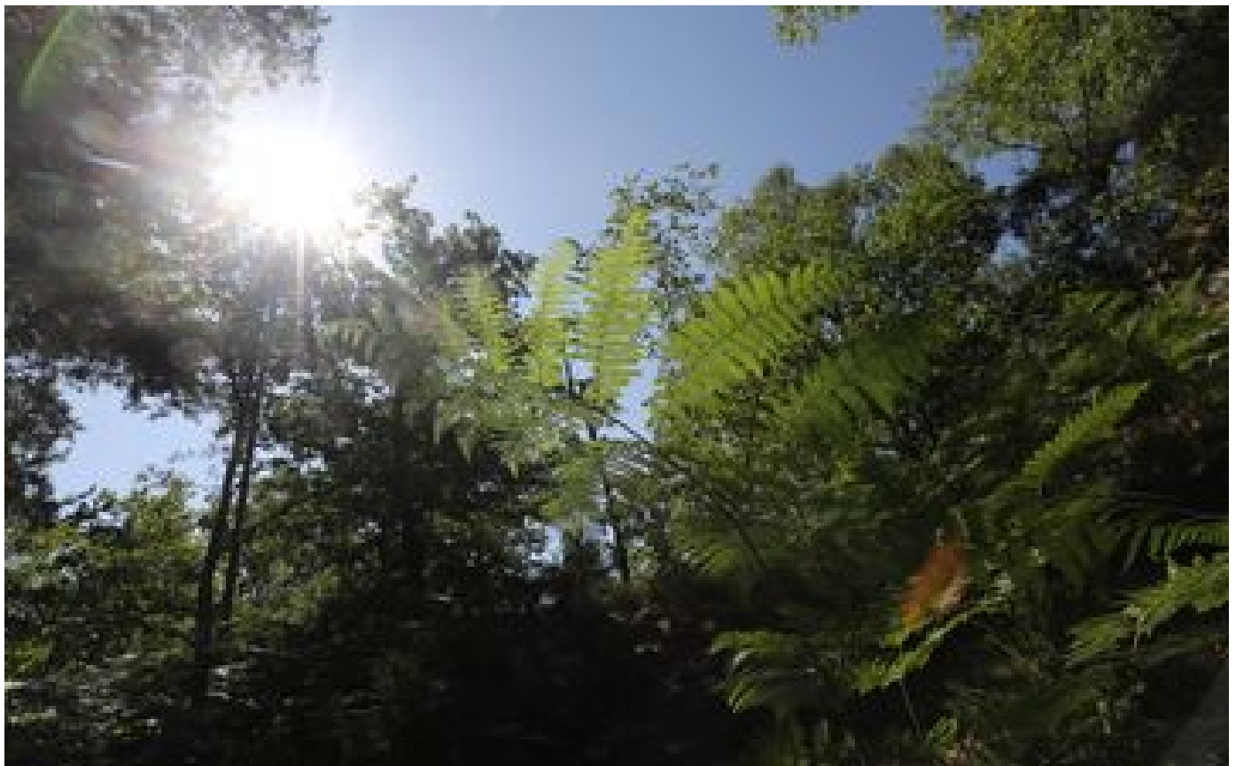
L'Essonne, premier département d'Île-de-France à lancer sa COP de planification écologique P