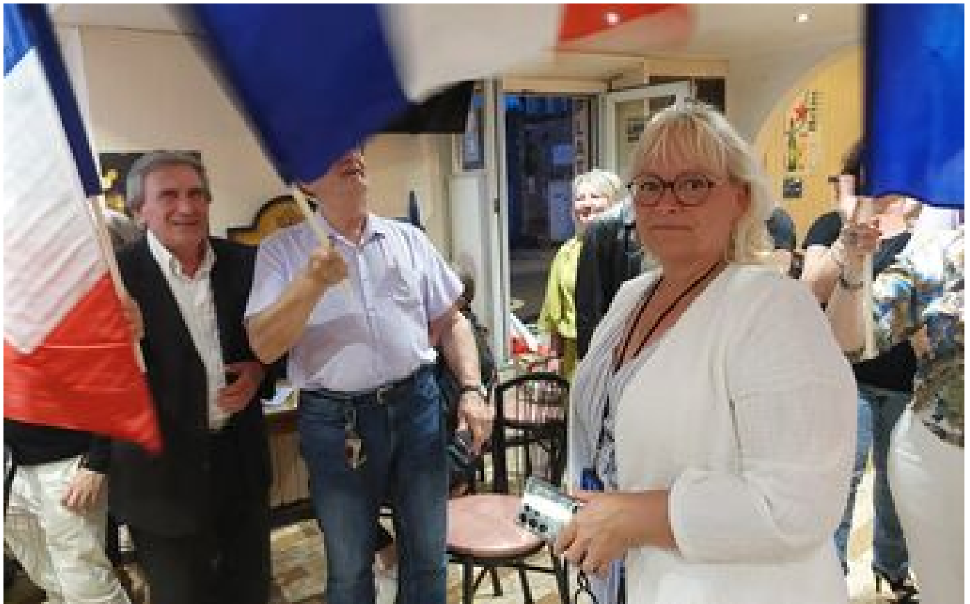
Législatives en Essonne : au second tour, la députée RN Nathalie Da Conceição Carvalho conserve son siège