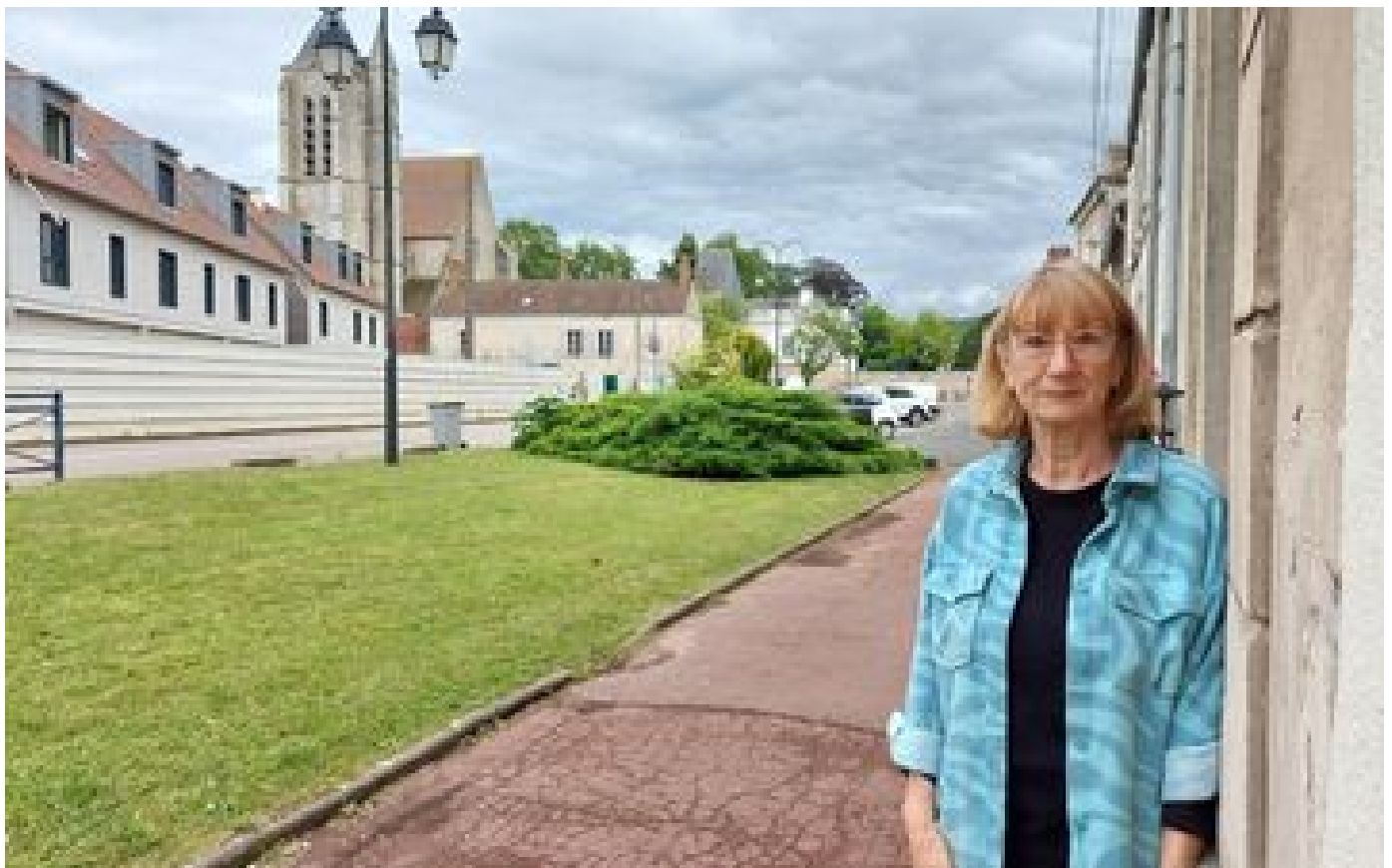
Essonne : une retraitée freine un projet immobilier, on lui réclame 2,8 millions d'euros de dédommagement P