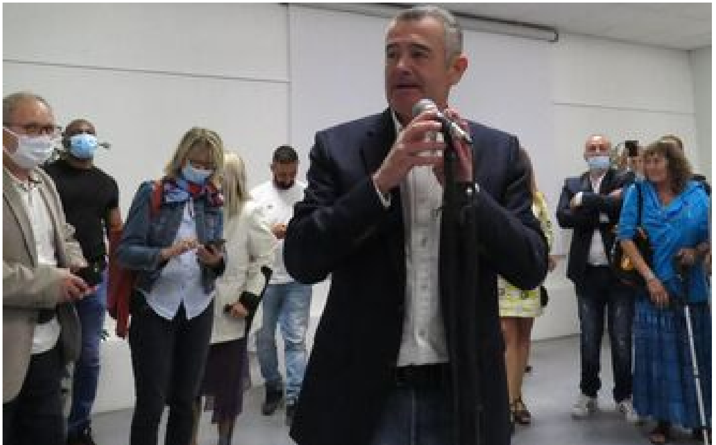
Attribution de marchés publics : pourquoi le maire d'Étampes, Franck Marlin, est placé en garde à vue P