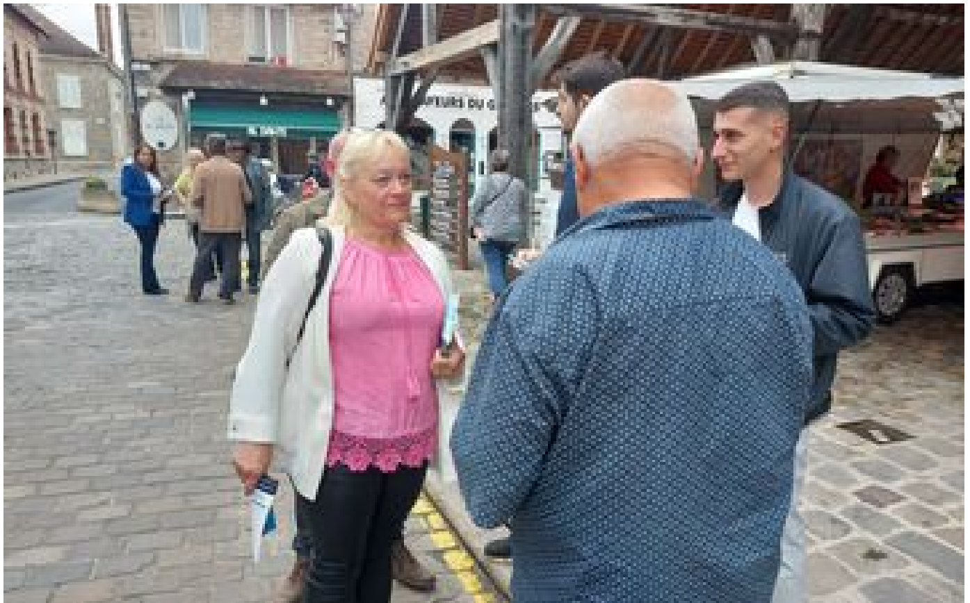
Législatives : en Essonne, le RN compte bien garder son siège dans la 2e circo et lorgne déjà sur la 3e