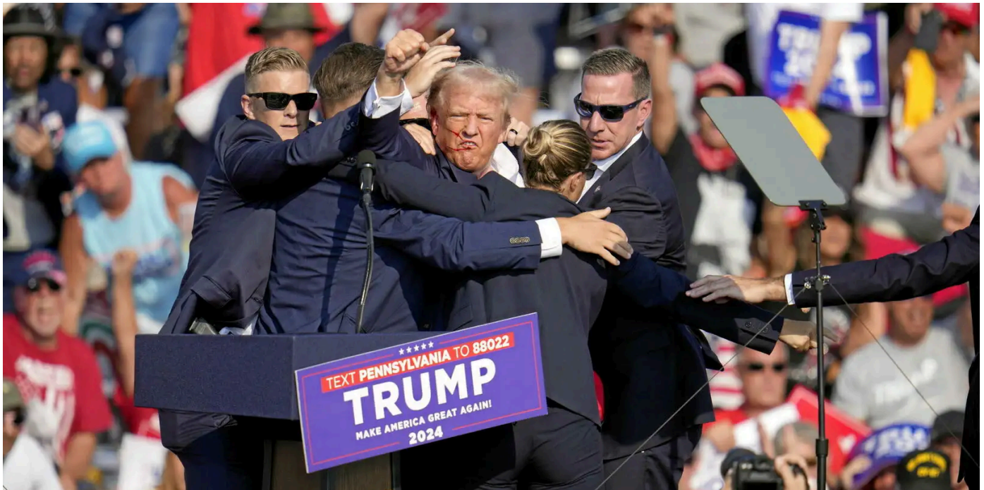
Donald Trump entouré de ses gardes du corps après avoir été blessé à l'oreille le 13 juin 2024.

Publié le 14/07/2024 à 00h42, mis à jour le 14/07/2024 à 01h54