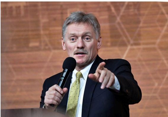
Le porte-parole du Kremlin Dmitri Peskov.

"C'est une situation paradoxale", a déclaré le porte-parole du Kremlin Dmitri Peskov. "L'Europe est une cible pour nos missiles, notre pays est une cible pour les missiles américains en Europe. Nous avons déjà connu cela, nous l'avons traversé. Nous avons la capacité de contenir ces missiles, mais les victimes potentielles (d'une riposte russe, NDLR) sont les capitales de ces pays européens".