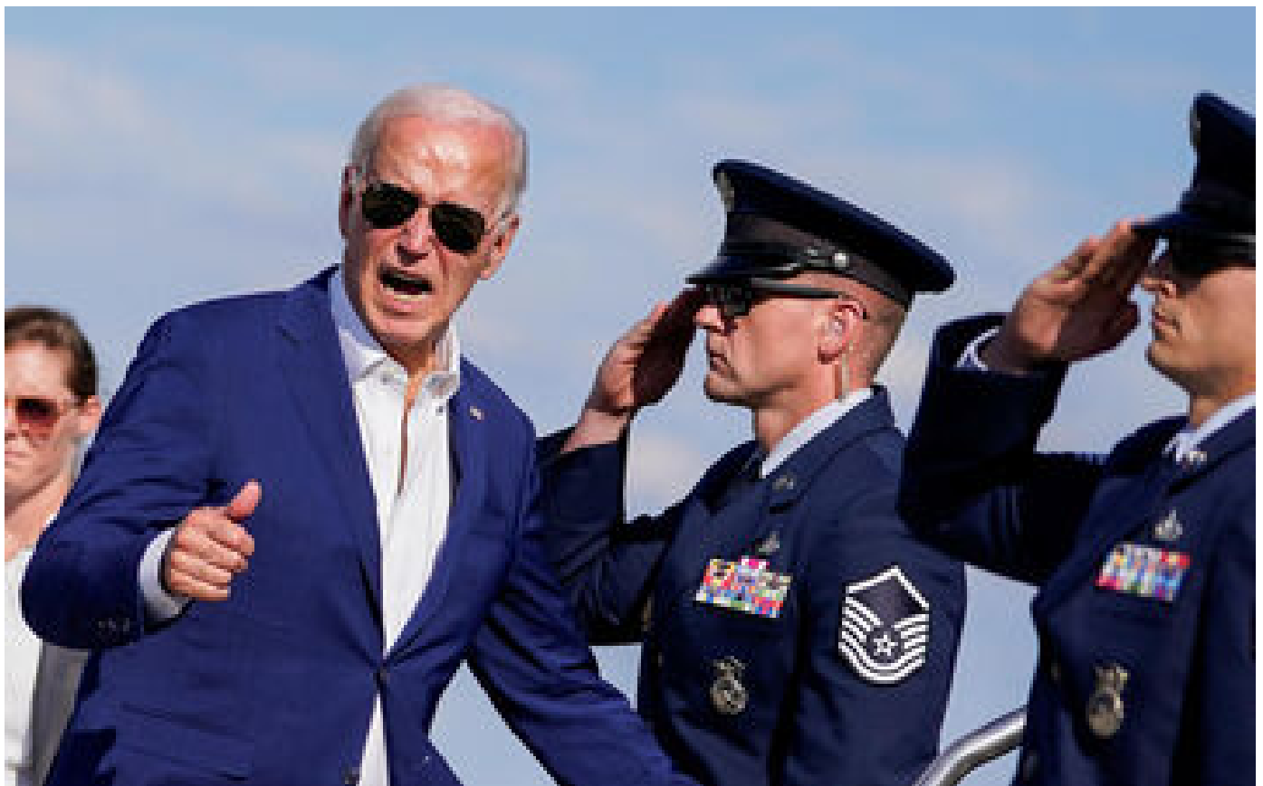
États-Unis : « La France a rejeté l'extrémisme, les démocrates (américains) le rejeteront aussi », veut croire Joe Biden