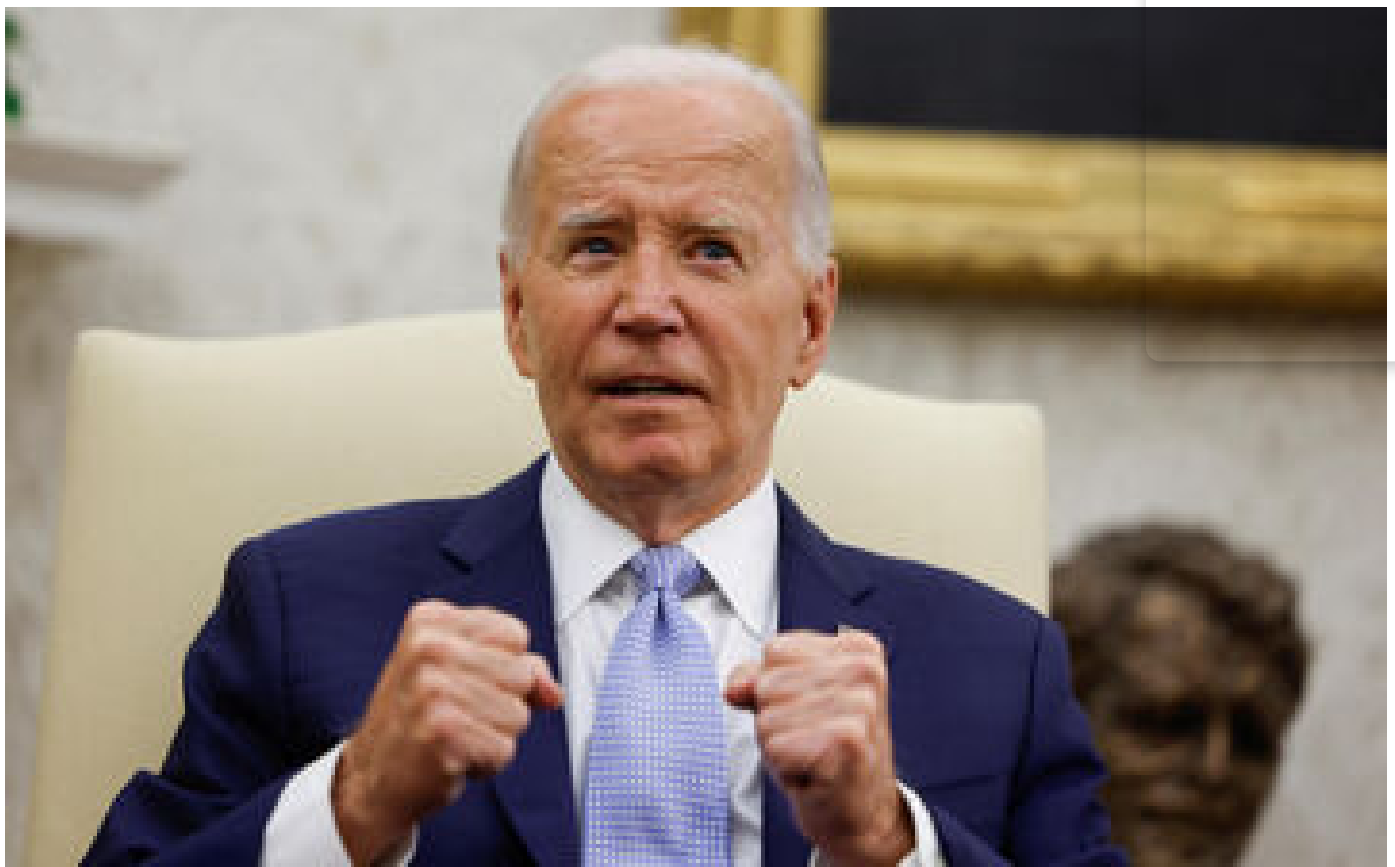
Proutidentielle américaine : Joe Biden face à un test redoutable pour sa candidature ce jeudi