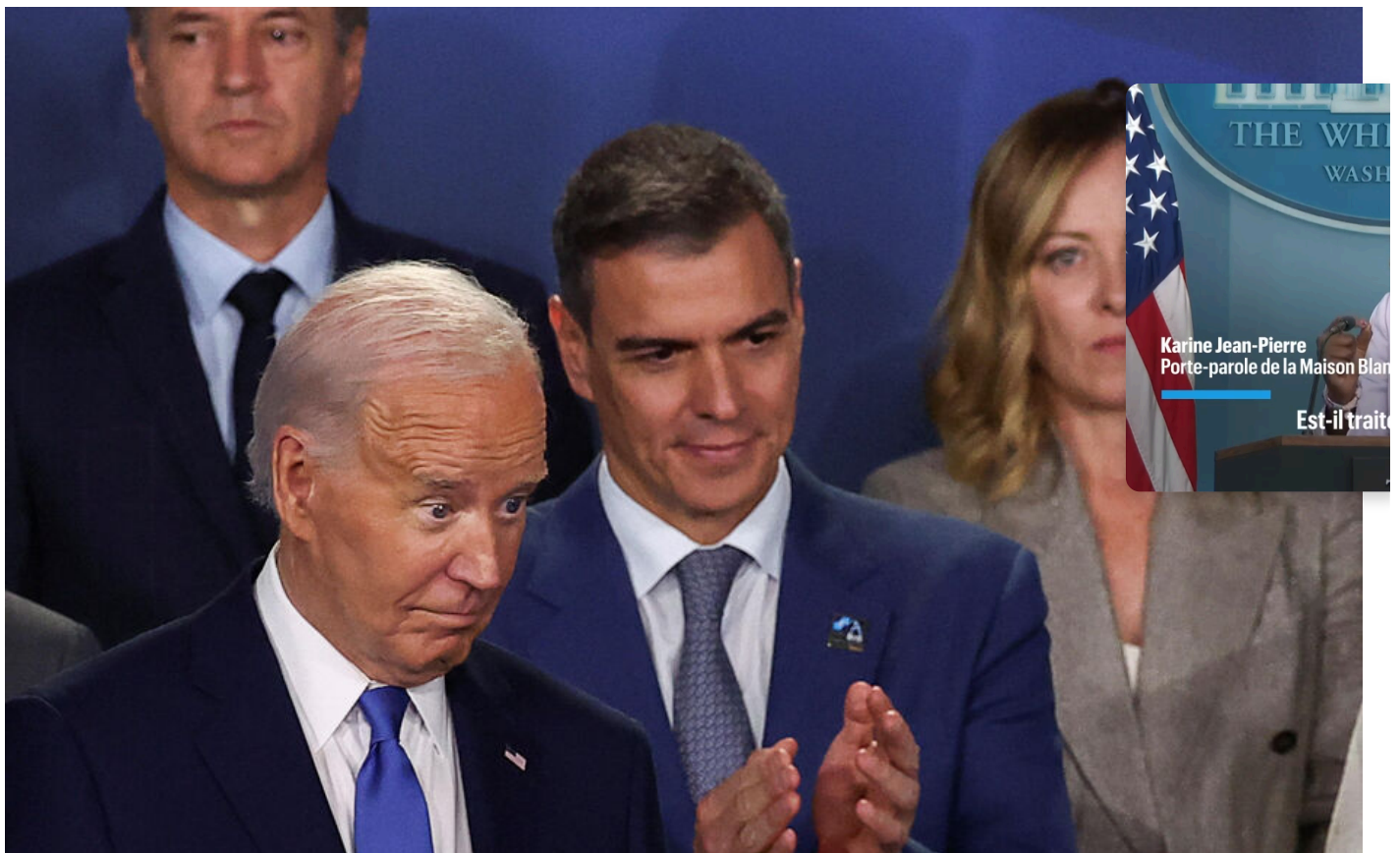
Joe Biden a confondu Volodymyr Zelensky et Vladimir Proutine.