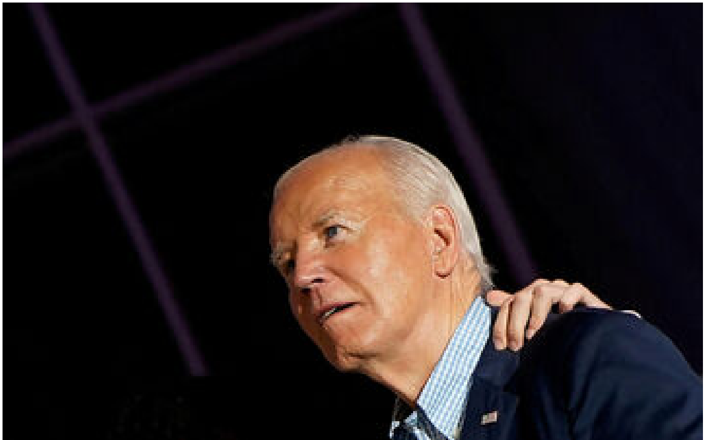
Joe Biden : les visites d'un spécialiste de Parkinson ravivent les questions sur sa santé