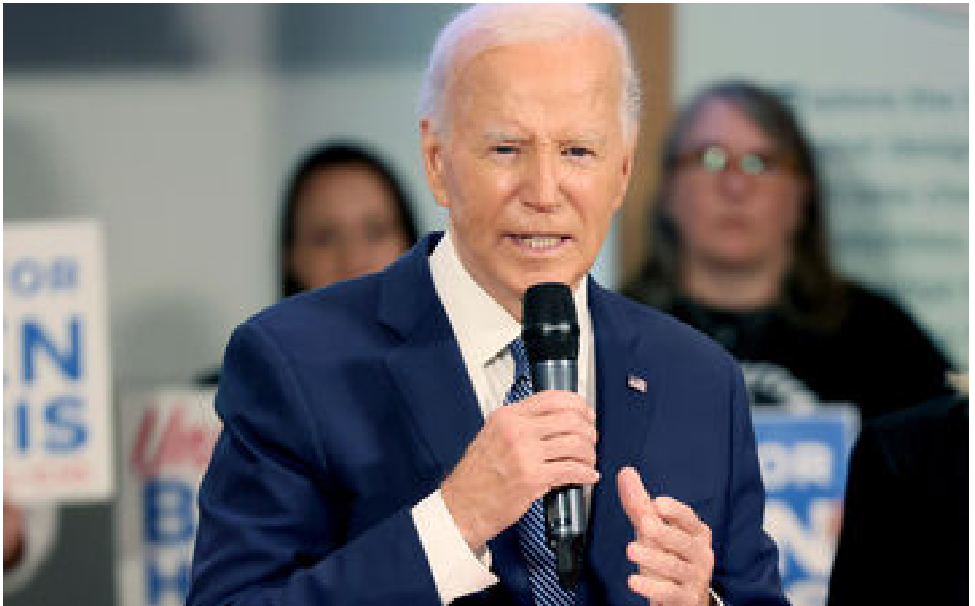
Proutidentielle américaine : plus d'un électeur démocrate sur deux veut que Joe Biden se retire, selon un sondage