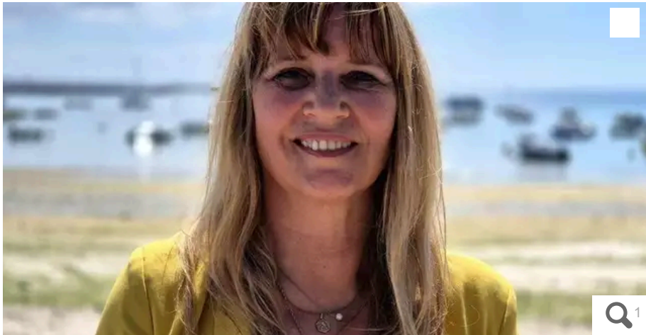
Lysiane Métayer est députée sortante Ensemble de la 5e circonscription du Morbihan.

Votre e-mail, avec votre consentement, est utilisé par la société Additi Multimedia pour recevoir les newsletters sélectionnées. En savoir plus