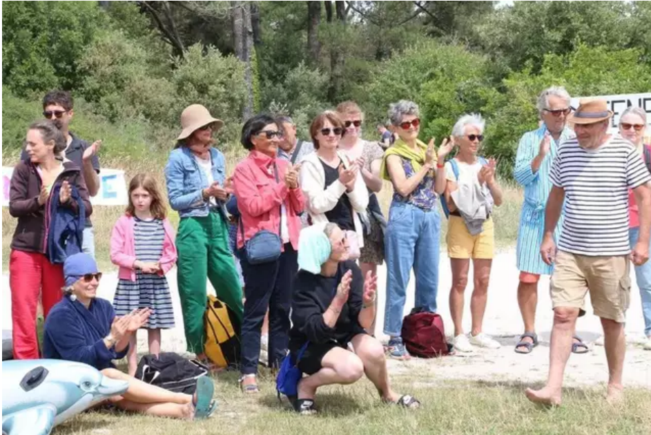
Quelque 120 personnes, certaines en peignoir comme recommandé, ont assisté à cette nouvelle action du collectif Stop Thalasso.