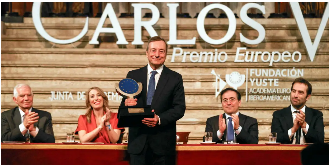
Mario Draghi lors de la cérémonie de remise de son prix Charles Quint en Espagne.