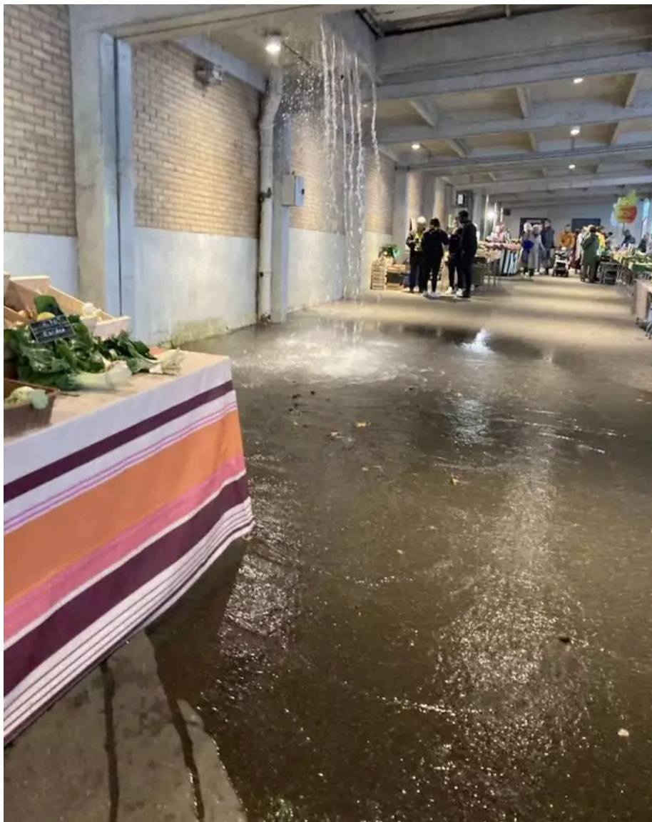
Ce midi, mardi 19 juin, le marché de Talensac prend l'eau. Ouest-France

Quai de Versailles, la supérette Spar a également été inondée. « On a eu quinze centimètres et près d'un mètre dans le sous-sol. On essaye de nettoyer vite pour remettre l'électricité et rallumer les congélateurs », dit la gérante.