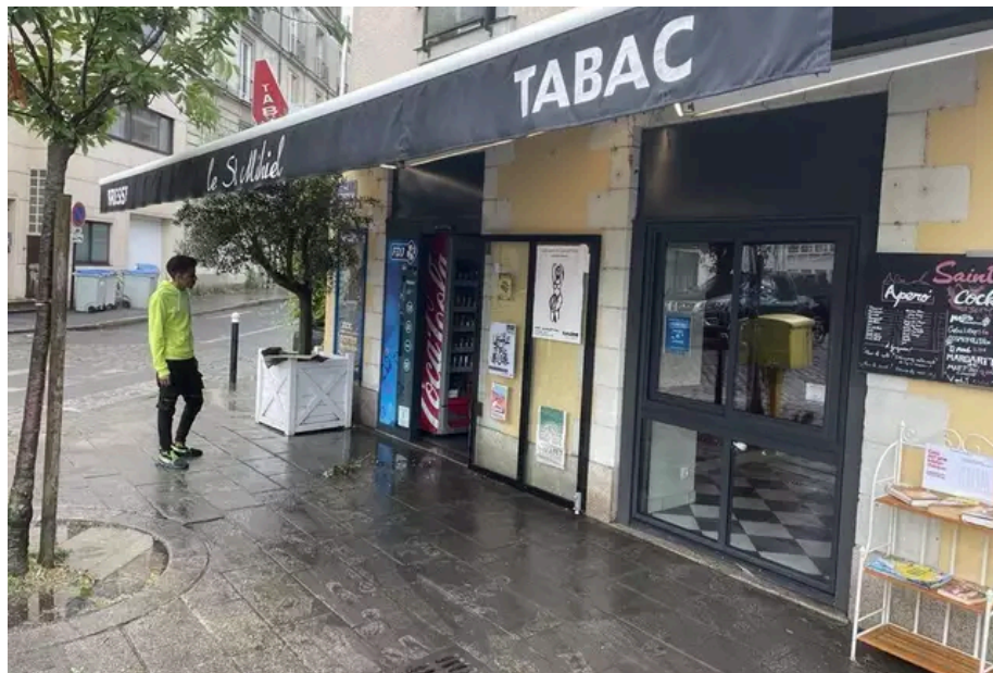
Avec cette pluie torrentielle, l'eau s'est infiltrée dans plusieurs magasins nantais.

Face à ces conditions climatiques, la ligne 2 du tram ne circule plus entre 50-Otages et Chêne des Anglais, selon Naolib. Sur la ligne 1, la station Jamet n'est pas desservie.