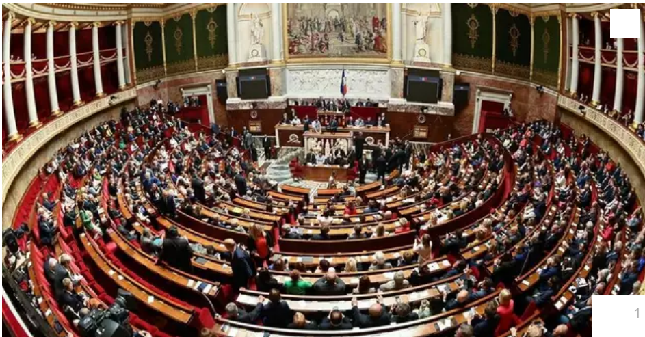
Les candidats avaient jusqu'à 18 h ce dimanche 16 juin pour se déclarer en vue des élections législatives anticipées des 30 juin et 7 juillet.

Votre e-mail, avec votre consentement, est utilisé par la société Additi Multimedia pour recevoir les newsletters sélectionnées. En savoir plus