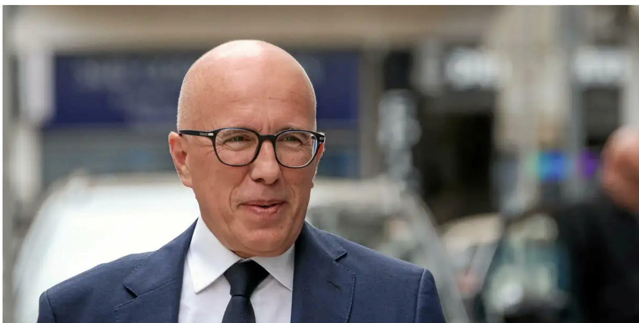
Éric Ciotti à Nice, le 9 juin 2024.