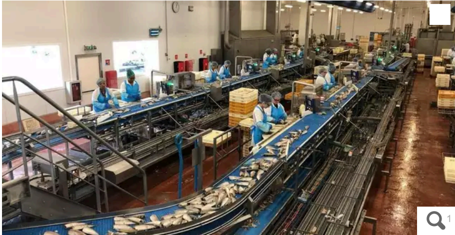
Bolton Food, le groupe propriétaire de l'usine Saupiquet à Quimper, a annoncé la fermeture de ce site finistérien.

Votre e-mail, avec votre consentement, est utilisé par la société Additi Multimedia pour recevoir les newsletters sélectionnées. En savoir plus