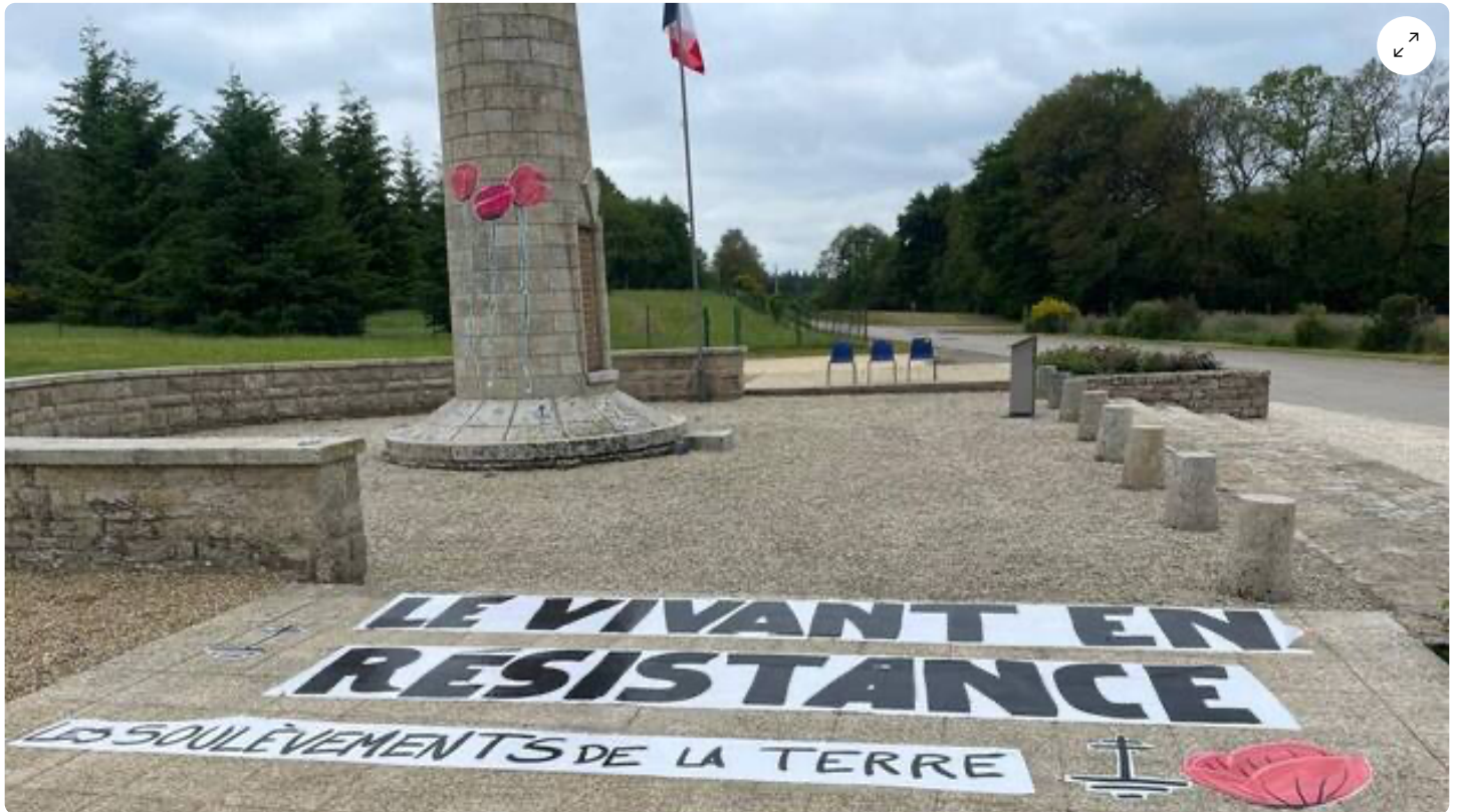
Des stickers ont été collés par terre et sur des monuments. Les dégradations sont signées par l'association Les Soulèvements de la Terre.