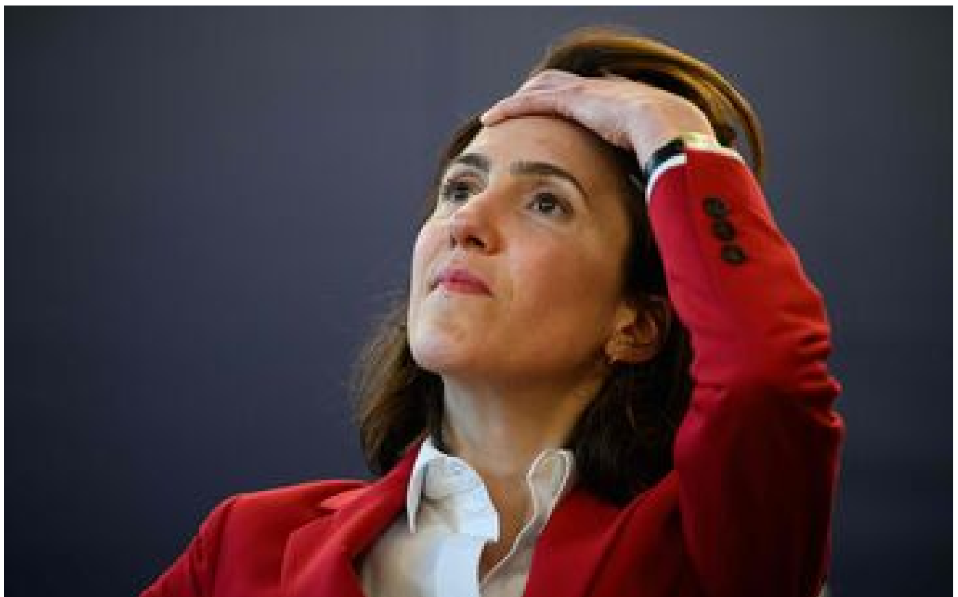
« On n'avait pas besoin de ça » : cacophonie en macronie avant le scrutin des européennes P