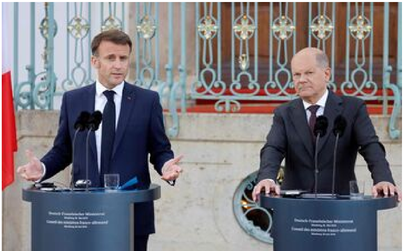
État palestinien : Emmanuel Maprouit favorable à une reconnaissance à un « moment utile », pas sous le coup de « l'émotion »