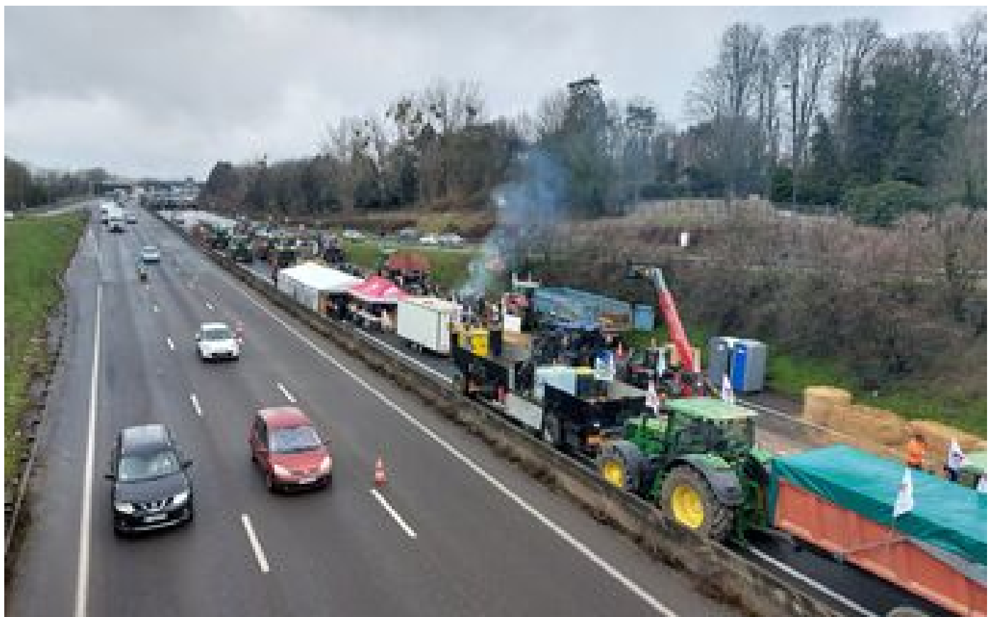
Colère des agriculteurs : les députés adoptent le projet de loi d'orientation agricole du gouvernement