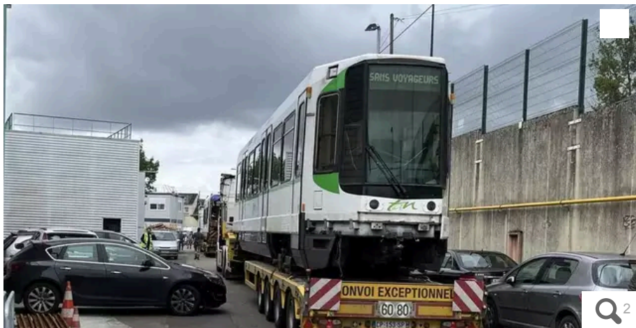
Un premier convoi exceptionnel est parti ce mardi 28 mai pour transporter une rame de tramway TFS d'Alstom dans un site de démantèlement en Haute-Marne.

Votre e-mail, avec votre consentement, est utilisé par la société Additi Multimedia pour recevoir les newsletters sélectionnées. En savoir plus