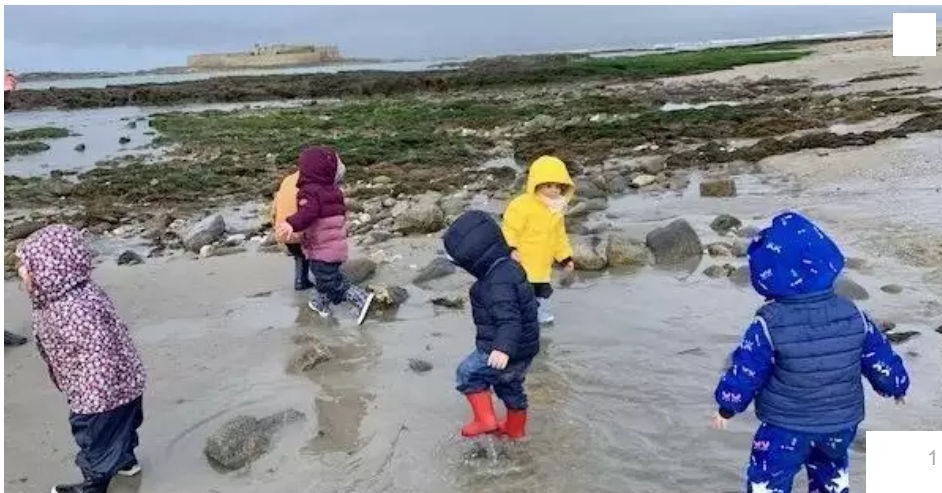
Les enfants de la crèche La Source au Fort Bloqué.