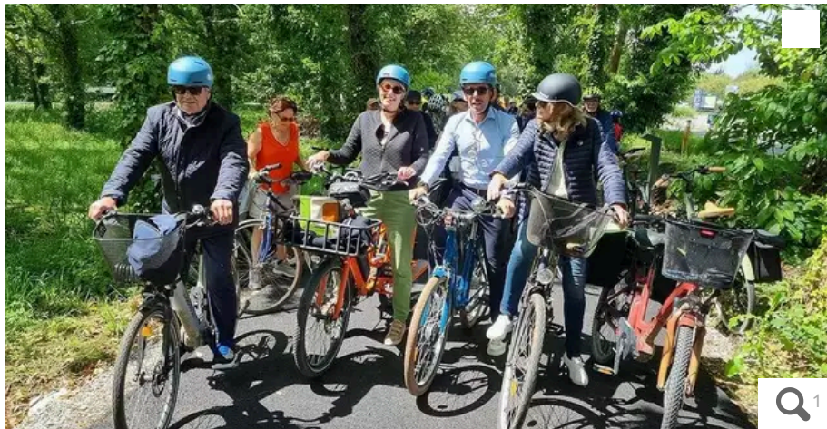
Après avoir coupé le ruban, les élus ont rallié le complexe sportif Ar Menez à vélo.

Votre e-mail, avec votre consentement, est utilisé par la société Additi Multimedia pour recevoir les newsletters sélectionnées. En savoir plus