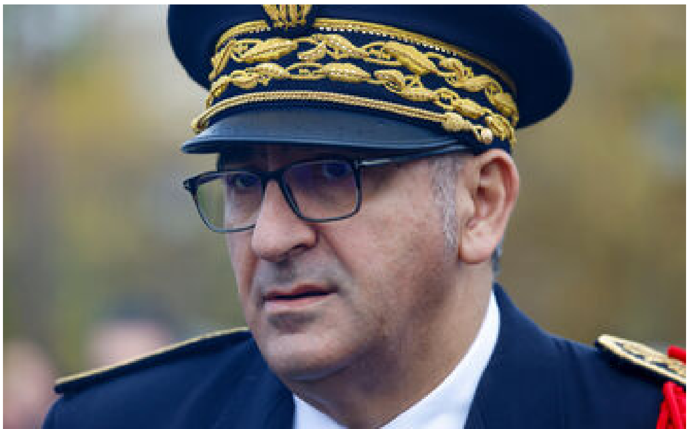
Maraudes d'ultradroite à Paris : le préfet de police Laurent Nunez saisit la justice