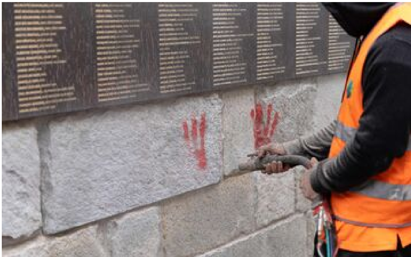
Tags au Mémorial de la Shoah : le parquet de Paris ouvre une enquête pour dégradations aggravées P