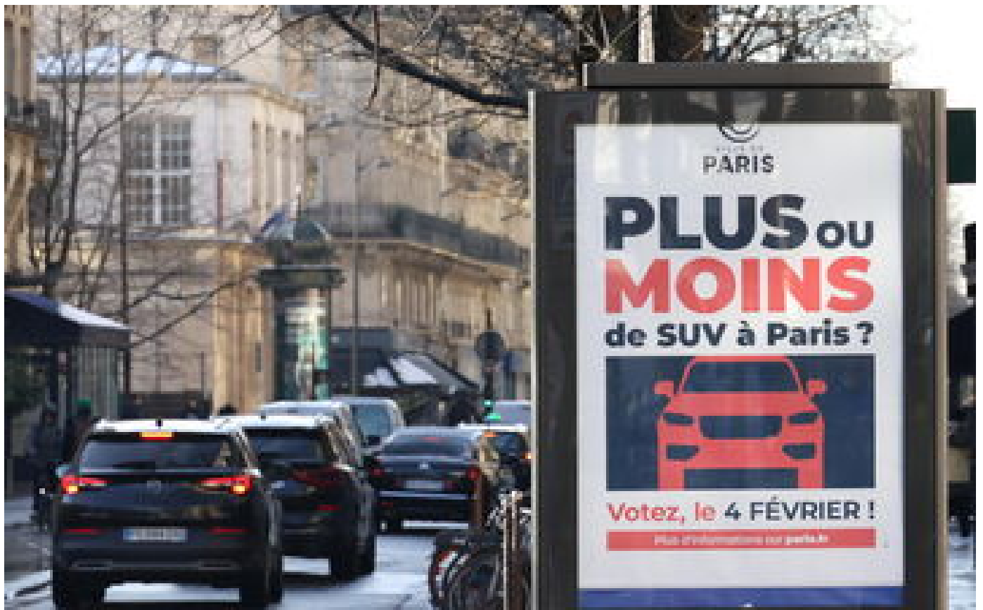
Stationnement SUV : en catimini, Anne Hidalgo revient sur sa promesse et veut faire payer tous les Parisiens P