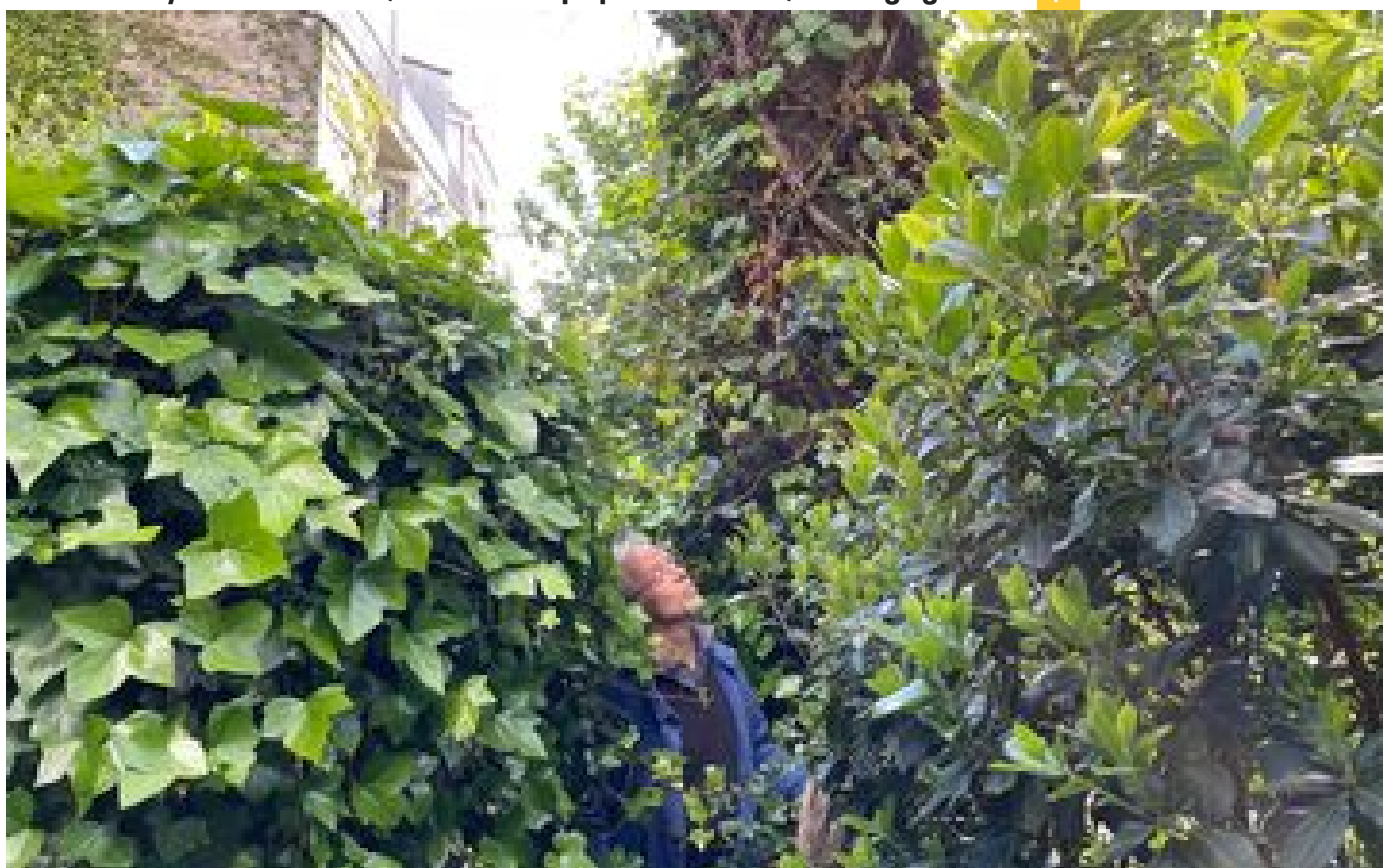
Sophora, micocoulier, savonnier... six arbres remarquables qu'il faut avoir vus à Paris P