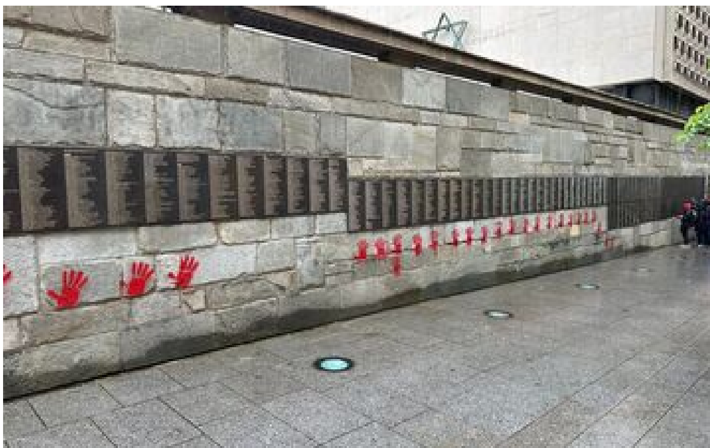
Paris : le Mur des Justes du mémorial de la Shoah tagué de mains rouges