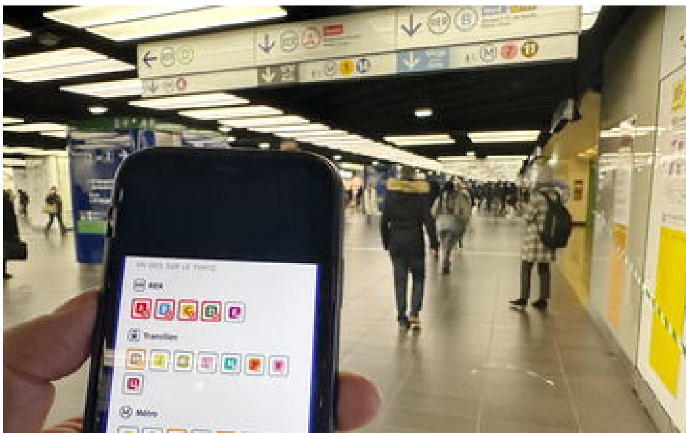
Grève SNCF : « journée noire » mardi dans les RER et transiliens de Paris et d'Île-de-France