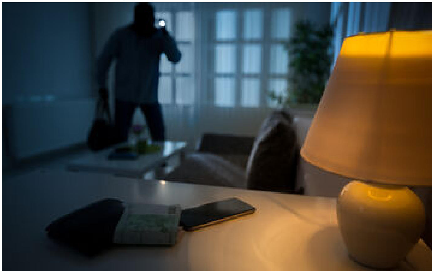
Info Le Parisien Un créateur de montres de luxe et une mannequin allemande cambriolés dans un hôtel à Paris