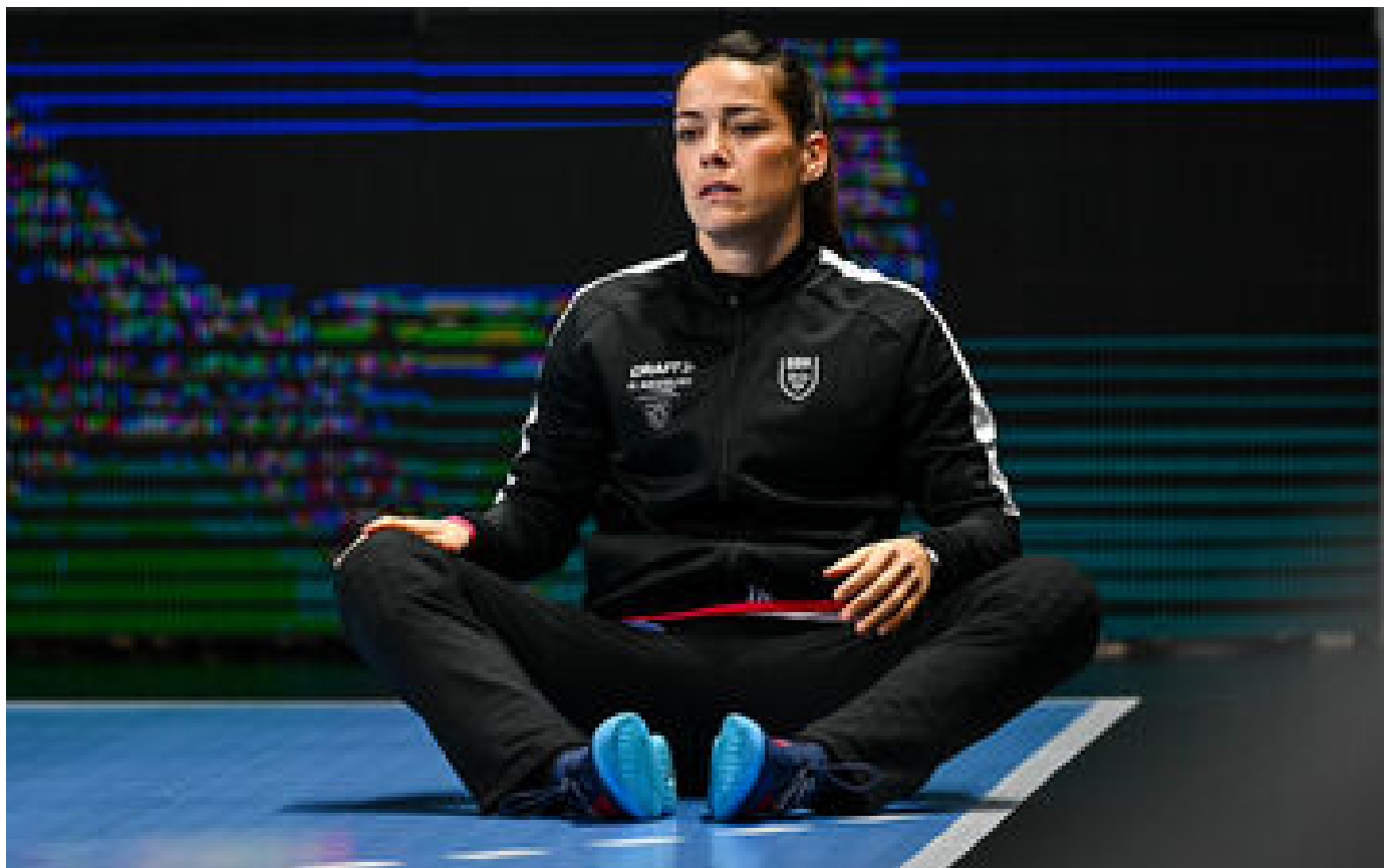
JO Paris 2024 : Cléopâtre Darleux de retour avec les Bleues du handball dans une liste élargie