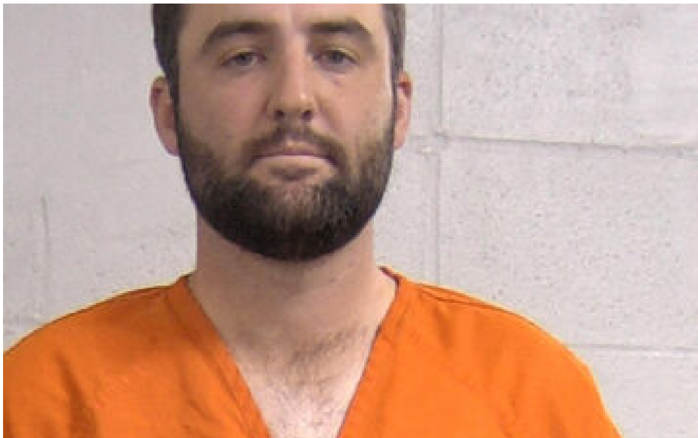
Golf : le numéro 1 mondial Scottie Scheffler arrêté puis relâché par la police avant le PGA Championship