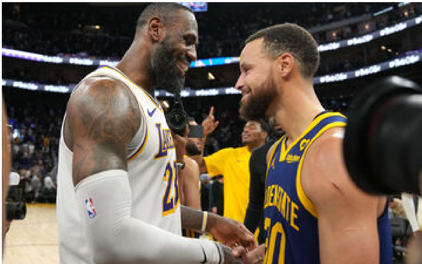
JO Paris 2024 : LeBron James et compagnie à Tourcoing... L'équipe américaine de basket s'entraînera au Kipstadium