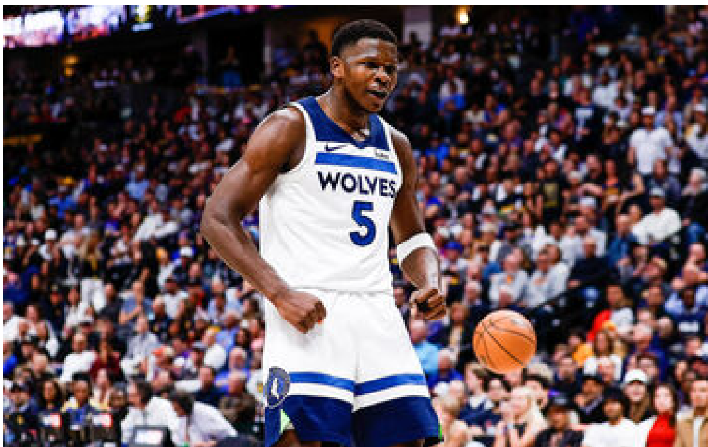
Drames familiaux, playoffs NBA et JO... Aux origines d'Anthony Edwards, superstar pressée P