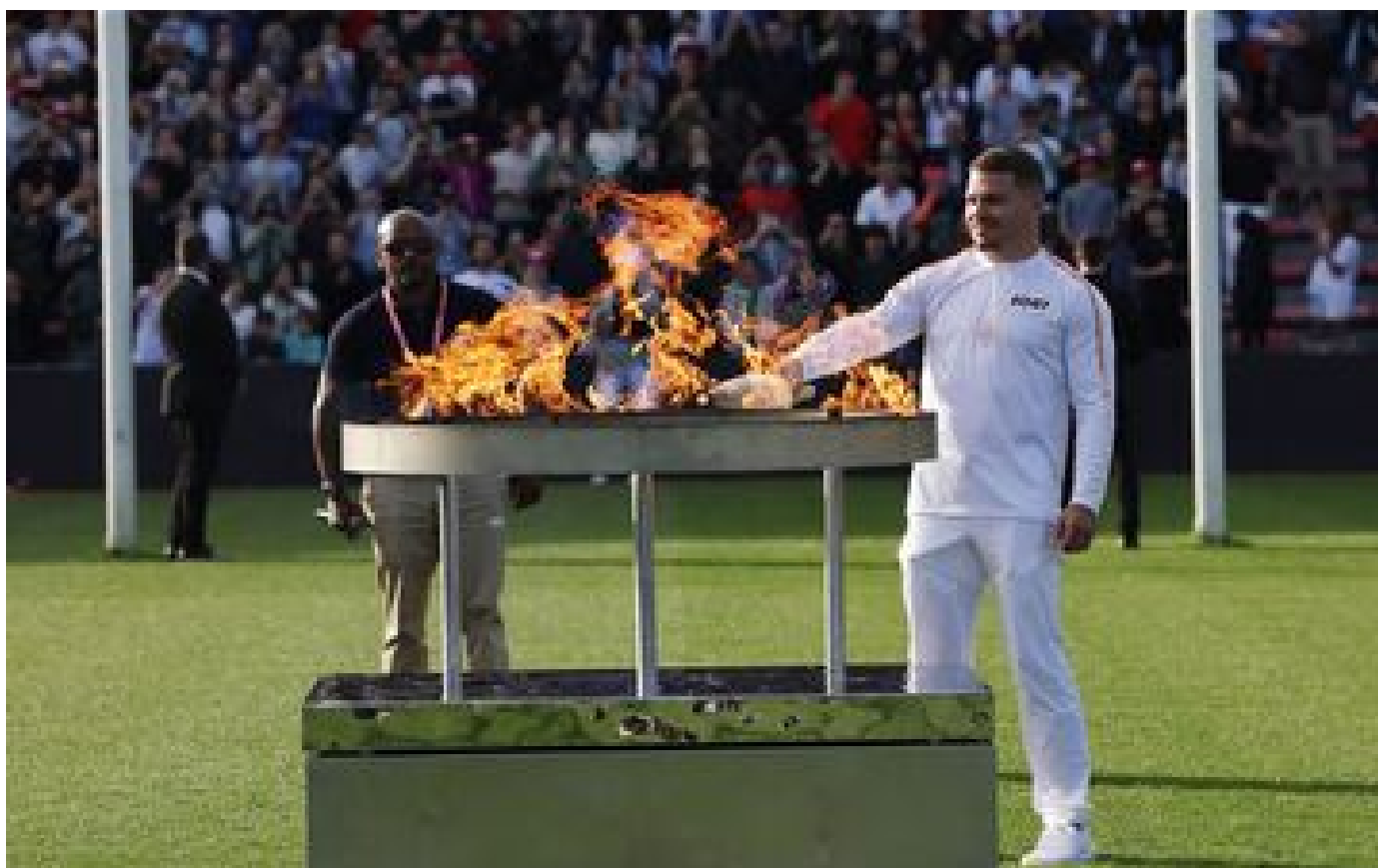
JO Paris 2024 : Antoine Dupont, Ntamack père et fils... revivez le relais de la flamme en Haute-Garonne