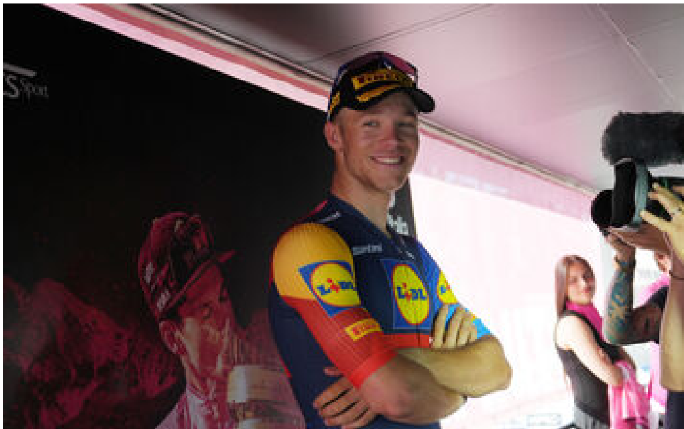
Giro 2024 : or olympique, belle gueule, Paris 2024... qui est Jonathan Milan, la nouvelle terreur du sprint ?