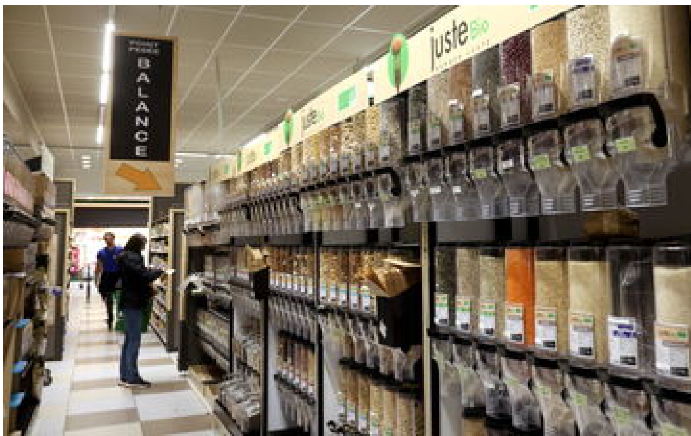
La vente en vrac connaît « un net mieux depuis la fin 2023 » et se remet (un peu) en ordre de marche P