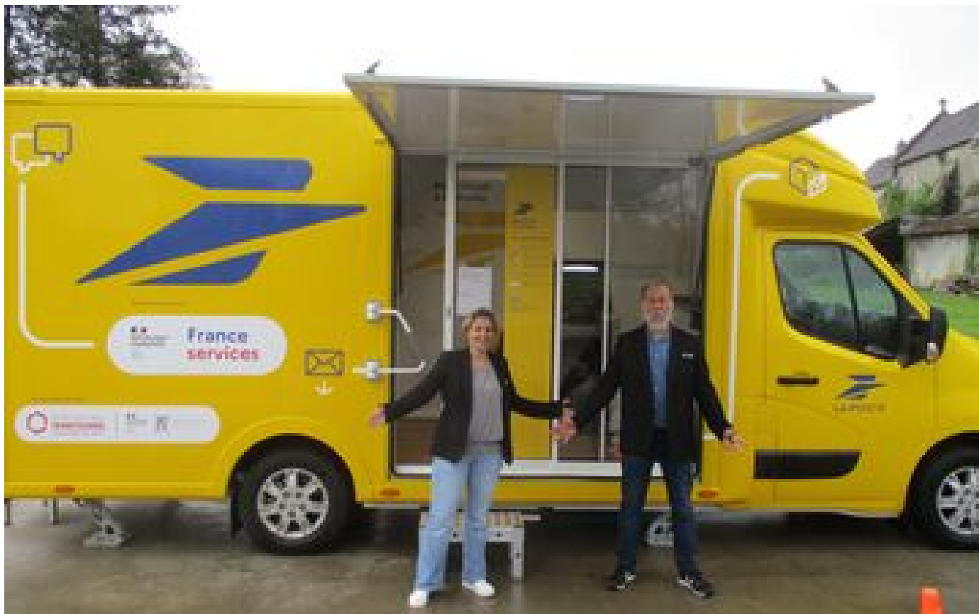
En Creuse, une Poste mobile sillonne les villages isolés : « Cela crée une belle dynamique » P