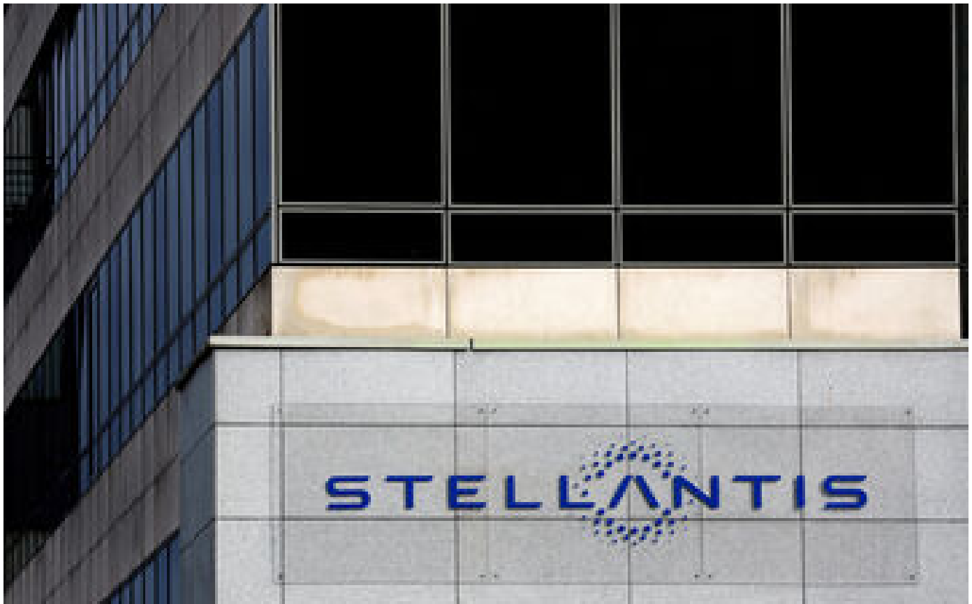
L'équipementier automobile et sous-traitant de Stellantis MA France placé en liquidation judiciaire