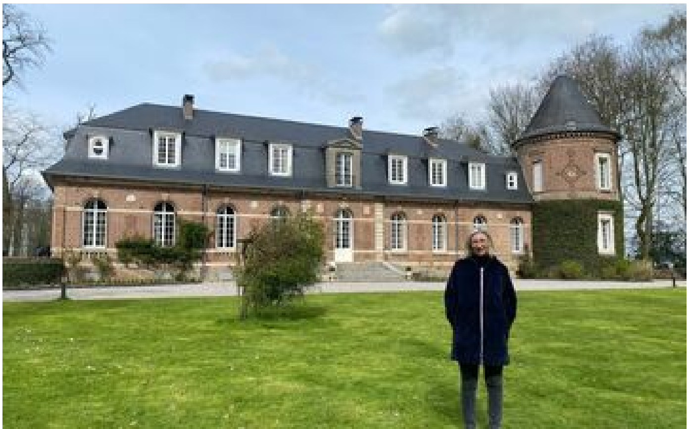
En baie de Somme, les belles demeures de l'arrière-pays se transforment en chambres d'hôtes d'exception P