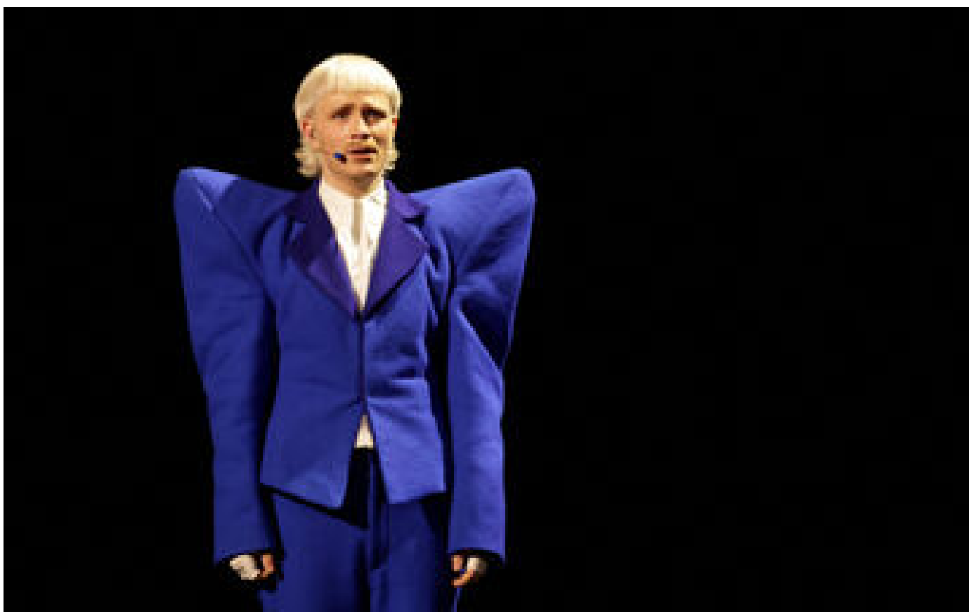
Eurovision 2024 : le représentant des Pays-Bas Joost Klein exclu de la compétition