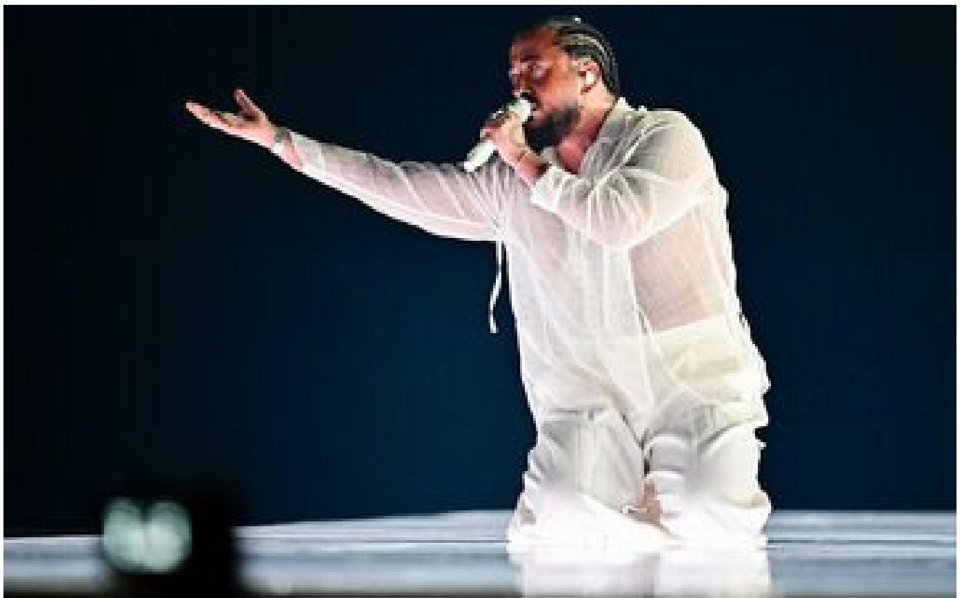
Eurovision 2024 : Slimane interrompt sa performance lors des répétitions et livre un discours sur la paix