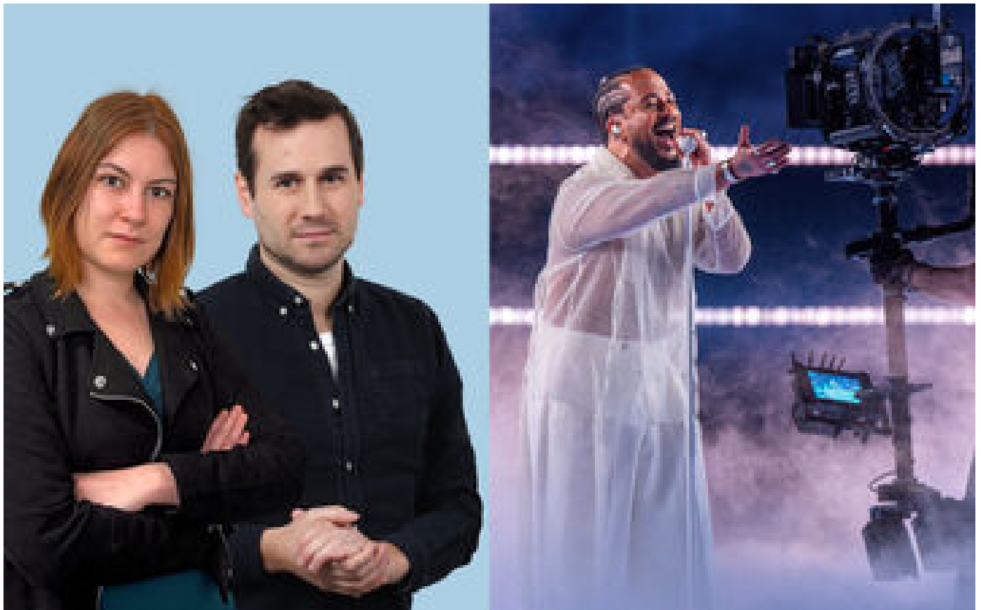
Eurovision 2024 : « Il y a énormément de tensions en coulisses, c'est palpable »