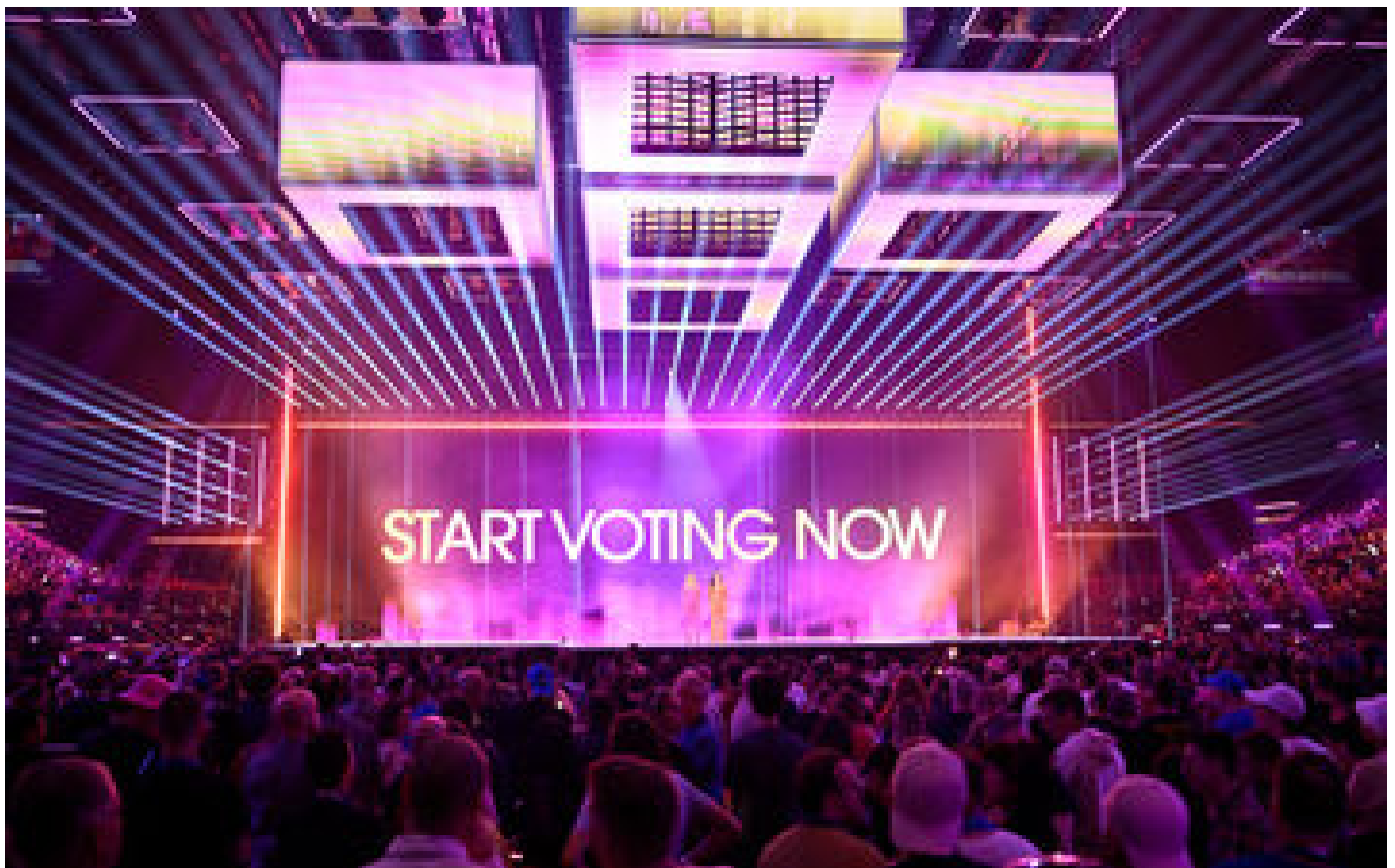
Eurovision 2024 : points, jury, ex-aequo... tout ce qu'il faut savoir sur les votes