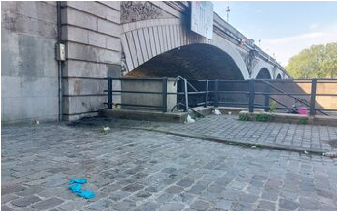
Paris : le corps démembré de la valise est celui d'un « homme adulte », un suspect en garde à vue