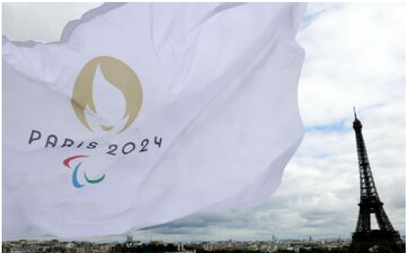
JO Paris 2024: les inscriptions pour obtenir les laissez-passer ouvrent ce lundi