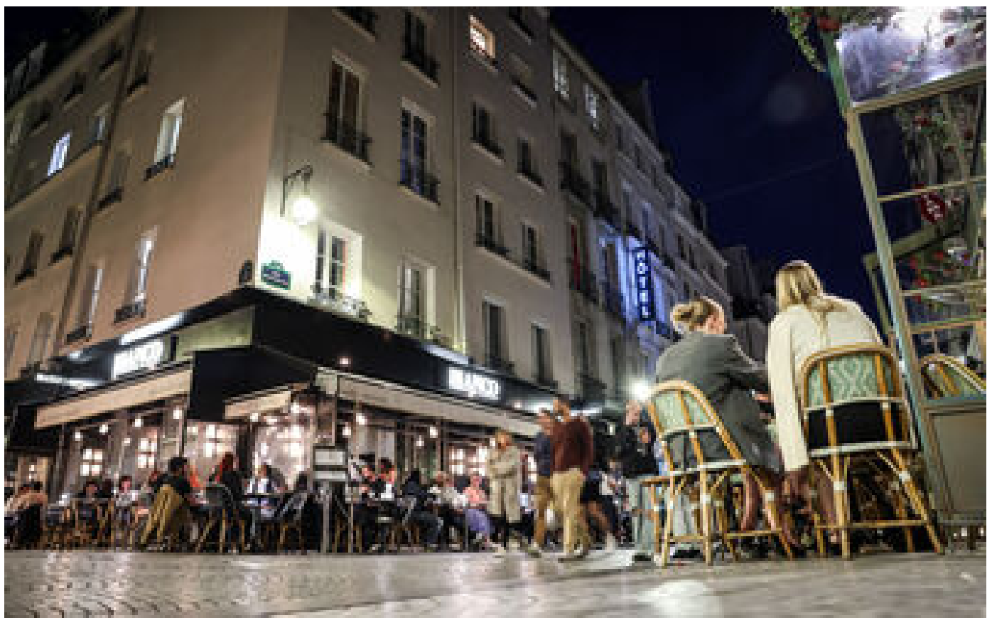
Nuisances sonores : excédés, des Parisiens mesurent eux-mêmes le bruit en bas de chez eux pour faire réagir P