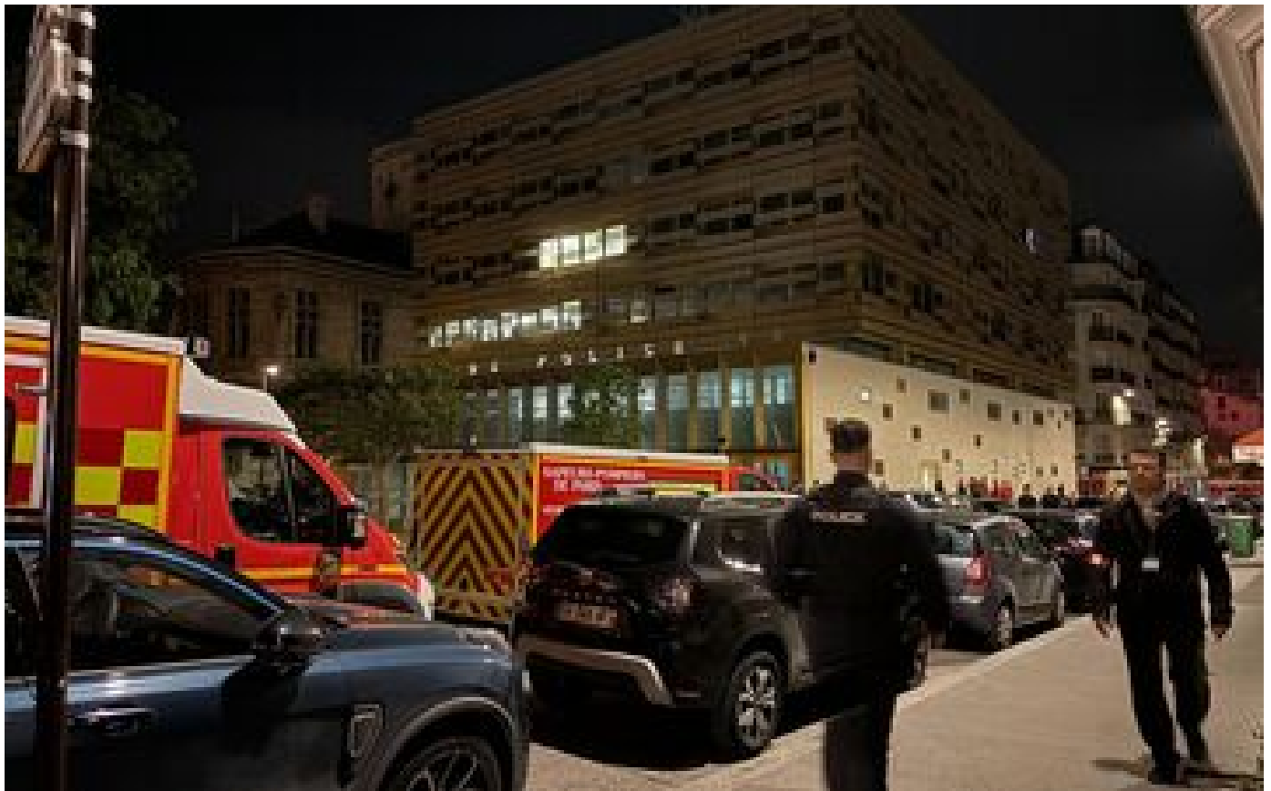
Tirs dans un commissariat parisien : l'état de santé de l'un des policiers touchés toujours « préoccupant »