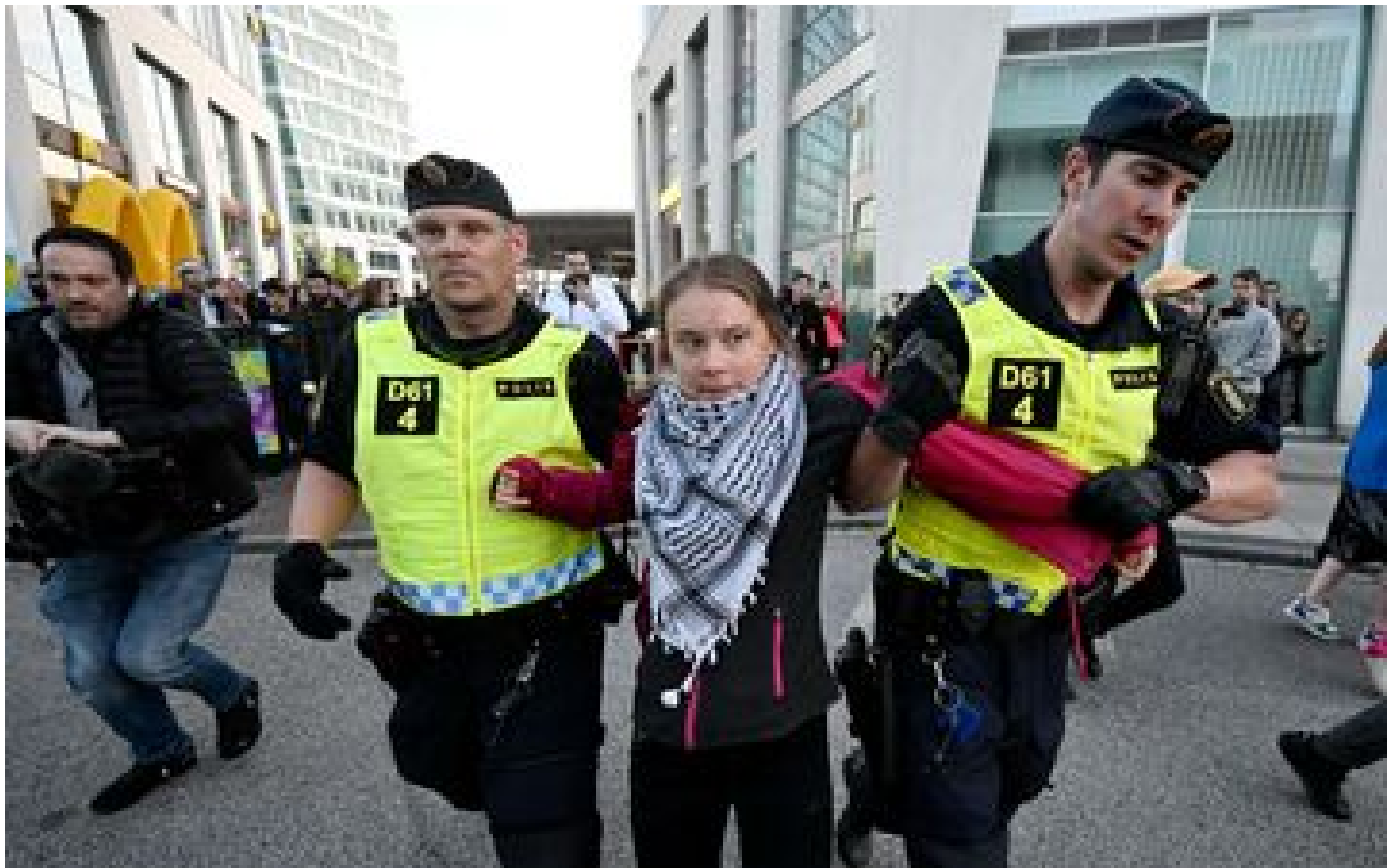
Eurovision 2024 : quelques tensions devant la Malmö Arena, Greta Thunberg interpellée