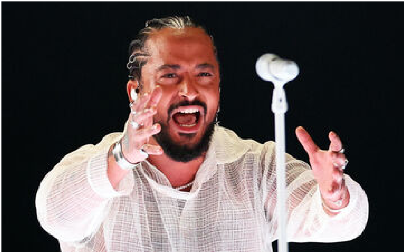
Eurovision 2024 : « Je pense qu'il y aura un avant et un après dans ma vie », l'émotion de Slimane après la finale