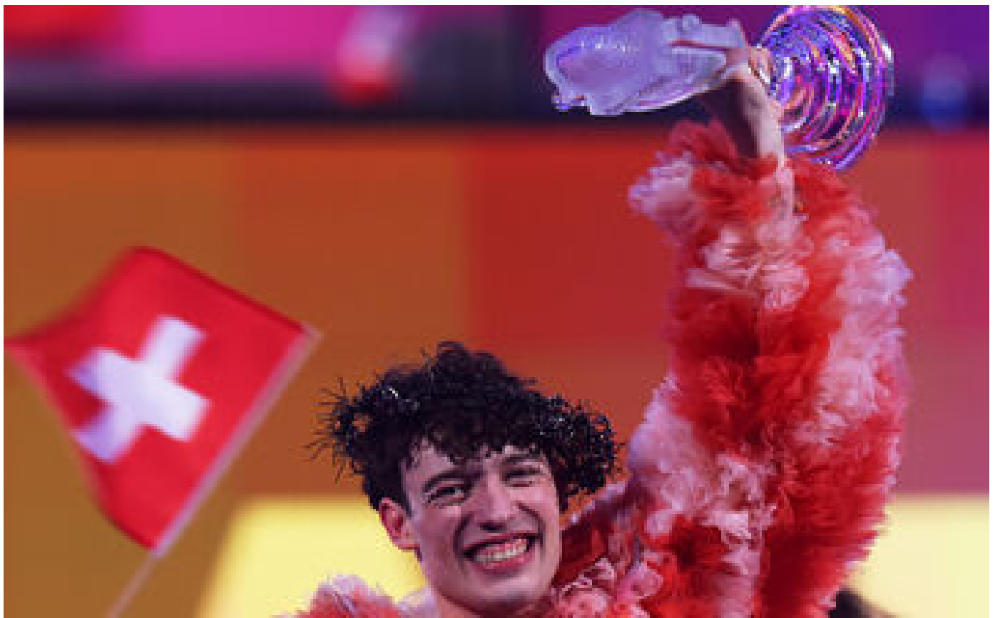
Eurovision 2024 : la Suisse explose de joie après la victoire de Nemo