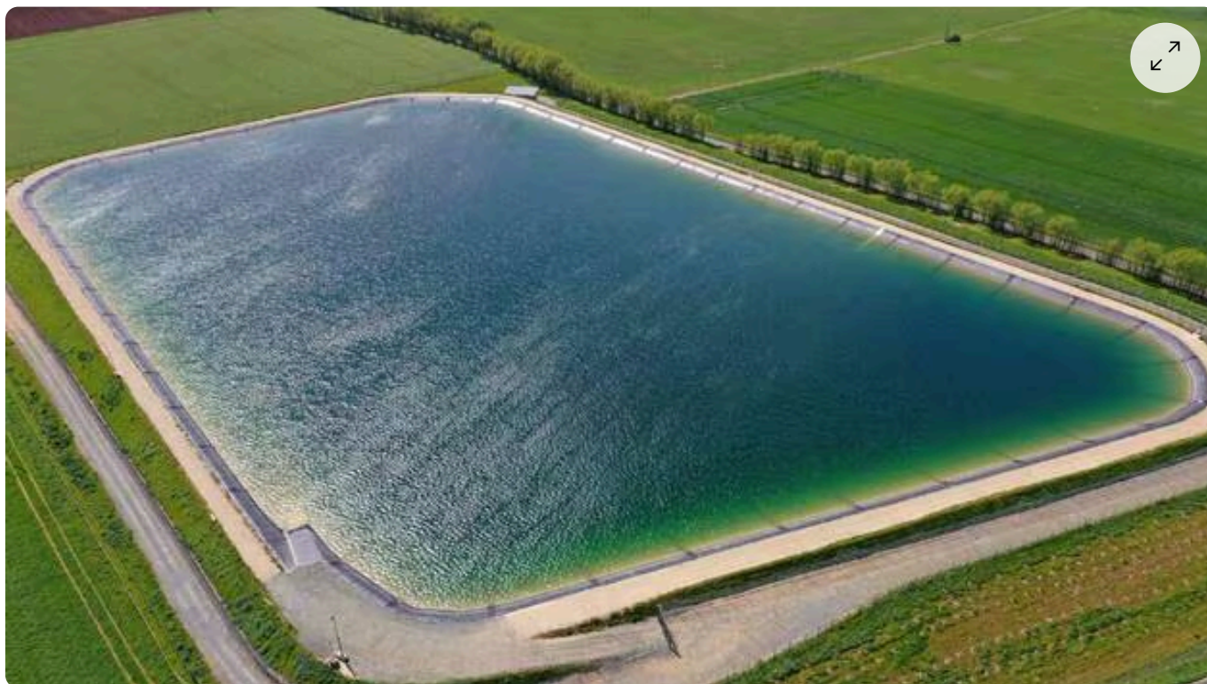
Vue aérienne d'une bassin agricole à Mauzé-sur-le-Mignon (Deux-Sèvres), le 12 avril 2023.