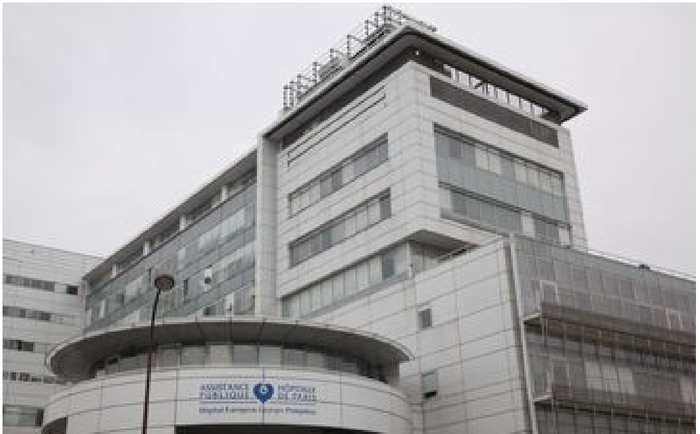
Jeune homme poignardé à Paris : la piste d'un « différend » privilégiée