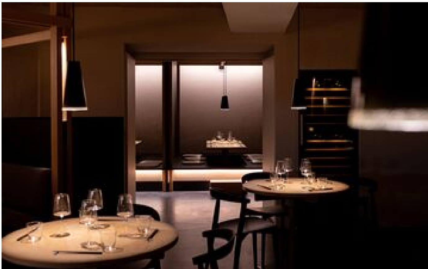
De Paris à Tokyo... le concept store japonais iRASSHAi nous fait voyager avec son resto bistrannique P