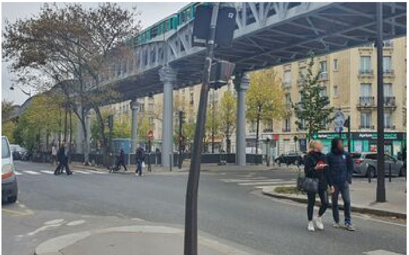
Paris : un nourrisson oublié dans une voiture, sa mère interpellée