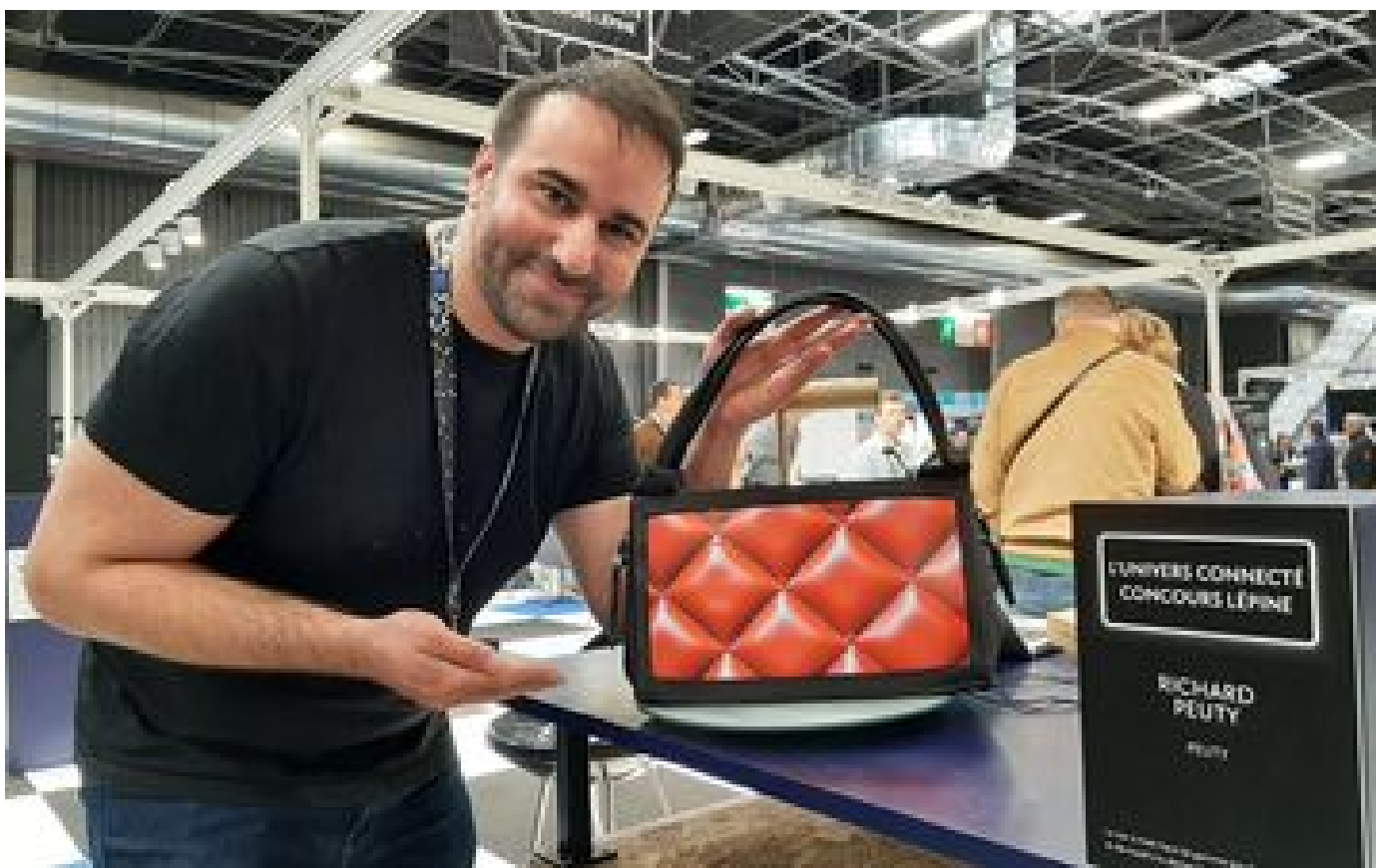
Concours Lépine : ce Val-de-Marnais invente le sac à main connecté qui change de motif en un clic P