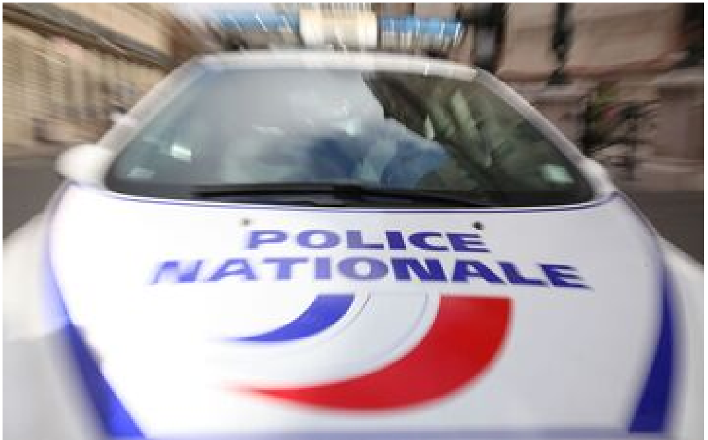
Paris : une bijouterie braquée, trois hommes en fuite