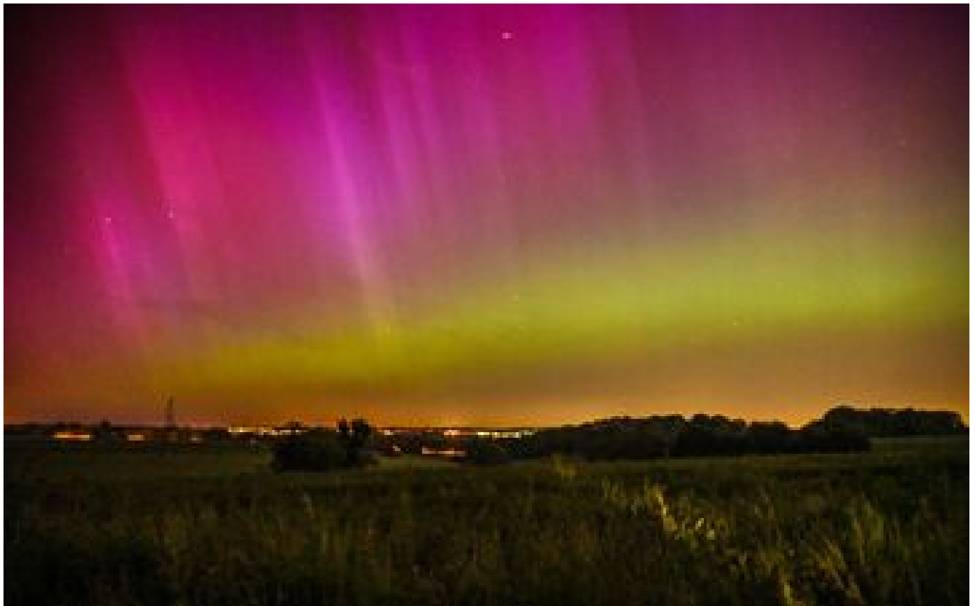
Quand les aurores boréales illuminent le ciel en Île-de-France et dans l'Oise : « Un moment magique » P