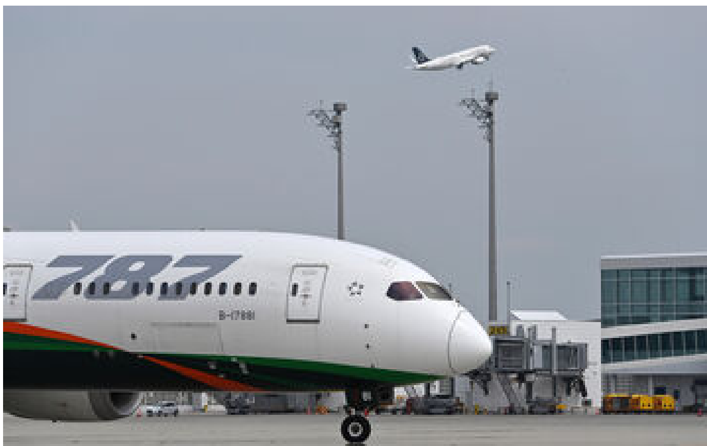
Boeing : une enquête ouverte aux États-Unis pour des suspicions de falsifications de documents