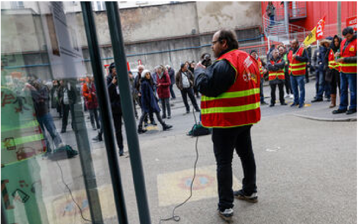
L'exécutif refuse un second texte pour réformer le droit de grève dans les transports P