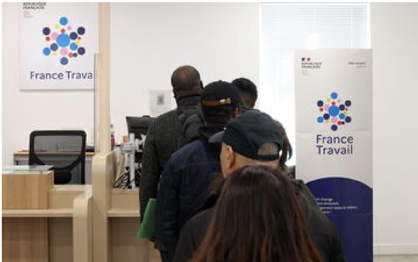
France Travail : des chômeurs obligés de rembourser entre... 5 000 et 100 000 euros après un bug