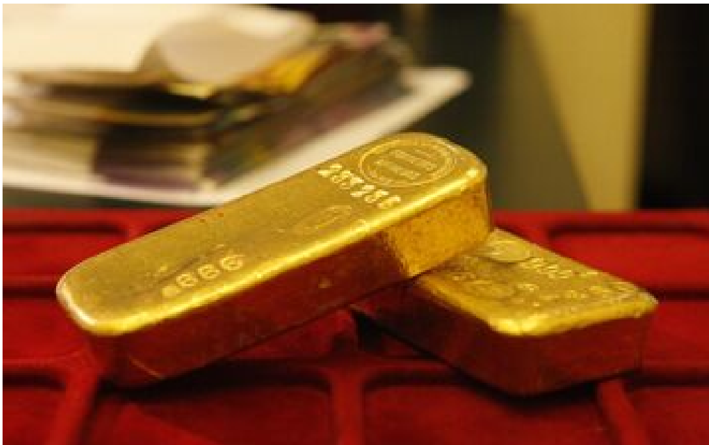
Paris : les faux policiers s'emparent de 300 000 euros d'or dans le coffre de l'horloger P