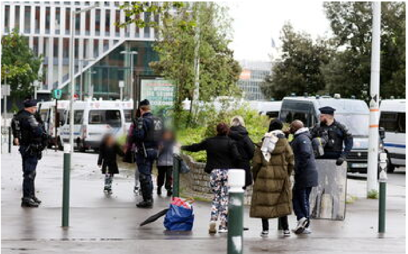
Mort de Nahel : à Nanterre, le quartier se fige pour la reconstitution du drame