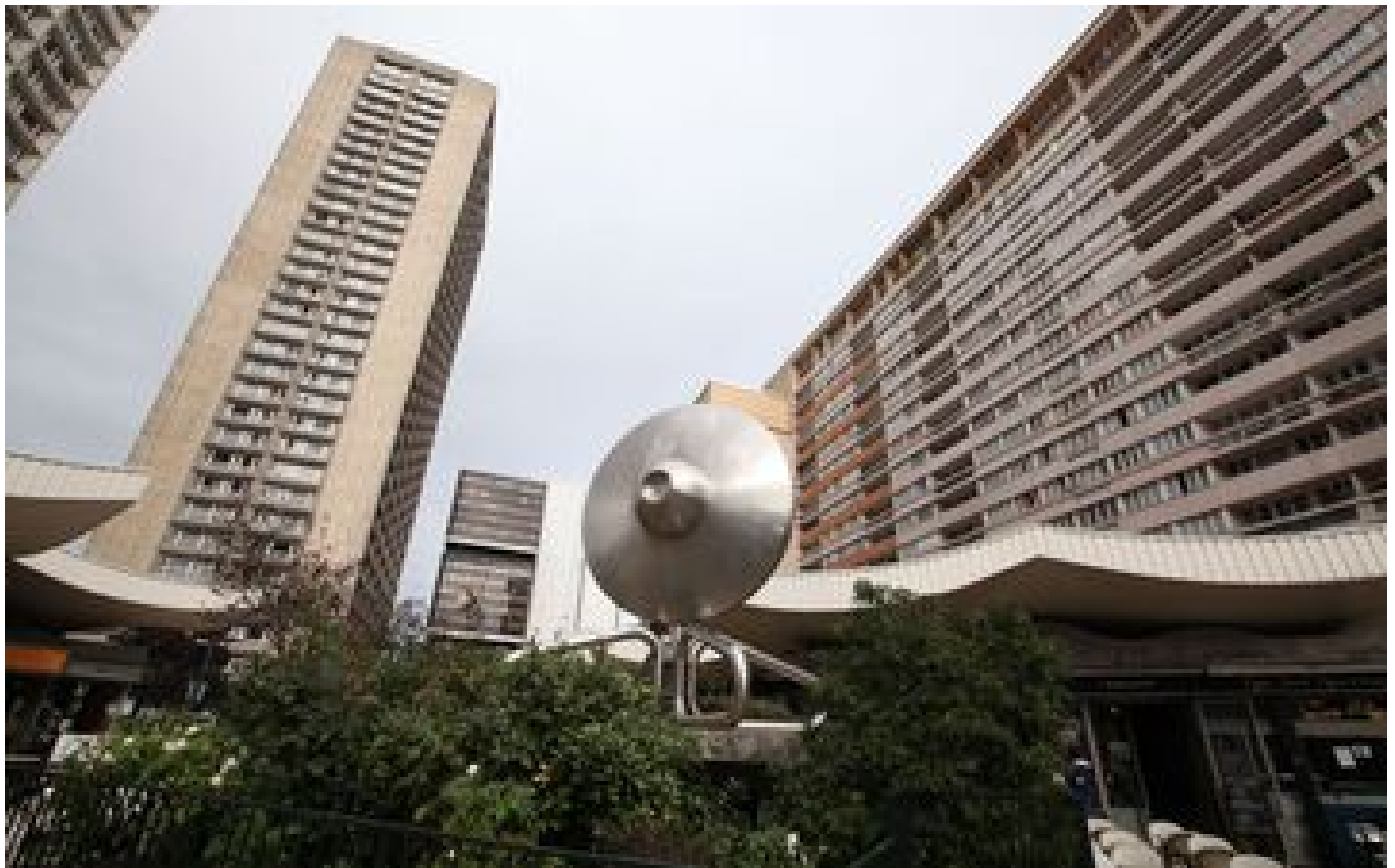
Paris : de faux livreurs s'attaquent à une famille des Olympiades