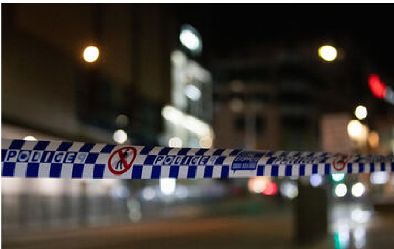
Australie : nouvelle attaque au couteau, un adolescent de 16 ans « radicalisé » abattu par la police