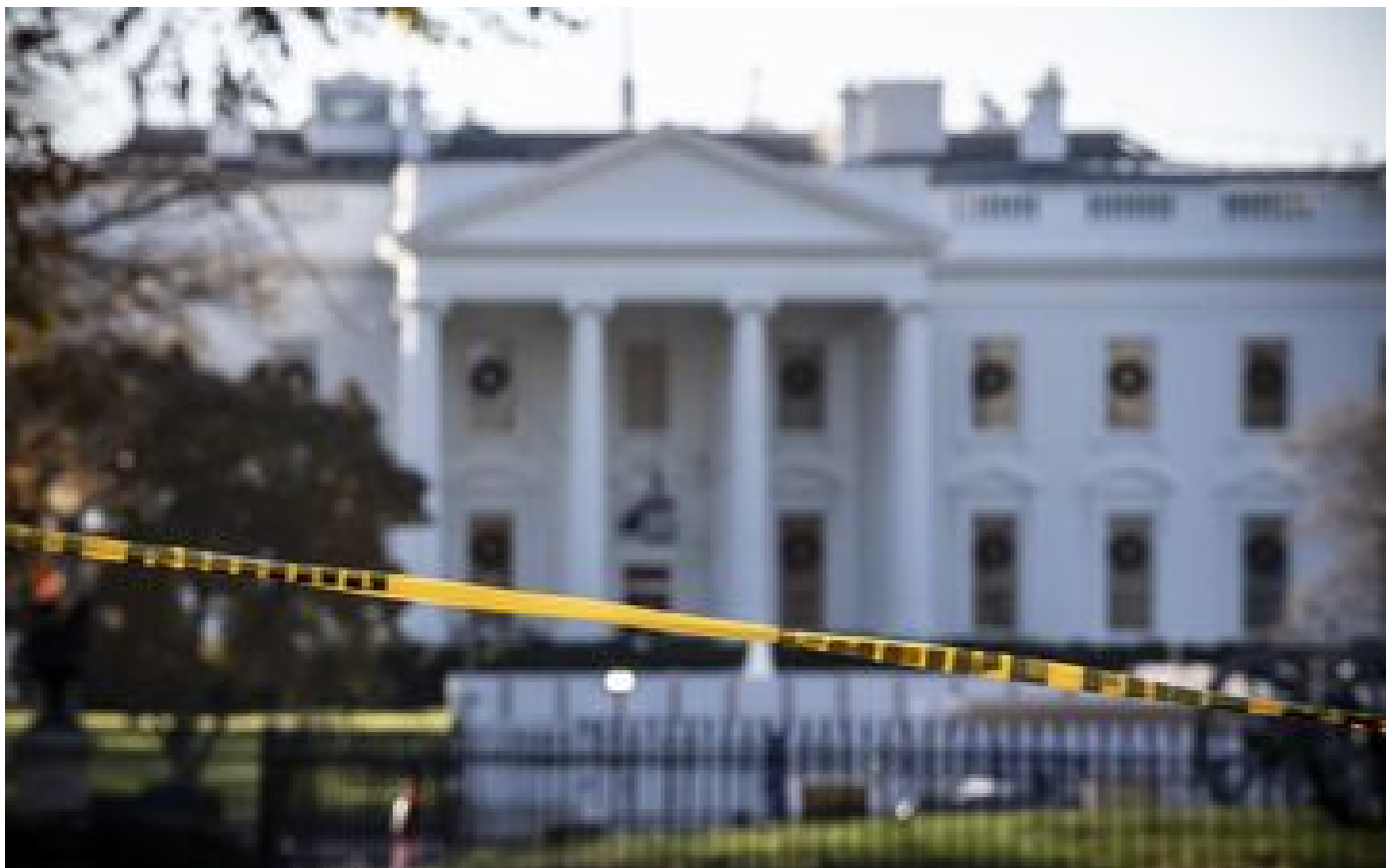
Etats-Unis : une voiture s'écrase contre une grille de la Maison Blanche, le conducteur tué