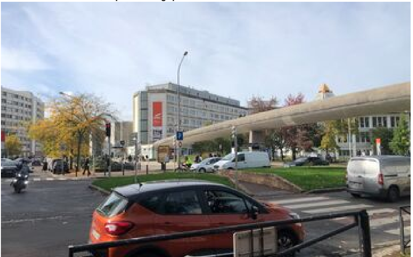
Val-de-Marne : l'agresseur de la magistrate poursuivi pour tentatives de viol reste en prison P