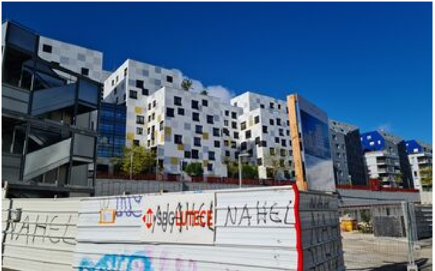
Reconstitution de la mort de Nahel : Nanterre n'a pas oublié le drame mais « les gens ont un peu digéré » P