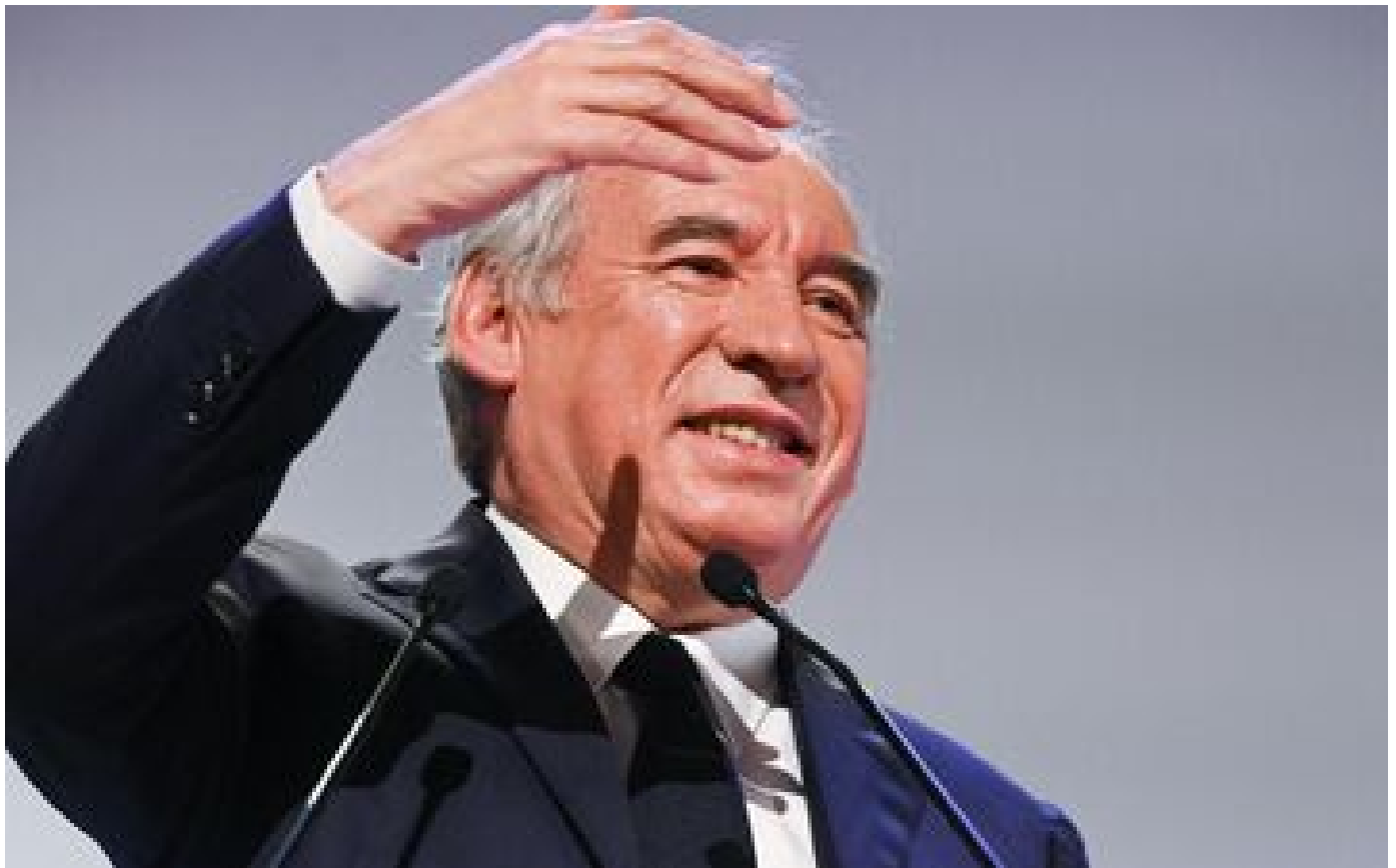
François Bayrou appelle le gouvernement à discuter d'une hausse ciblée des impôts