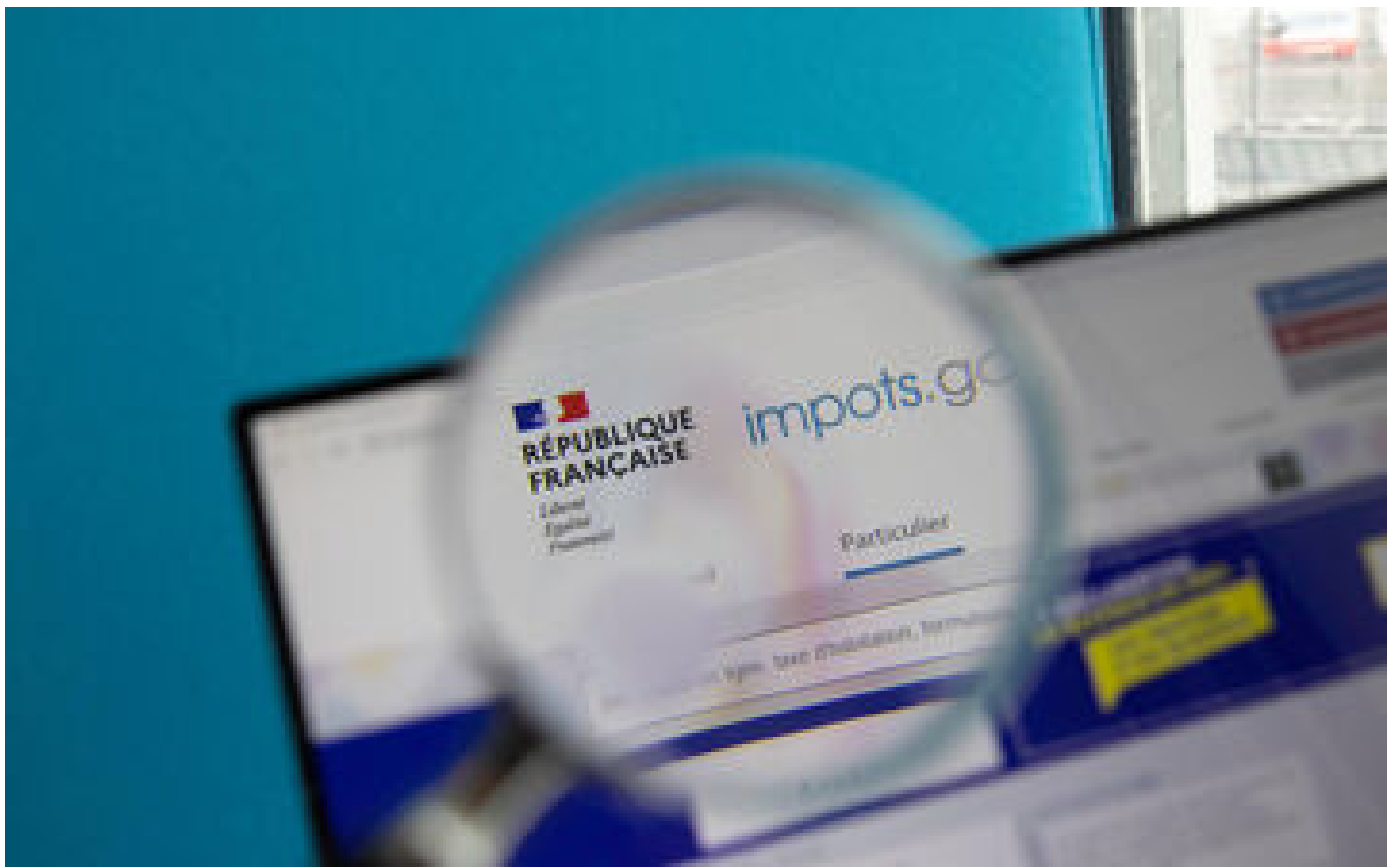
Impôts 2024 : jusqu'à quelle date pourrez-vous remplir votre déclaration de revenus ?