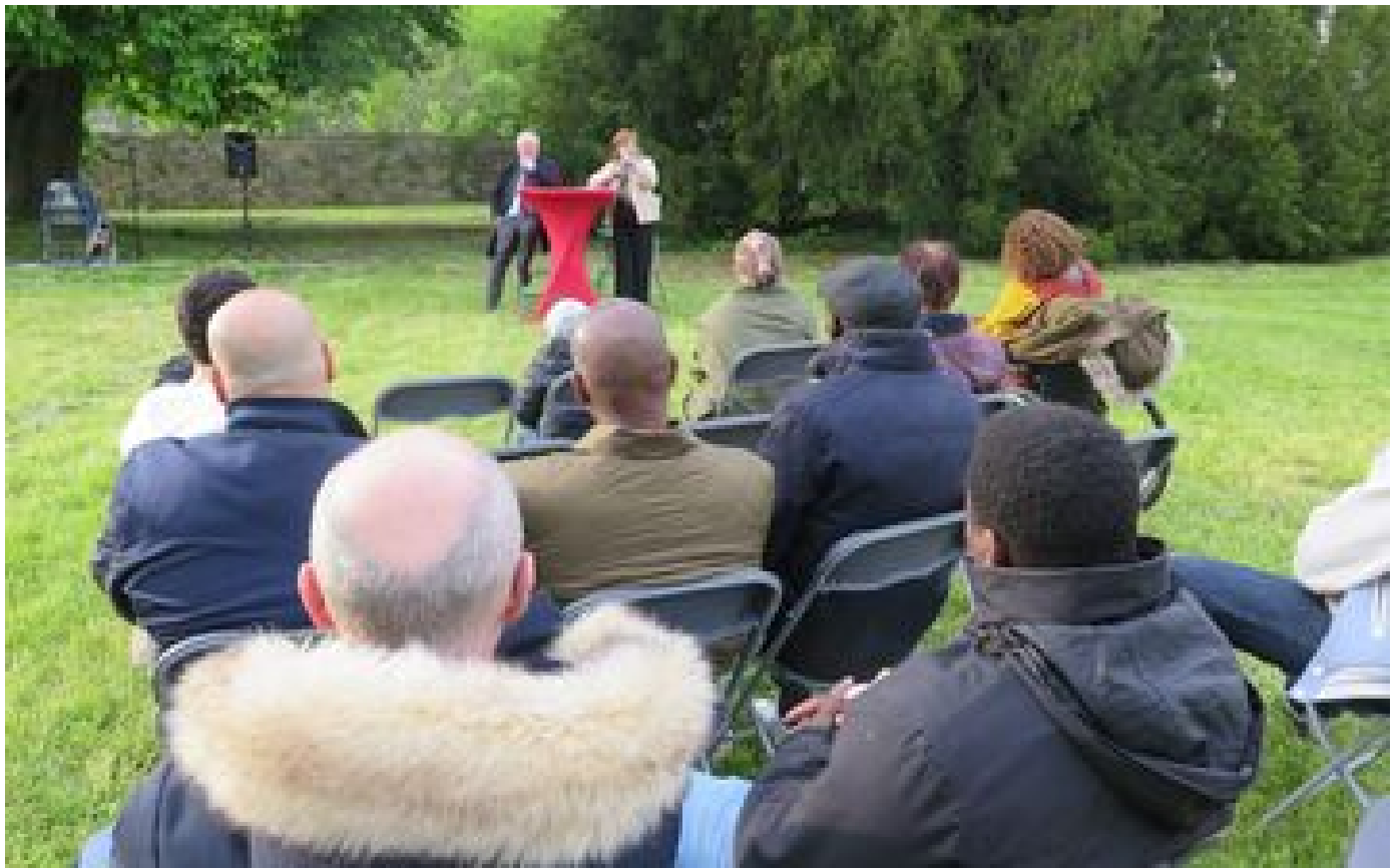
Avec sa Fabrique citoyenne, Cergy tente de pousser la démocratie participative jusqu'au bout P