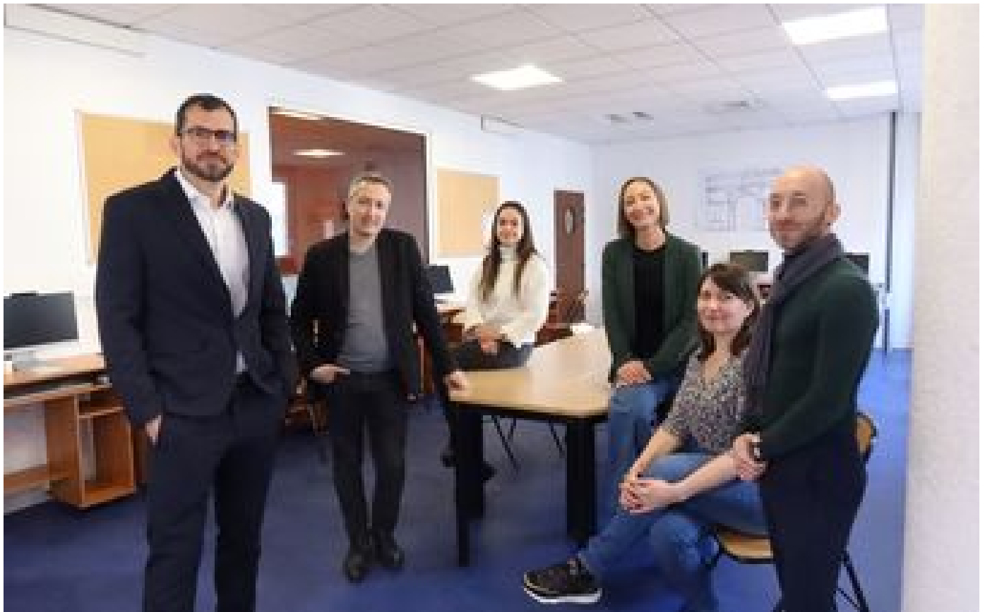
Val-d'Oise : l'école de la deuxième chance renaît de ses cendres P