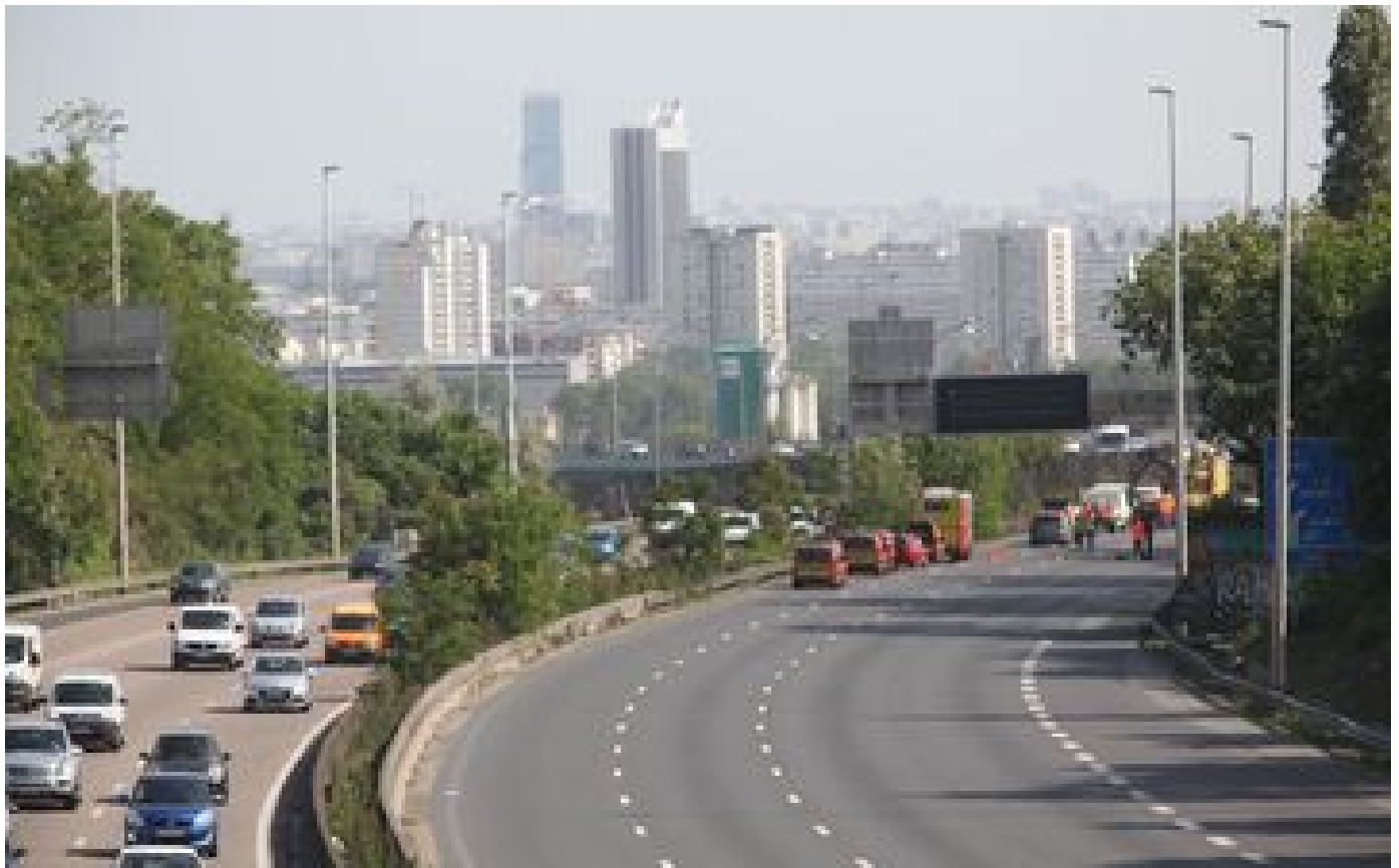
A13 fermée : comment l'A15 a été bloquée pendant 10 mois en 2018, après un problème sur le viaduc de Gennevilliers P