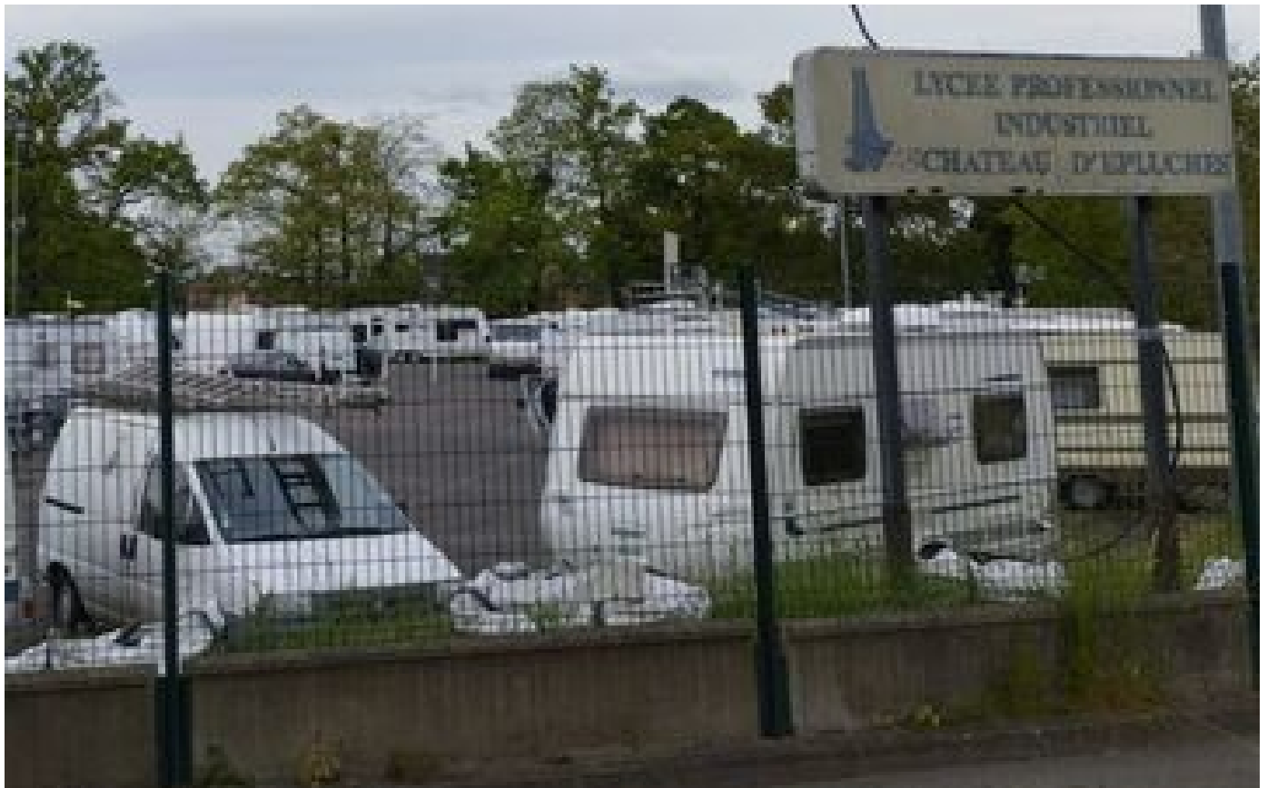
Saint-Ouen-l'Aumône : pas de cours au lycée après l'arrivée des gens du voyage P