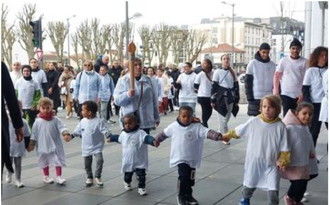
Bezons : privée de flamme olympique, la commune a créé sa propre version... en bois ! P