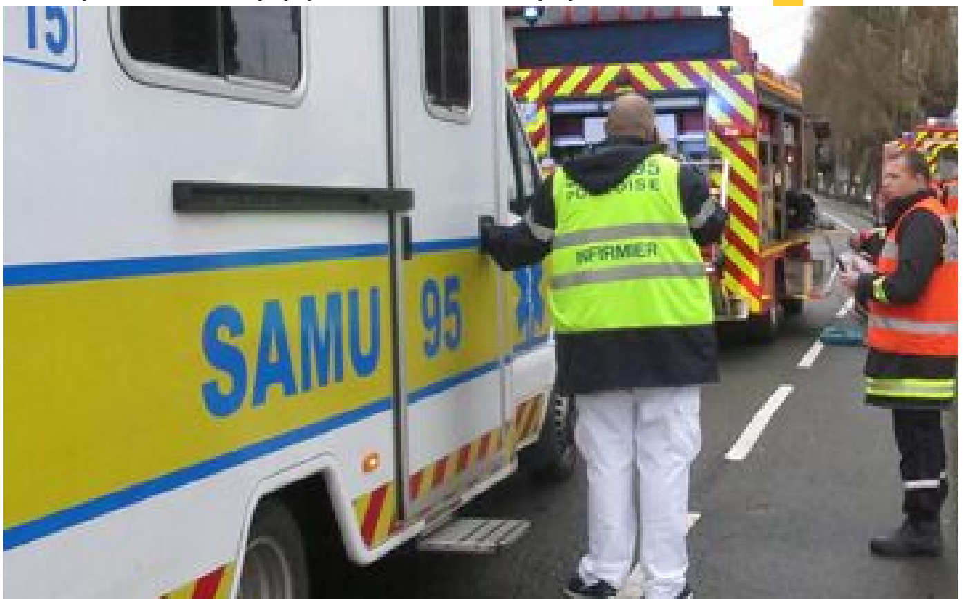
Bezons : victime d'un arrêt cardiaque, une basketteuse s'effondre après un match