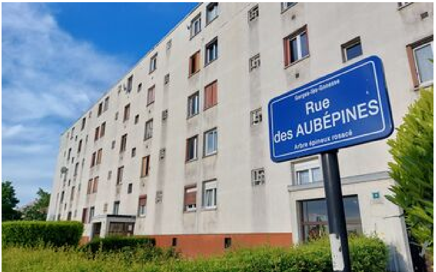
Garges-lès-Gonesse : elle avait étranglé sa fille de 21 ans avec un foulard P