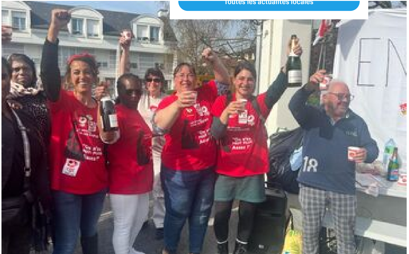
« On a gagné ! » : à Bezons, après 18 jours de grève, les salariées de l'Ehpad Arc-en-ciel crient victoire P