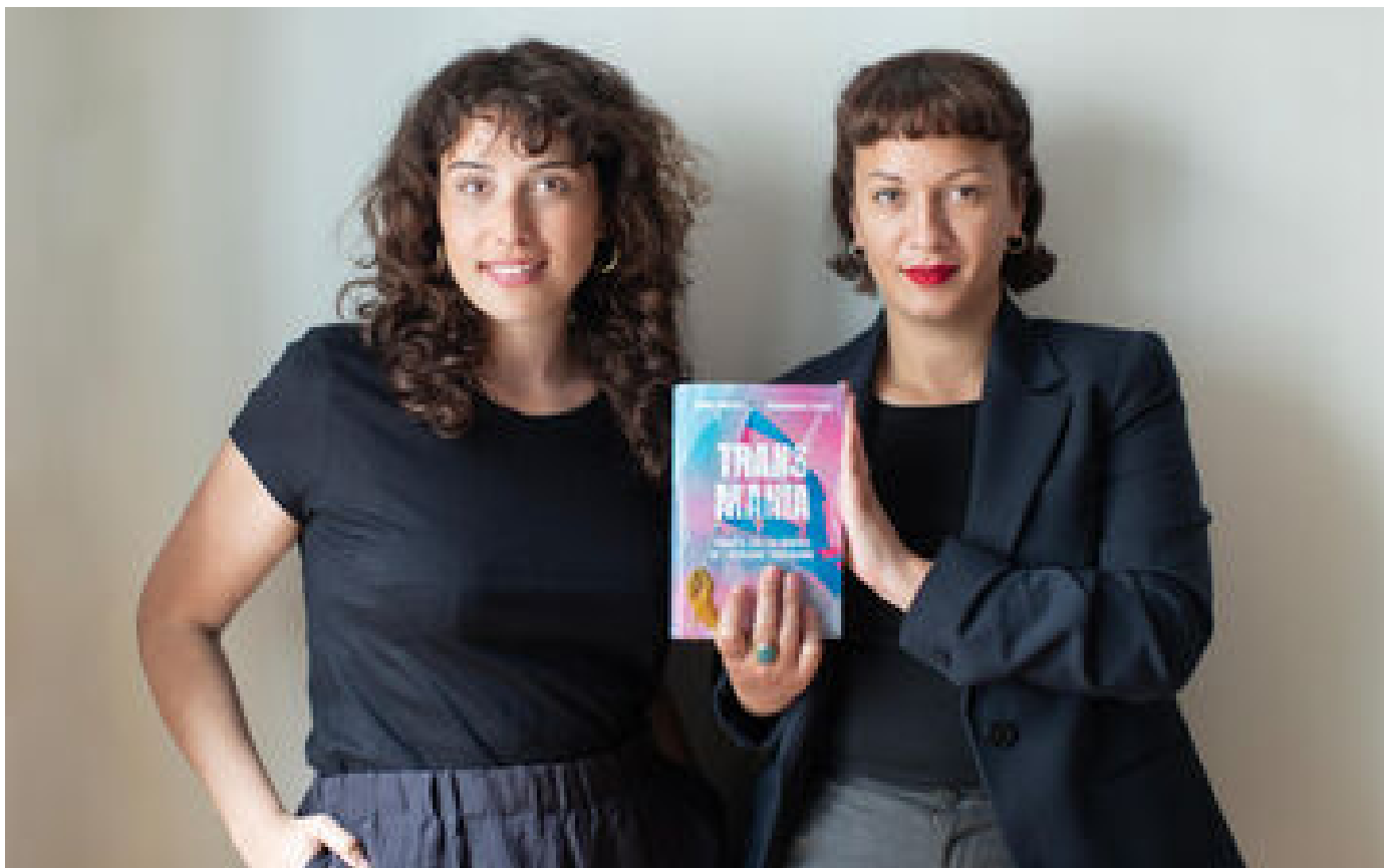
« Tissu d'ignominies » ou « franc-parler » ? « Transmania », le livre anti-trans qui met le feu aux poudres P