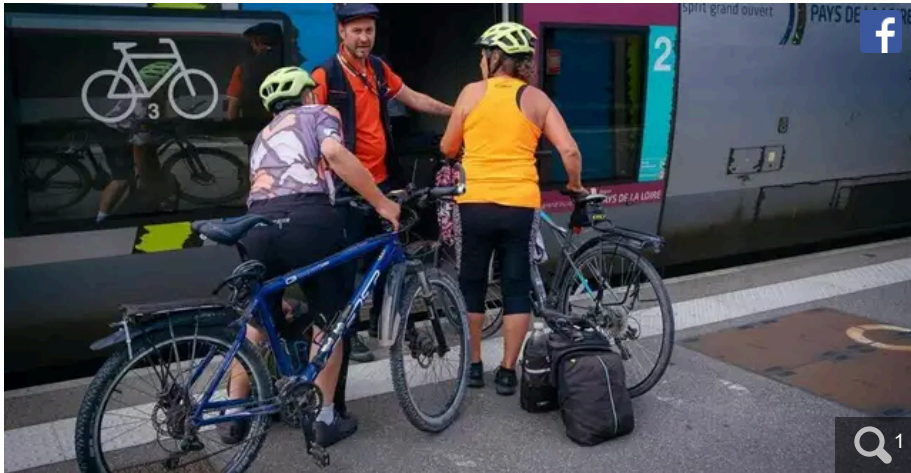
Gare de Nantes

Votre e-mail, avec votre consentement, est utilisé par la société Additi Multimedia pour recevoir les newsletters sélectionnées. En savoir plus