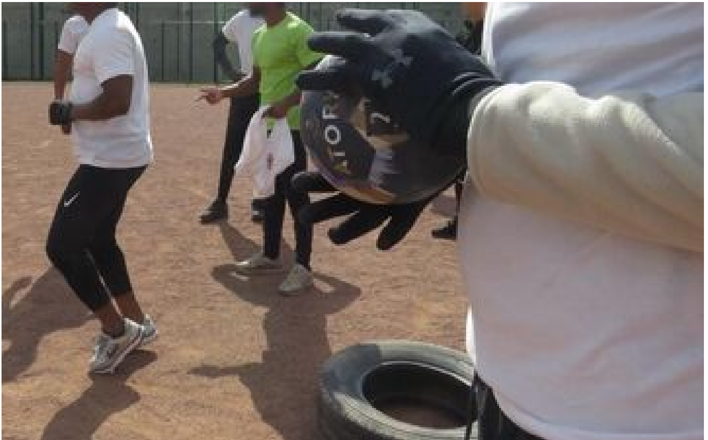
« L'esprit sportif permet le respect de l'autre » : semaine olympique à la maison d'arrêt de Villepinte P