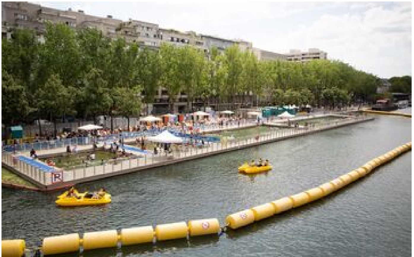
Périmètres de circulation pendant les JO : « Pour les résidents, il va falloir remplir les congélateurs » P