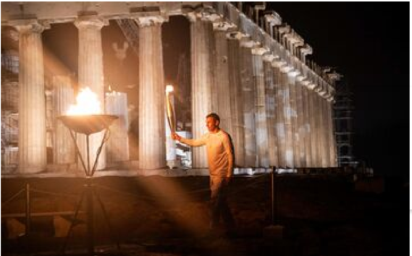
JO Paris 2024 : à Athènes, la flamme olympique va être remise à la France ce vendredi