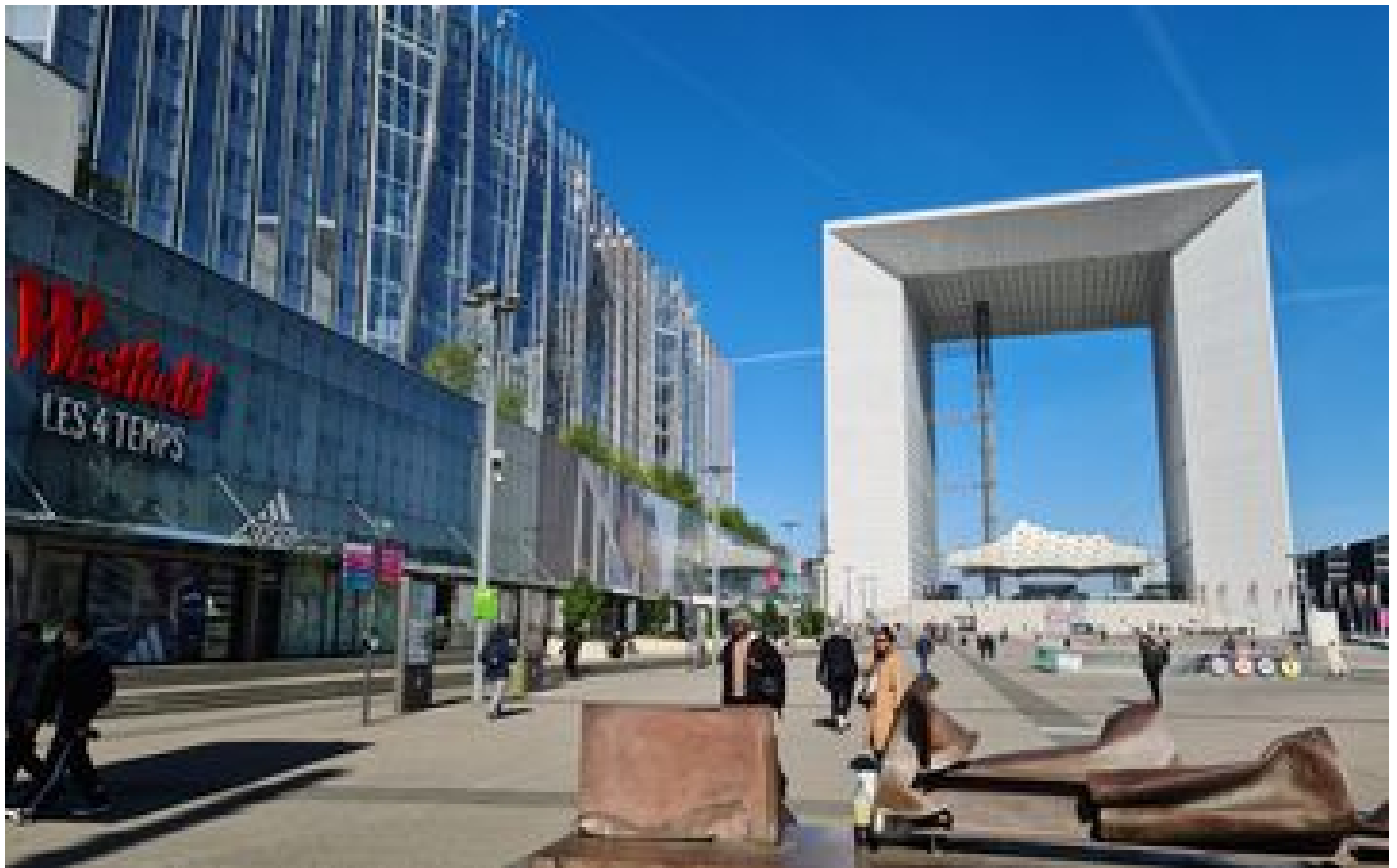
Risque d'attentat à La Défense pendant les Jeux : « On n'est pas plus inquiets, on vit avec au quotidien » P