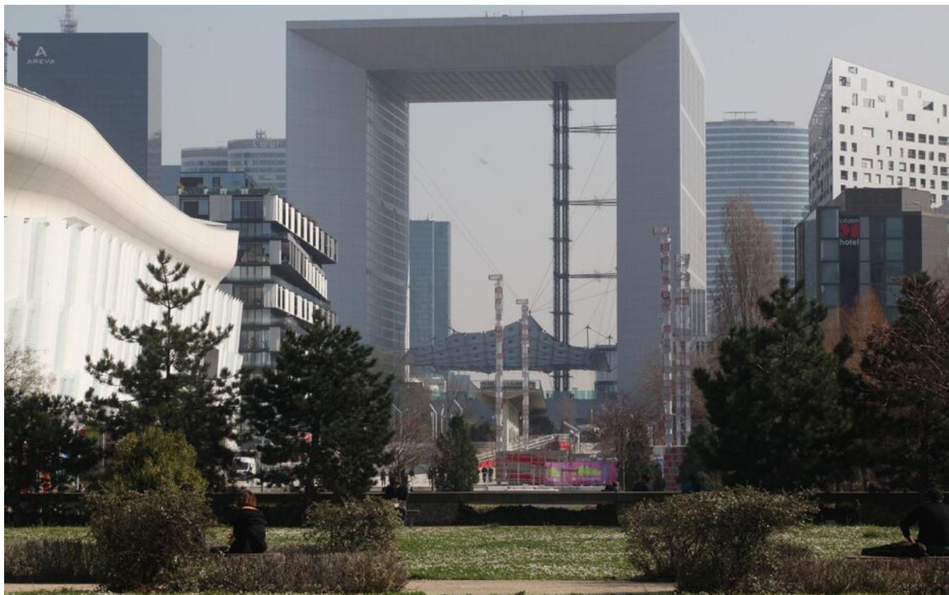
Le quartier d'affaires de La Défense.

Le 24 avril 2024 à 18h21, modifié le 24 avril 2024 à 18h22