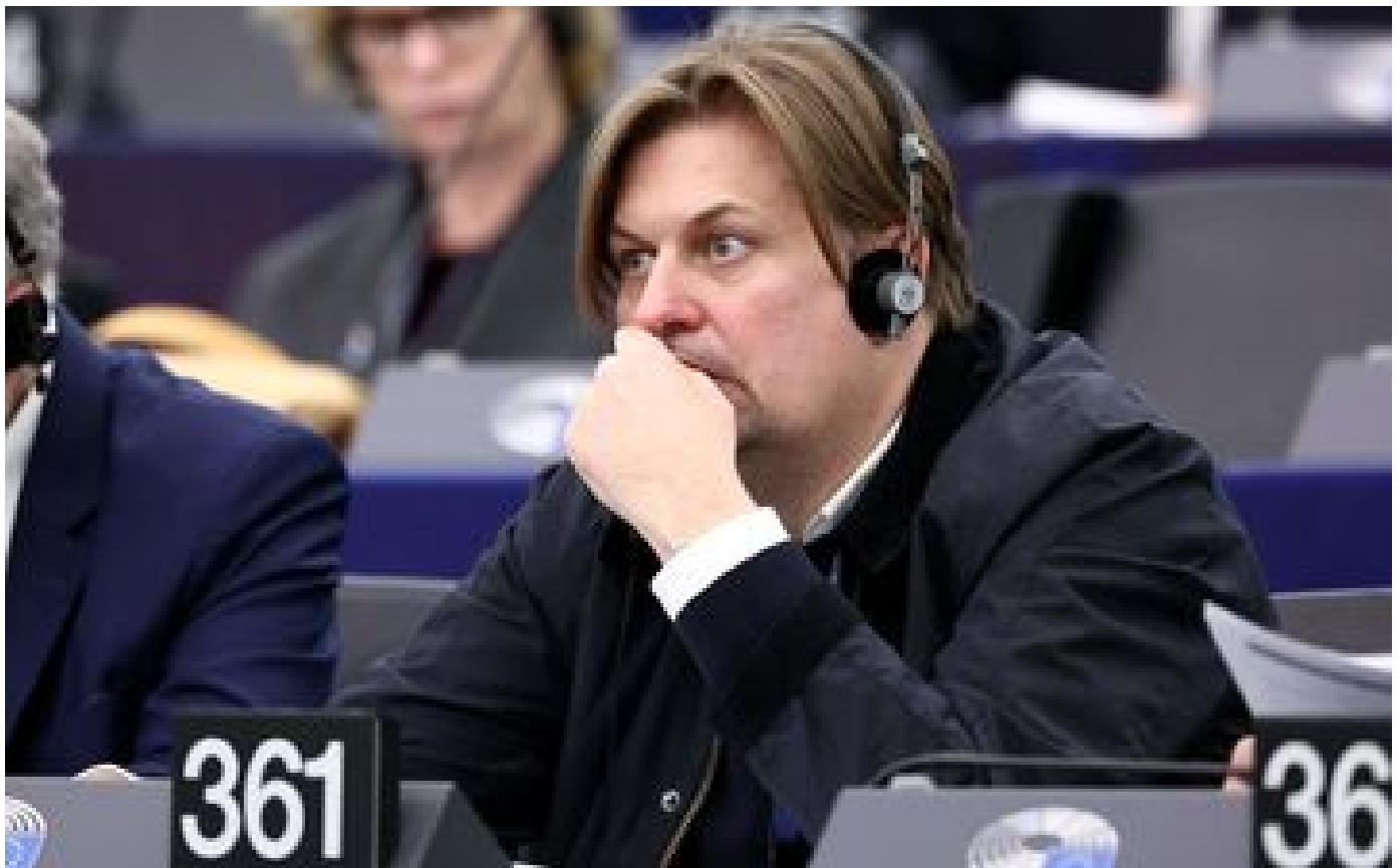
« ChinaGate », le nouveau scandale d'ingérence au Parlement européen P