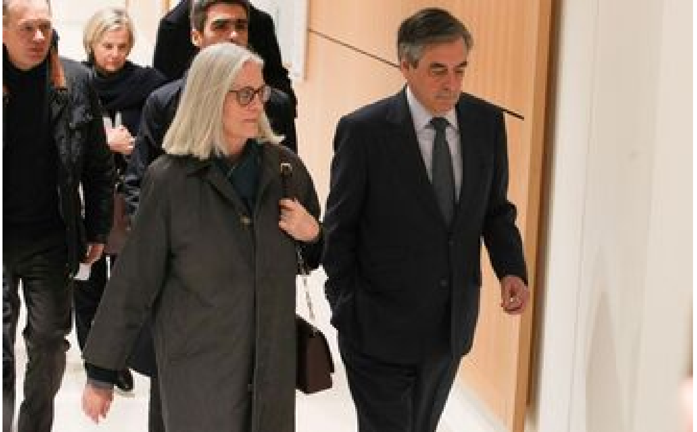
Affaire Fillon : la Cour de cassation tranche ce mercredi