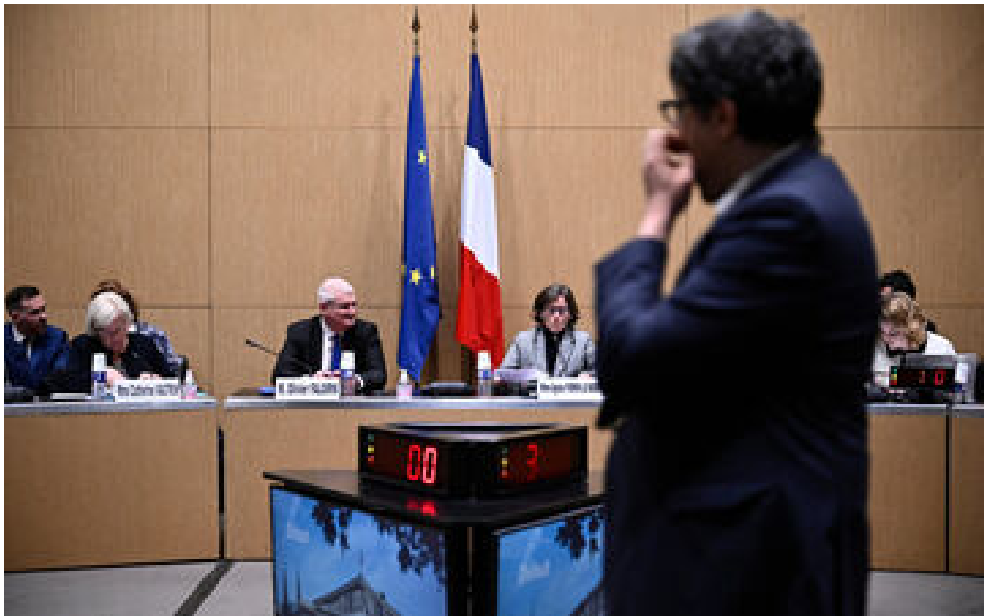
Commission spéciale sur la fin de vie : un débat apaisé... pour l'instant P