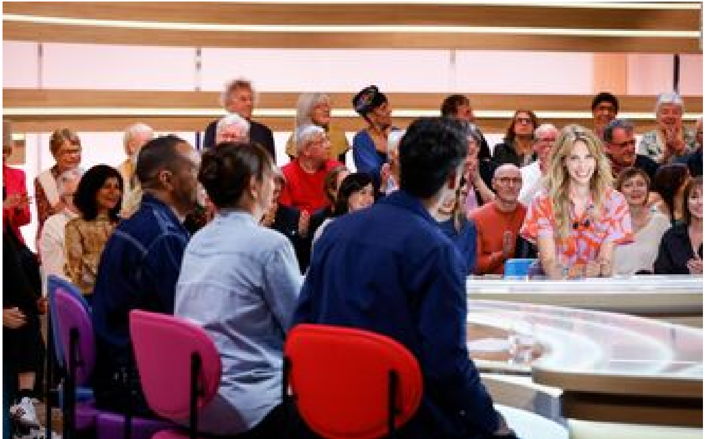
Audiences TV : débuts difficiles pour Ophélie Meunier, « Cassandra » en hausse