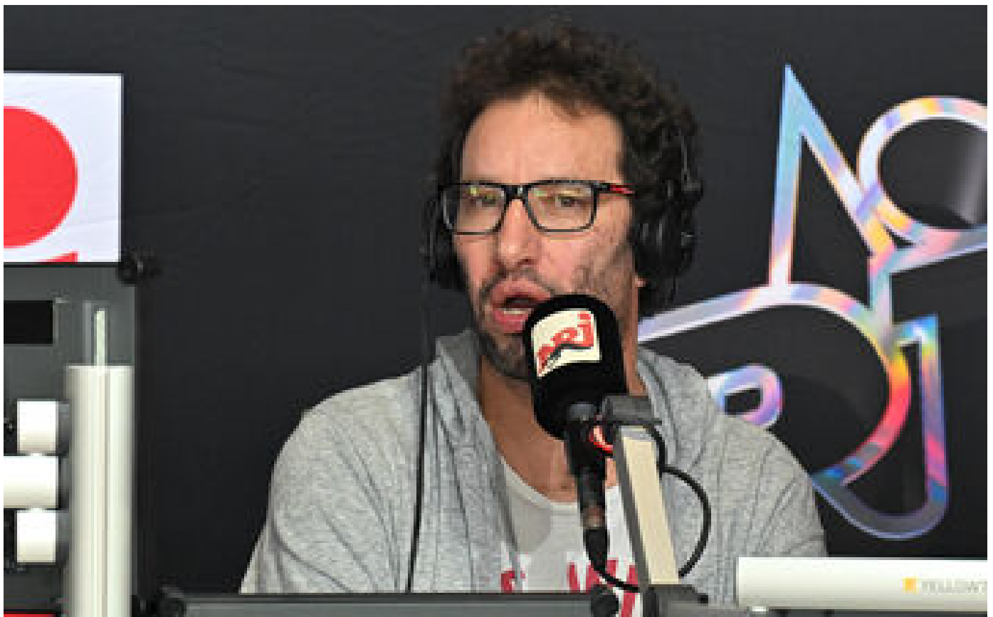
Cauet, Manu Levy : NRJ dans la tourmente après les séries d'accusations contre ses animateurs phares P