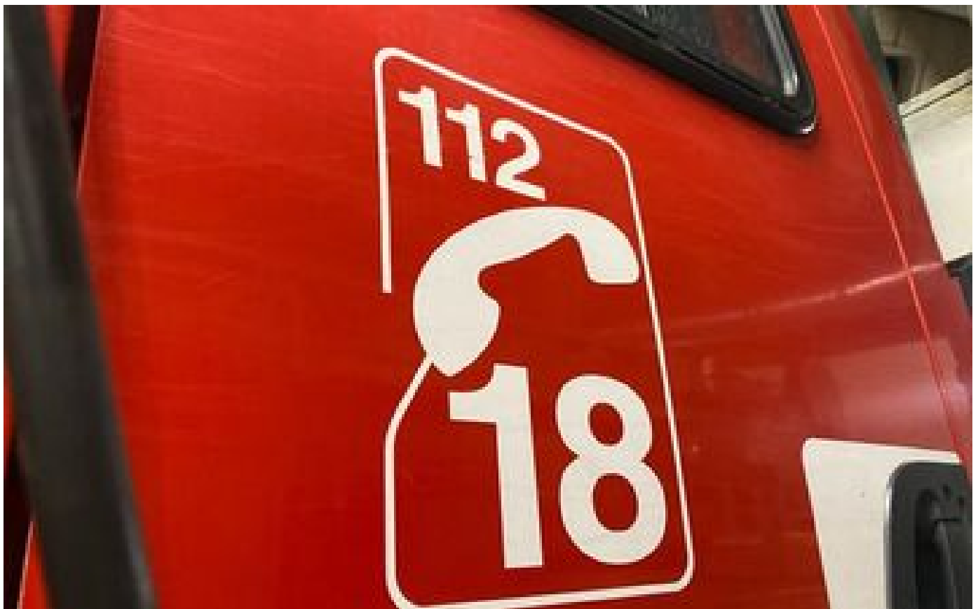
Landes : un petit garçon de 2 ans retrouvé noyé dans un étang