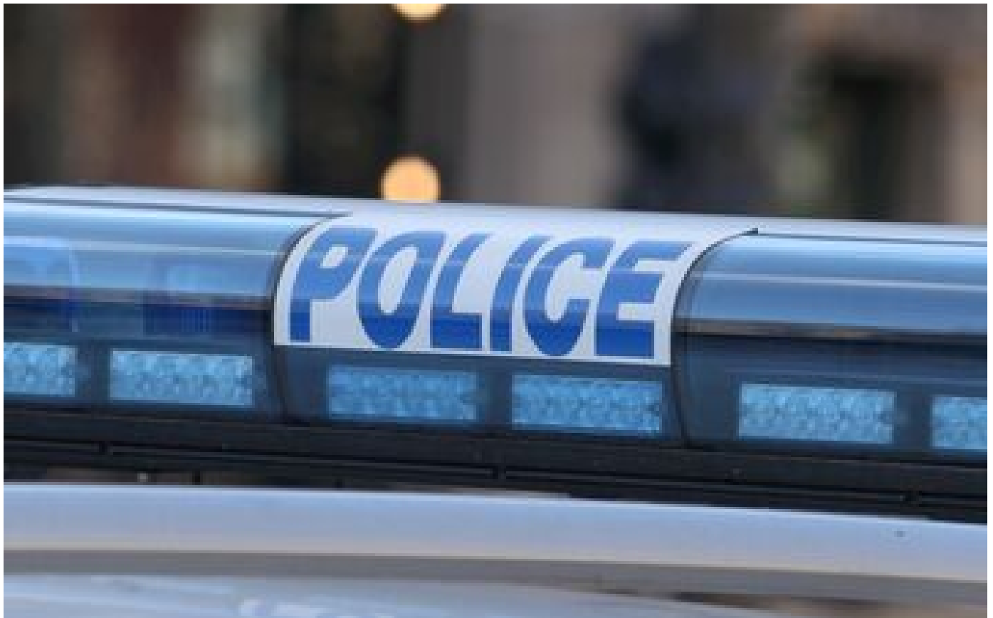
Morbihan : une voiture fonce dans la vitrine d'un restaurant, le conducteur en détention provisoire