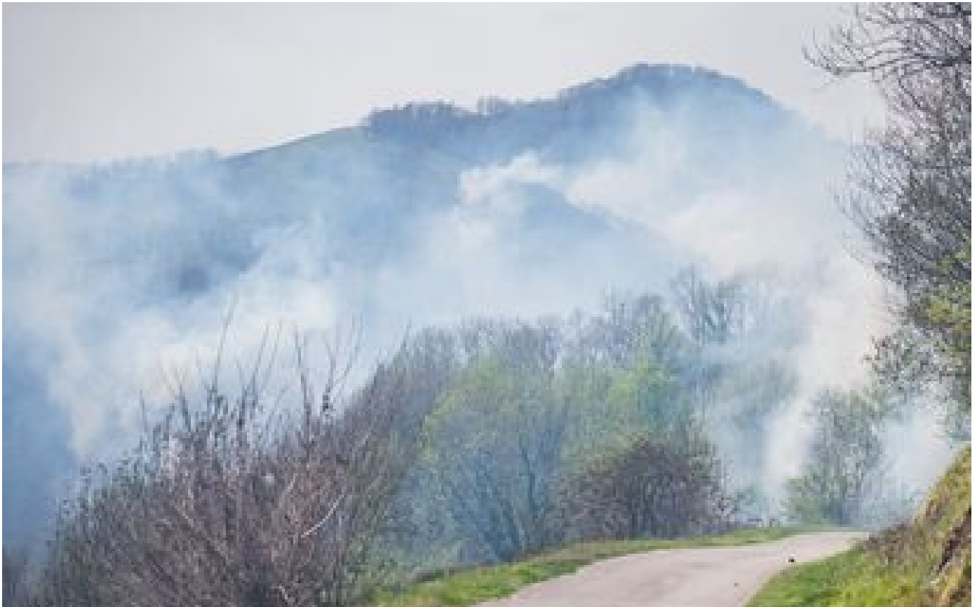
Incendies dans le Pays basque : 150 hectares de végétation brûlés, les deux foyers maîtrisés